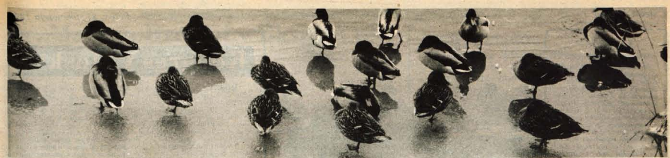
Počitek ob vodi — Dolg skupinski polet ali pa zgolj naključje, da so se race zbrale ob vodi v vsejsvoji pisani lepoti in v svojem mirnem počitku obiskovalcem ponudile enkratno privlačen pogled v naravo, ki jo je ogrevalo toplo zimsko sonce. (ds) — Foto: F. Perdan