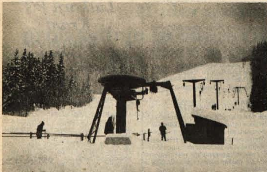
Vlečnica Mali vrh na Jezerskem