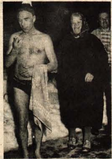
Ali je to mogoče, so se spraševali občudovalci pogumnih Kamničanov, ki so morali odgovarjati na številna vprašanja