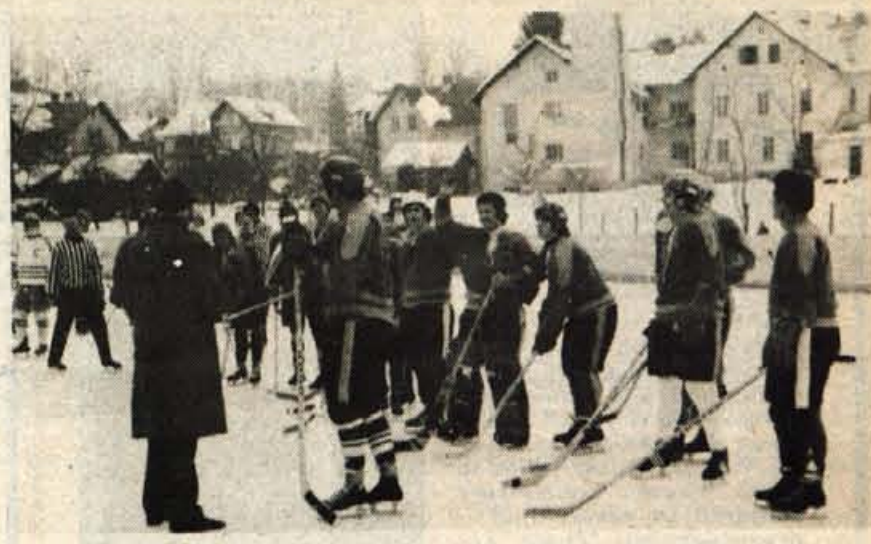
Hokejska ekipa Bleda je letošnji republiški prvak. V zahodni skupini so premagali Trzič, s Prevojami pa so imeli boljšo razliko v golih. Kot prvaki zahodne skupine so se pomerili naprej v Celju z ekipo Velenja, kjer so zmagali z 10:9, v povratnem srečanju pa so na Bledu odpravili goste kar z 11:2.