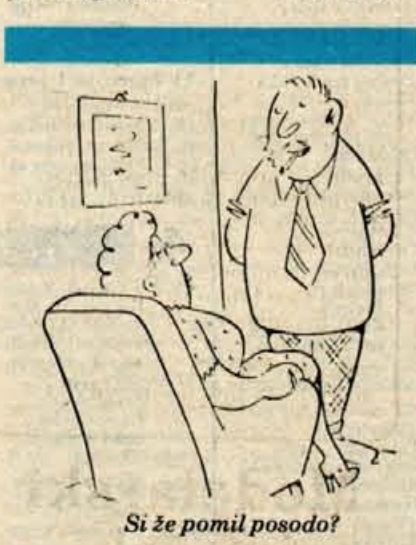
Si že pomil posodo?