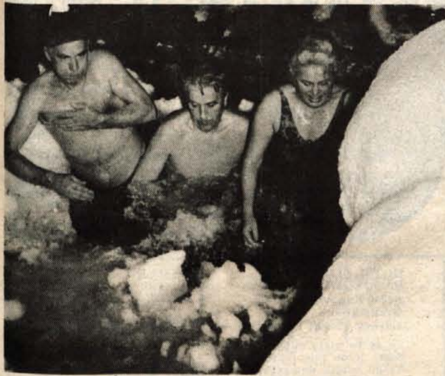
Pogumni Kamničani se takole namakajo v ledenomrzli jezerski vodi