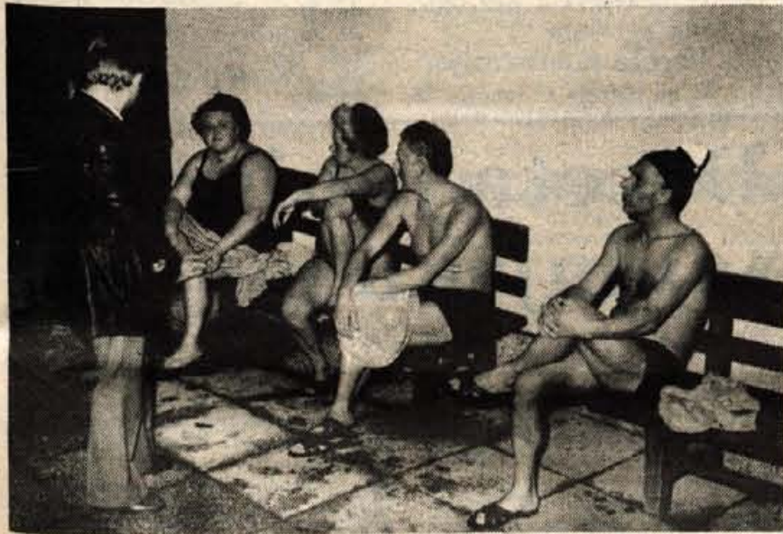
Po jezerski kopeli kopalci najraje posedejo na bližnjo klopeco ob jezeru