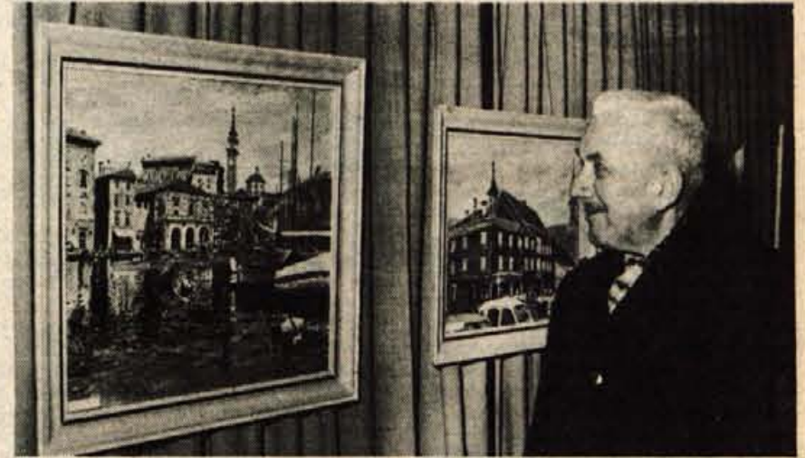
Za slovenski kulturni praznik so v dvorani radovljiške graščine odprli razstavo članov amaterske likovne skupine LIKOR iz Radovljice