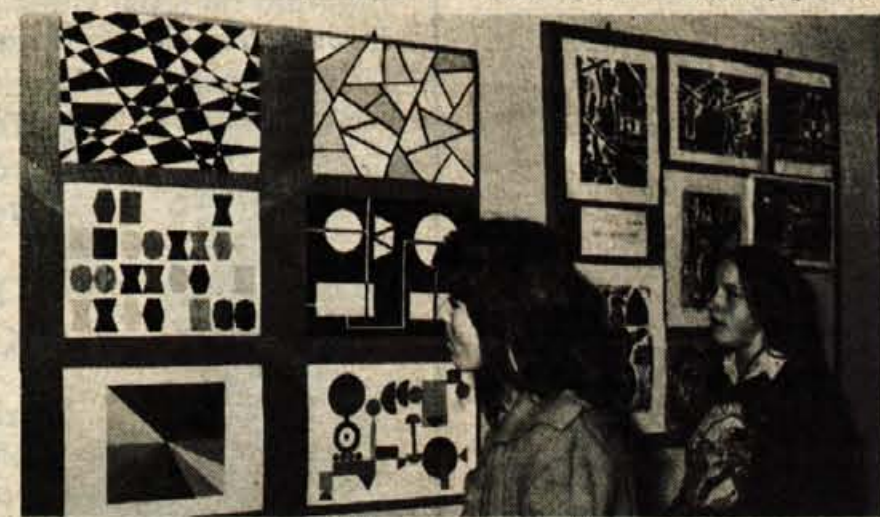
V CERKLJAH POČASTILI PREŠERNO DAN — Na osnovni šoli Davorin Jenko v Cerkljah so izredno lepo počastili 8. februar, dan smrti Franceta Prešerna. V avli šole so pripravili slikarsko razstavo učencev osnovne šole (na fotografiji) in razstavo knjig od Trubarja do danes. Posebno uspeha je bila tudi prireditvi za člane kolektiva, starše in člane sveta šole, na kateri so se mladi predstavili z igrice Strip-strup, denarja kup! (jk)