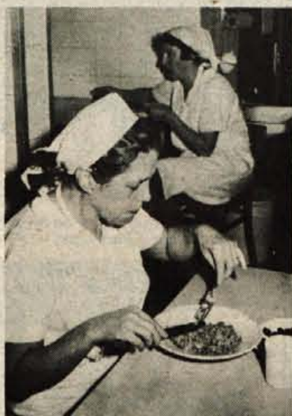
Kosilo je enako za vse: tako za otroke kot za tiste, ki so ga pripravile.

Čeprav so obroki namenjeni le majhnim želodčkom, so kotli, v katerih se hrana kuha, prav tako veliki kot v katerikoli drugi kuhinji. Kuharicam, ki vse v belem švigajo v tej vročini in sopari med kotli, štedilniki in mizami za pripravo, delo ne dovoli oddiha tja do enajste ure. Iz centralne kuhinje Vzgojno-varstvenega zavoda Kranj v vrtcu Janina in v vrtcu Makse Rozman Tatjane pripravljajo na dan okoli 1400 obrokov. Kapacitete centralne kuhinje v vrtcu Makse Rozman Tatjane v Stražišču so sicer večje kot so trenutno potrebe, kuhinja zmora namreč okoli 350 obrokov, a trenutno okoli 200 obrokov zadošča za prehrano predšolskih v vseh treh vrtcih v Stražišču. Centralna kuhinja v vrtcu Janina pa pripravlja hrano za deset vrtcev na levem bregu Save, to je okoli 800 obrokov.