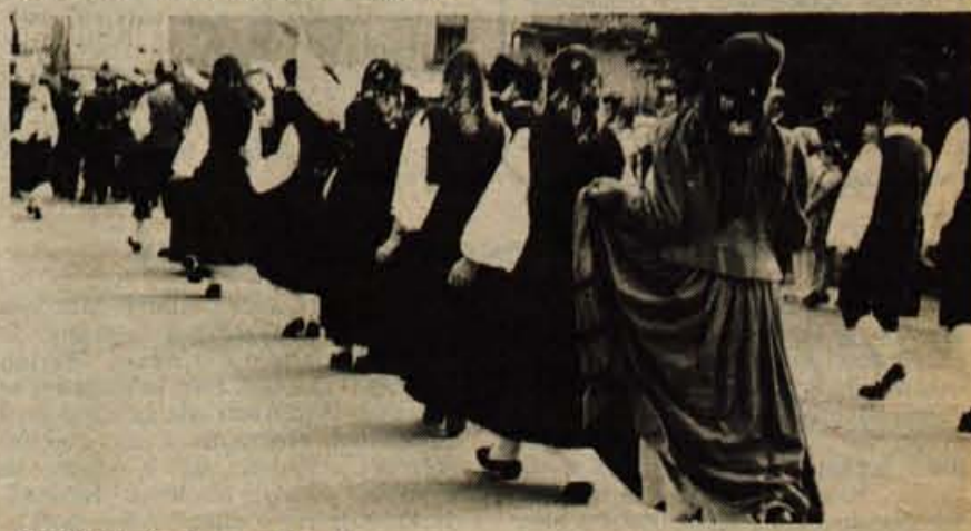
Rezijanke (v plesnem koraku)