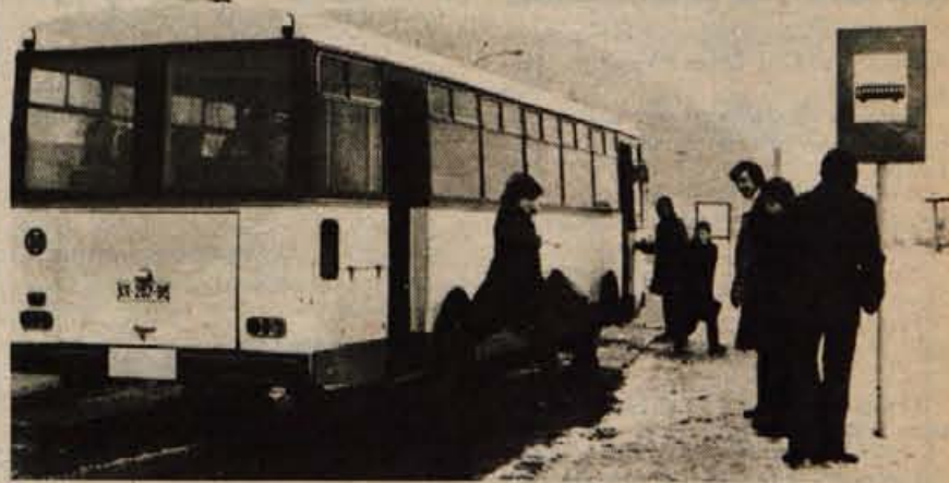
Avtobusna postaja na Laborah: pristanišče?