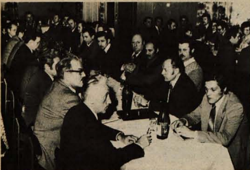
V četrtek, 12. februarja, je obiskal jeseniško občino predsednik predsedstva SR Slovenije Sergej Kraigher in se s predstavniki jeseniške Železarnice in s predstavniki občine pogovarjal o samoupravni organiziranosti v jeseniški Železarni.