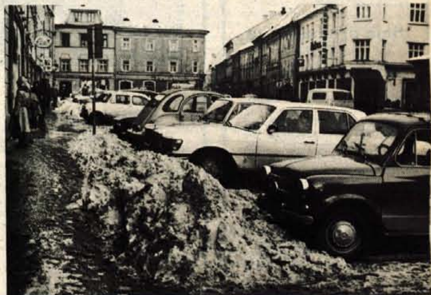
Burja ga je dala, jug ga bo vzel. (Posnetek je s Titovega trga v Kranju).

Za 8. marec z Glasom in Alpetourom v Benetke, Padovo, Gardo in Verono