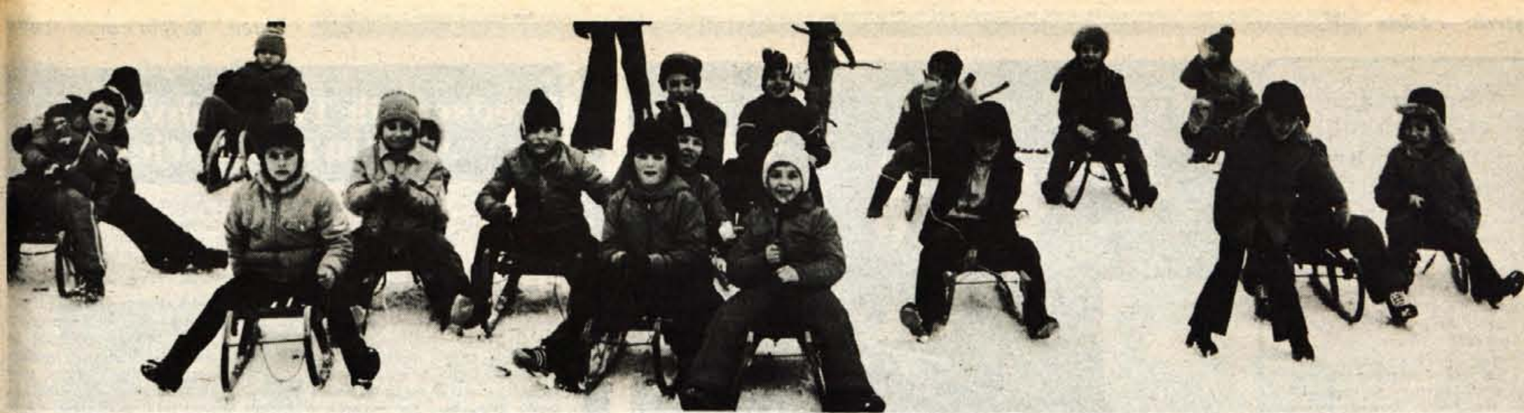
Knjige so še za tri dni romale v kot, otroci pa na sanke in na sneg.