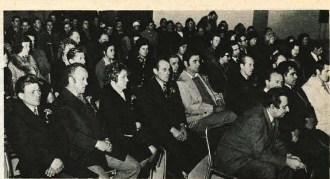
MURKA LESCE – Delavski svet tega trgovskega podjetja je v soboto sprejel srednjeročni razvojni program do 1980. leta