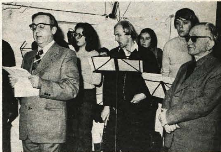
Ob obletnici smrti Antona Tomaža Linhart je kulturna skupnost Radovljica v soboto pripravila tradicionalno proslavo.