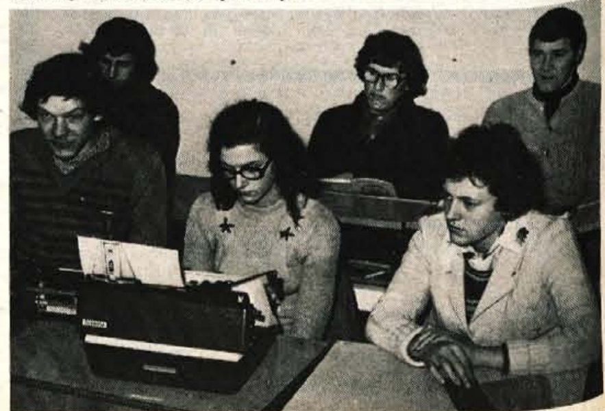
Učenci poklicne šole za administratorje in telefoniste v Centru za slepe in slabovidne v Škofji Loki se stikajo v pretnih prostorih

BLAGOVNICA Radovljica MODA Radovljica ELGO Lesce SAMOPOSTREŽBA Lesce SUPER MARKET UNION Jesenice murha