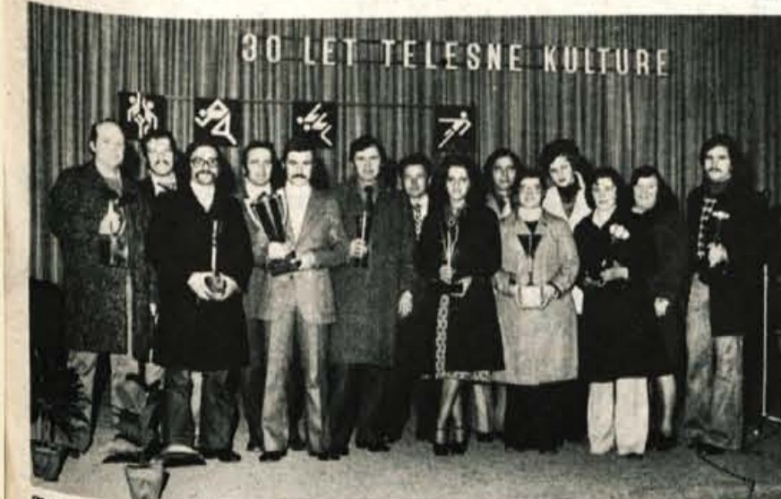
Telesno kulturna skupnost in občinski svet zveze sindikatov Radovljica sta v soboto pripravila v festivalni dvorani na Bledu prireditve z naslovom Večer s športniki. Na prireditvi so podelili priznanja najboljšim športnikom radovljiške občine za leto, športnim delavcem in organizatorjem za 30. in večletno delo in najboljšim ekipam osnovnih sindikalnih organizacij, ki so sodelovale na letošnjih sindikalnih športnih igrah v občini. – Letošnjih sindikalnih športnih iger, ki so potekale v smučanju, plavanju, namiznem tenisu, balinanju, šahu, kegljanju in avtorallyju, se je udeležilo 864 članov sindikata iz 66 osnovnih organizacij v občini. Glede na množičnost in kvaliteto je na letošnjih športnih igrah v vseh sedmih panogah zmagala skupina športnikov iz osnovne sindikalne organizacije Iskra Otoče (na sliki), druga je bila skupina športnikov iz osnovne sindikalne organizacije Elan Begunje, tretja pa skupina športnikov Verige Lesce. Sicer pa so pokale občinskega sveta zveze sindikatov dobile tri najboljše ekipe iz vsake športne panoge – Na prireditvi je o pomenu sindikalne rekreacije in njenem vplivu na delovne dosežke in uspešne obrambne priprave govoril predsednik občinskega sveta zveze sindikatov Radovljica Marjan Vrabec. V zabavnem programu pa je nastopil ansambel Peto kolo in pevec Janko Ropret. – A. Z.