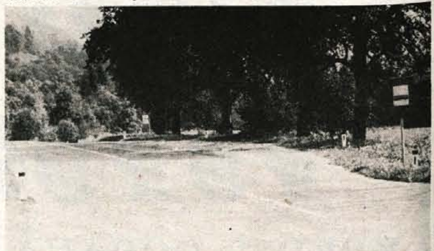
Autobusno postajališče Kamne pred Mojstrano povzroča prebivalcem tega naselja nemalo preglavic. Čeprav je postajališče registrirano, nekateri avtobusi medkrajevnega prometa nočejo ustavljati, češ da je to le lokalna postaja. Da bi prebivalci Kamna rešili ta neprijeten problem, do postajališča Dovje - Mojstrana je namreč precej daleč, so vsem avtobusnim podjetjem poslali prošnjo, da pristojni organi postajališče Kamne unesejo v vozni red, s čimer bo problem rešen, prebivalcem pa prihranjena jeza nad posameznimi soferji avtobusov, ki sešaj nemalokrat lepo po francosko peljejo mimo avtobusnega postajališča. (jr) - Foto: J. Rabič

možne rešitve. Izvršni svet je to problematiko obravnaval na svji 76. redni seji 9. 12. 1975 in sprejel predlagano varianto, po kateri bo župnijski urad v stavbi (Tavčarjeva 39), kjer že ima svoje prostore, z izselitvijo dveh strank, postopoma prišel do dodatnih poslovnih in stanovanjskih prostorov. I. S.