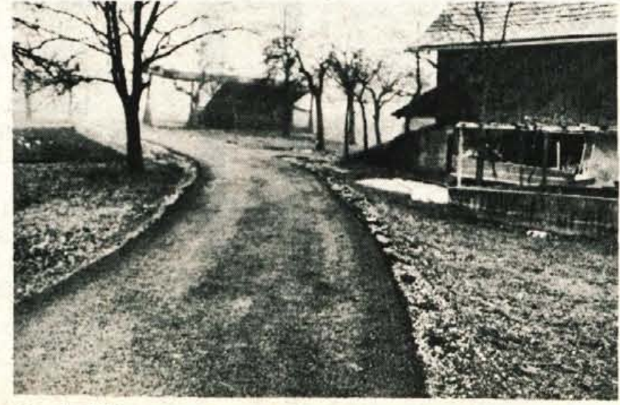
Skoraj tri kilometre je dolga preurejena cesta z asfaltno prevleko, ki povezuje vasi Vošče in Brda v krajevni skupnosti Lancovo.