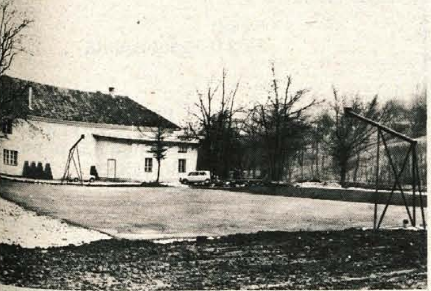
Za kulturnim domom v Podnartu zdaj gradijo tudi športno igrišče

Podnart — Sredi junija letos se je v krajevni skupnosti Podnart v radovljiški občini tri četrtine prebivalcev od 877 v osmih naseljih na referendumu odločilo za samoprispevek za ureditev nekaterih komunalnih problemov. V programu so se odločili, da bodo najprej uredili in asfaltirali 16 kilometrov cest. Obvezali so se, da bodo pri tem sodelovali s prostovoljnimi delom in da bodo krajevni samoprispevek plačevali pet let.