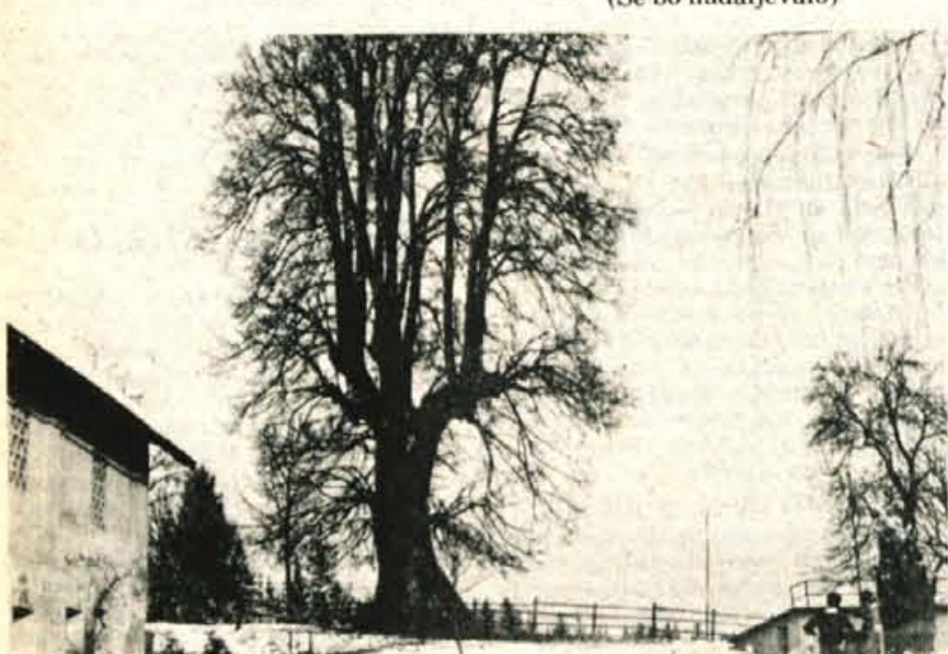
Dvanajsterovrha lipa pri Potočnikovih v Mokrijah