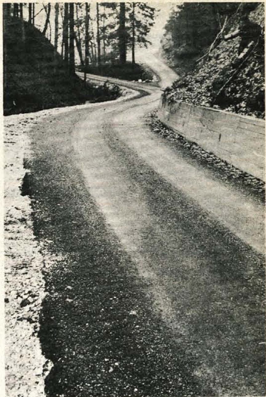
Za dan republike so v krajevni skupnosti odprli 16 kilometrov asfaltiranih cest

Po predračunu znaša vrednost opravljenih del blizu 3,40 milijona dinarjev. Od tega pa so prebivalci s prostovoljnimi zemeljskimi deli pritržili kar 880.000 dinarjev. Vsi občani so namreč delali po več dni skupaj. Ob takšni zavzetosti pa so jim potem prihitele na pomoč tudi nekatere delovne organizacije. Tako so se delavci v Kemični tovarni Podnart na referendumu odločili, da njihov