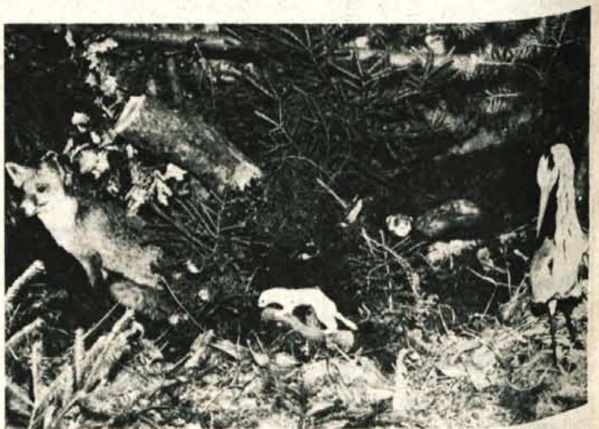
Lovska družina Sorško polje ima 39 članov, ki se ukvarjajo največ z gojenjem divjadi, saj porabijo za krmljenje fazanov kar 1600 kg koruze in za srujad 300 kg sena. Posebno skrb posvečajo čiščenju gozdov in krivolovstvu, kjer so bili dokaj uspešni. Njihovo lovišče obsega 3450 hektarov, toda ker ga preseka cesta I. reda, imajo precej povožene divjadi. Trudijo se, da bi ohranili jerebice, fazane, rance in zajce, ki izumirajo zaradi uporabe novih škropiv v kmetijski praksi. Ob dnevu republike so v Delavskem domu v Kranju pripravili razstavo lovskih trofej svojih članov.