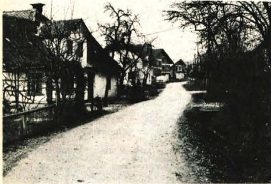
Tako slabih cest v Stražišču ni malo. Uspel referendum je zagotovilo, da jih kmalu ne bo več!