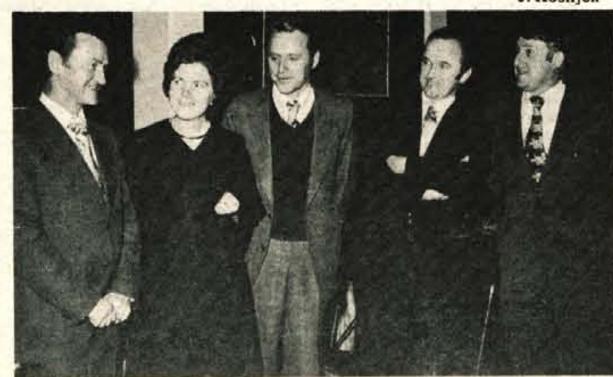
Pred dvajsetimi leti so maturirali na škofjeloški gimnaziji. In v petek so skupaj z letošnjimi maturanti ta jubilej proslavili.