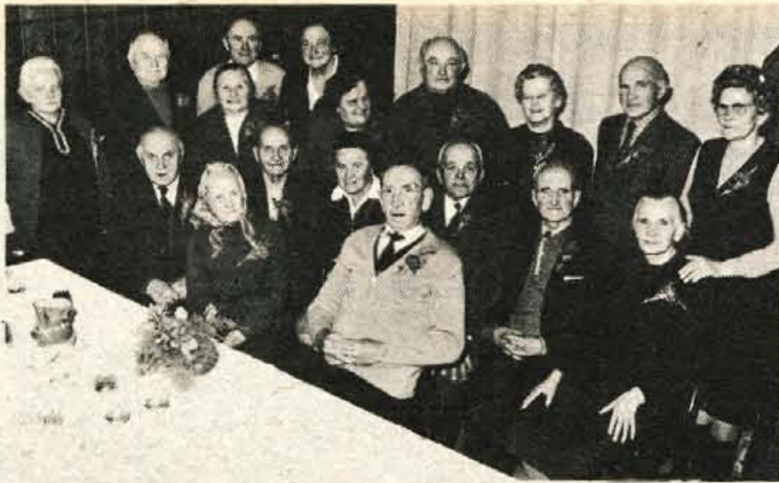
V sredo popoldne je odbor krajevnih organizacij ZB NOV Stražišče povabil na prijateljsko srečanje v gostilno Benedik člane ZB nekdanje aktiviste in borce stare nad 70 let. Podobno srečanje krajevna organizacija ZB privedi vsako leto in je tako kot prejšnja tudi letošnje potekalo v prijetnem vzdušju. Najstarejša udeleženca srečanja sta bila Jakeljčkova mama in Kladovcova, oba stara že 86 let. Ostale člane, ki se zaradi bolezni srečanja niso mogli udeležiti, pa bodo člani odbora obiskali na domu. — L. M. — Foto: F. Perdan

Rudarji, ki so odšli na delo v noči med 28. in 29. novembrom, so nakopali zadnje količine od skupaj 3.900.000 ton premoga, kolikor je znašal letni proizvodni načrt velenjskega rudnika. Plan so tako izpolnili mesec dni pred koncem leta. Računajo, da bodo letos, ko slavijo stoto obletnico obstoja rudnika, nakopali 4.250.000 ton premoga. Največ so ga nakopali oktobra, in sicer 419.000 ton, dnevna proizvodnja pa je bila največja 25. novembra, ko so izkopali 18.100 ton premoga.