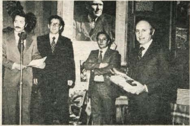
Pozdrave in darila organizacijam mesta Rivoli so izročili tudi predstavniki organizacij kranjske občine. Med drugim so takšna priznanja podelili predstavniki zveze združenj borcev NOV Kranj, Planinskega društva in Ribiške družine Kranj (na slikah)