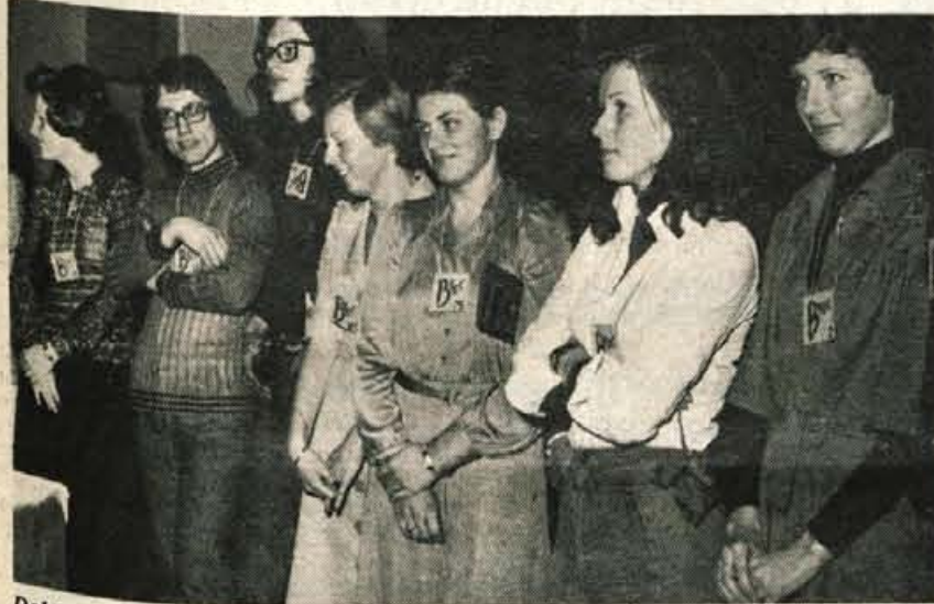
Dobra dekleta, mislimo »bruce«, kajne? Priznajte!