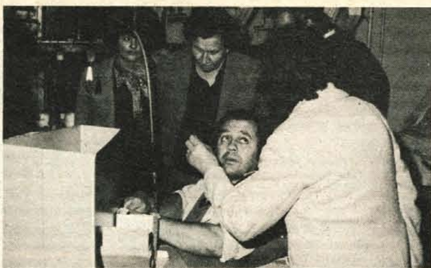
Predstavniki društva invalidov Kranj na obisku v invalidski delavnici zavoda v Ponikvah.