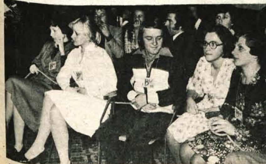
Kakšna bo odločitev sodišča? Očitno so bolj v skrbeh »bruce«.