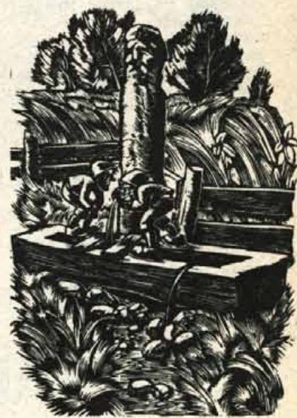
Koroški vodnjak — Ob cestah na severnem pobočju Karavank srečavamo zanimive lesene vodnjake. Lepota združena s koristnim.