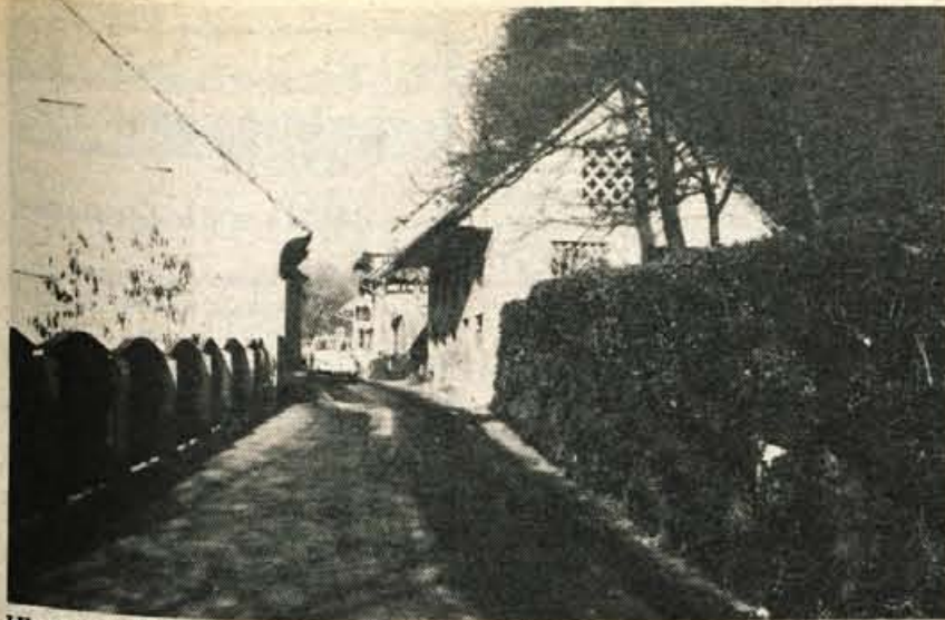
Vhod v ozki prehod skozi Novi trg.