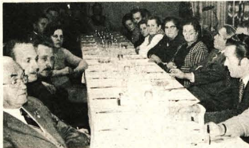
Na izrednem občnem zboru so se na Jesenicah sestali invalidi, člani društva invalidov v občini, pregledali svoje dosedanje delo in naloge v prihodnje. Nekaterim najbolj prizadevnim članom so podelili priznanja za njihovo aktivno delo v društvu.

Pri uresničevanju delegatskega sistema in pri stalnem izpolnjevanju njegovega delovanja, na tem pa bazira ves naš sistem najdemokratskejšega samoupravnega sprejemanja sklepov in odločitev, pa morajo družbenopolitične organizacije, posebno pa ZKJ, uveljaviti vso svojo avtoriteto, da se povsod in v celoti izpolnjujejo določila nove ustave! Sami smo ustvarjalci naše lastne bodočnosti; to pa je obenem pravica, dolžnost in odgovornost! I. S.