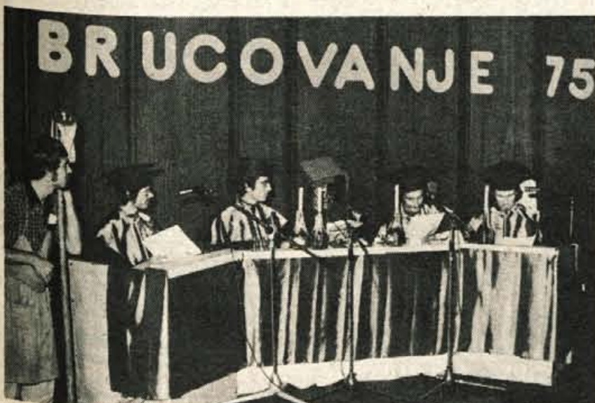
Brucovanje '75 v Skofji Loki. Sodišče v polni zasedbi. Zraven pa seveda vrtnar.