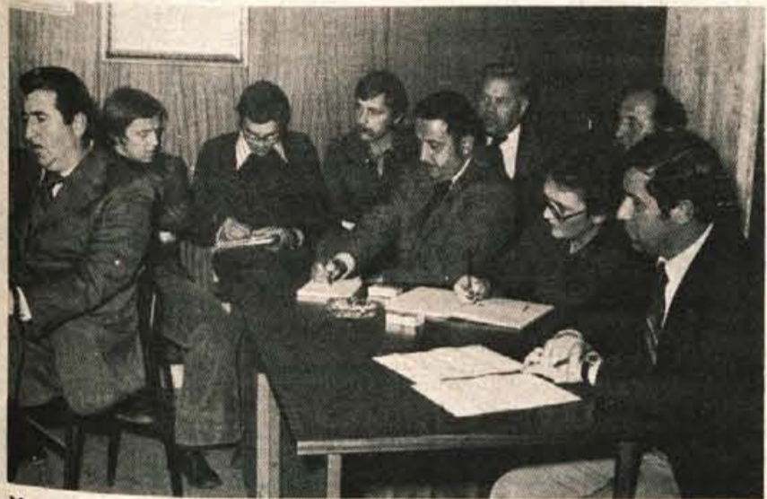
Na sestanek za okroglo mizo je prišlo skoraj 50 odstotkov več udeležencev kot smo jih povabili.