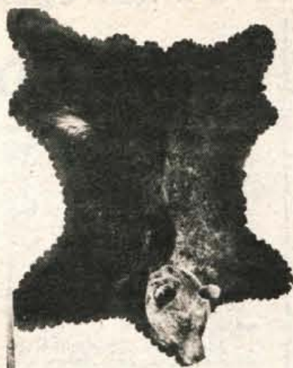
Trofeja medveda, ki so ga zadnjega ustrelili na Jezerskem, je sedaj prijetna popestritev lovske sobe Hotela Kazina na Jezerskem

Jezerjani so se v primeru zadnjega obiska medveda držali predpisov. Kranjsko občinsko skupščino so prosili za odstrel medveda v nelovni dobi. Ker je potrebno še dovoljenje republiškega sekretariata za kmetijstvo in gozdarstvo, se je stvar zavlekla. Do 1. oktobra soglasja še ni bilo. Medveda sta odšla, ker so ovce kmetje umaknili. Lovcem torej naknadna vključitev odstrela medveda v gospodarski plan praktično nič ne pomeni, ker je vprašljiva njuna vrnitev. Enako pa za zdaj lahko trdimo tudi za izplačilo odškodnine prizadetim kmetom. Ni majhna. Eden od njih je ostal brez 20 živali. Škoda je