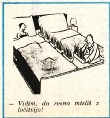
— Vidim, da resno misliš z ločitvijo!