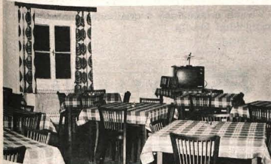
Preurejena jedilnica med obroki sicer sameva, vendar pa bo v njej, ko bo do kraja urejena, še čajna kuhinja in ko bo tu še barvni TV sprejemnik, darilo občinskega sindikalnega sveta Kranj, verjetno veliko bolj živahno ob vsaki uri dneva.