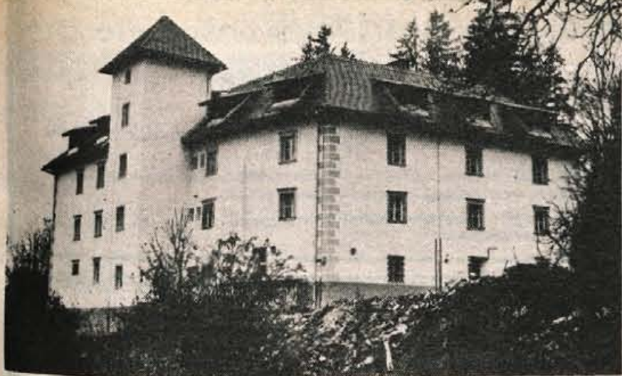
Nekdanji grad Turn po obnovi zdaj že na zunaj kaže, da je postalo bivanje oskrbovancev v njem boljše in prijetnejše.