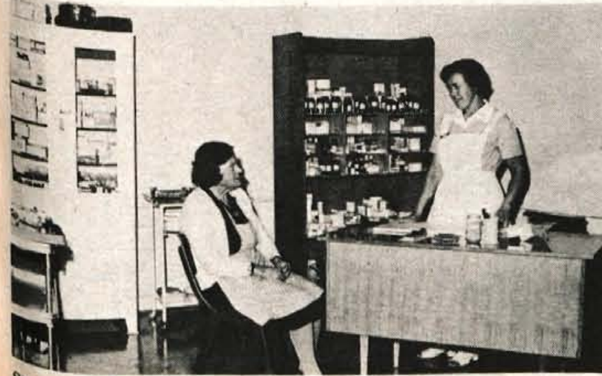
Starost s svojimi tegobami zahteva, da je zdravniška pomoč zelo blizu. Dom oskrbovancev Albina Drolca v Predvoru ima svojo ambulanto, v kateri dvakrat na teden ordinira zdravnik.