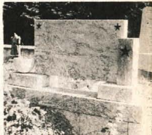
Partizanski nagrobnik v Mavčičah

Gorečnik judovskih postav in vnet prietaš farizejcem je Savel iz dna srca žetil in