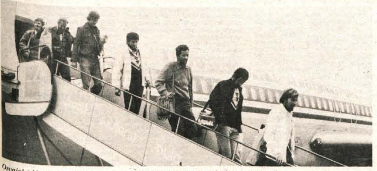
Osvajalci Makaluja prihajajo iz aviona. Več o povratku alpinistov berite na 16. strani!