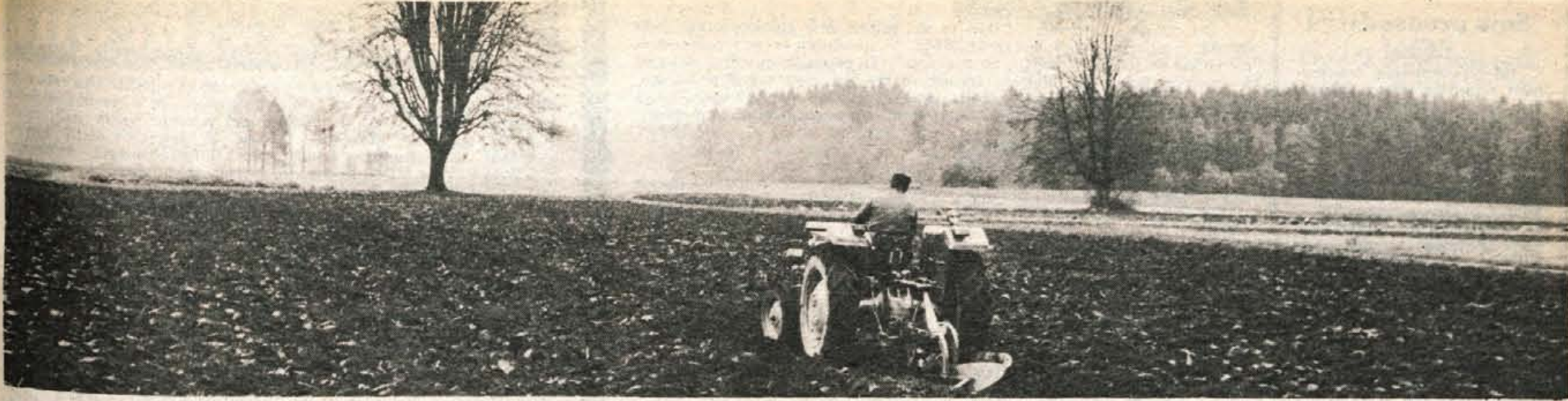
Zemlja je letos s sorazmerno dobro letino poplačala kmetovo delo. Zato ji preorani privoščimo nekaj mesecev počitka

Leto XXVIII. Številka 87 Ustanovitelji: občinske konference SZDL Jesenice, Kranj, Radovljica, Škofja Loka in Trzin — Izdaja CP Glas Kranj. Glavni urednik Igor Slavec — Odgovorni ured- nik Albin Učakar