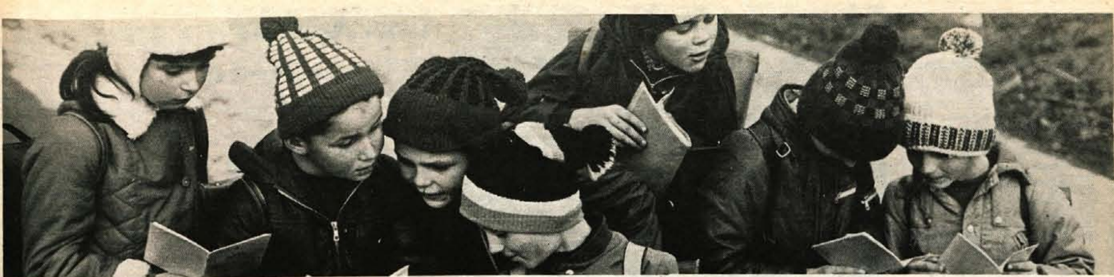
Dvojka ali petica v polletnem spričevalu? Kar že je, glavno, da so počitnice tu, pa čeprav so brez snega.