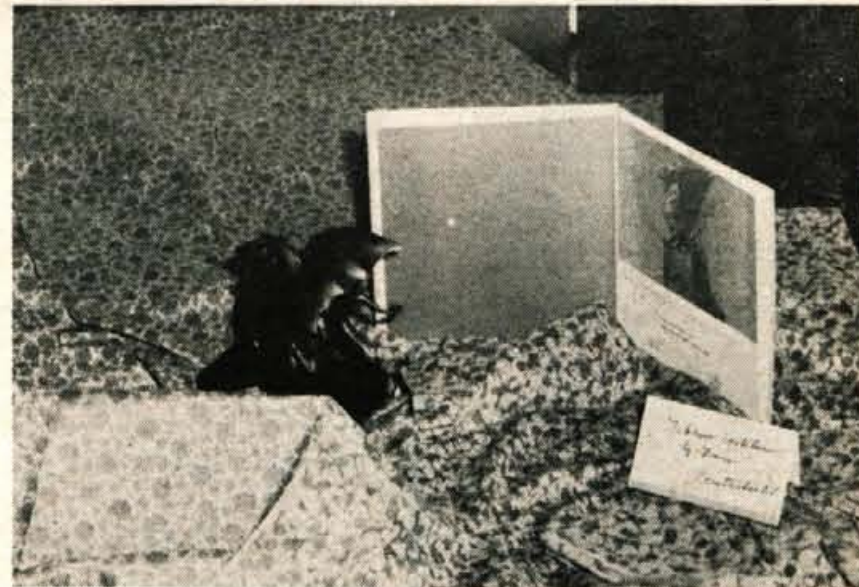
Ljubljanski zmaj za artikel CAPOLO in ...

»Da, zagotovo. Od nagrajene grupe CAPOLO je že nekaj artiklov povsem razprodanih. Tisti povojni čas, ko smo dejansko delali za sejme, za široke ljudske množice pa nič, je mimo. Danes je pa tako: izogibati se moramo