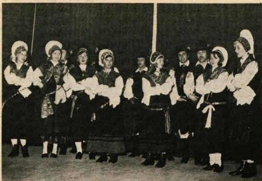
Nazadnje je nastopila še gorjanska folklorna skupina