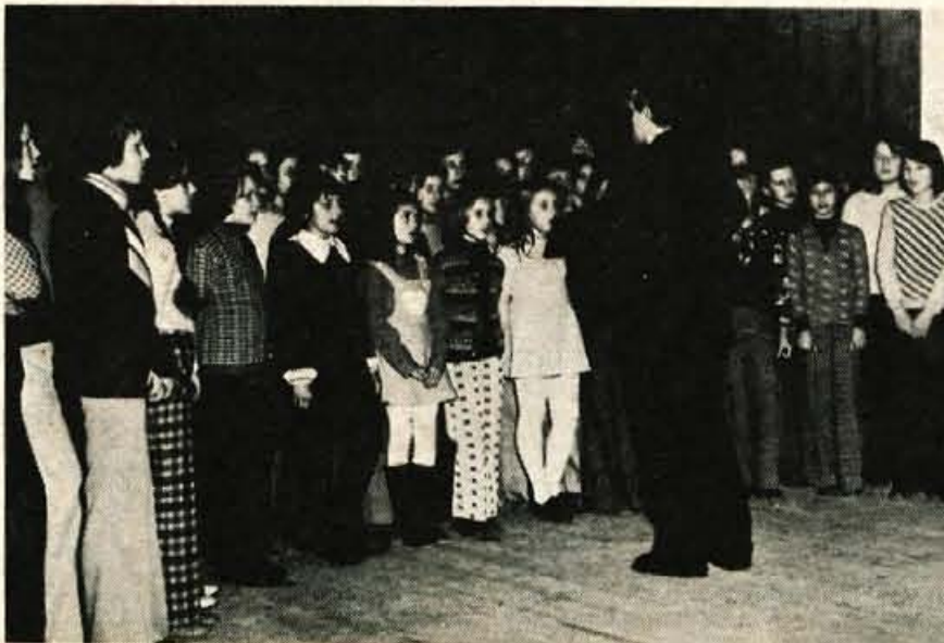
Prijeten večer je popestril tudi pevski zbor osnovne šole