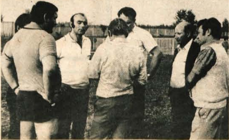
Najprizadenejši člani uprave Korotana se zberejo skoraj na vsakem treningu nogometašev