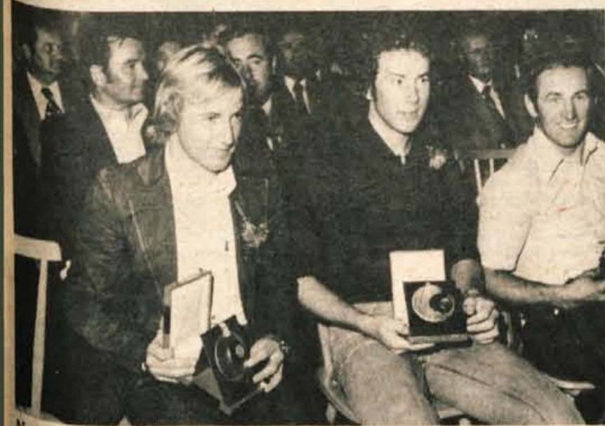
Najzaslužnejšim smučarjem pa so podelili posebne plakete. Na sliki: Jugoslovčan Bojan Križaj in Sved Ingemar Stenmark