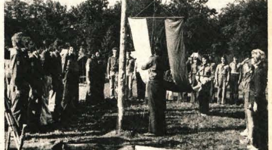
V soboto in v nedeljo so taborniki odreda Stražnih ognjev postavili pred osnovno šolo Staneta Zagarja na Planini propagandni tabor z namenom, da obiskovalcem prikažejo dejavnost taborniške organizacije.

Nekaj po 12. uri so program svečano sklenili, pogasili partizanski ožen sredi tabora in se za eno leto poslovili. L. B.