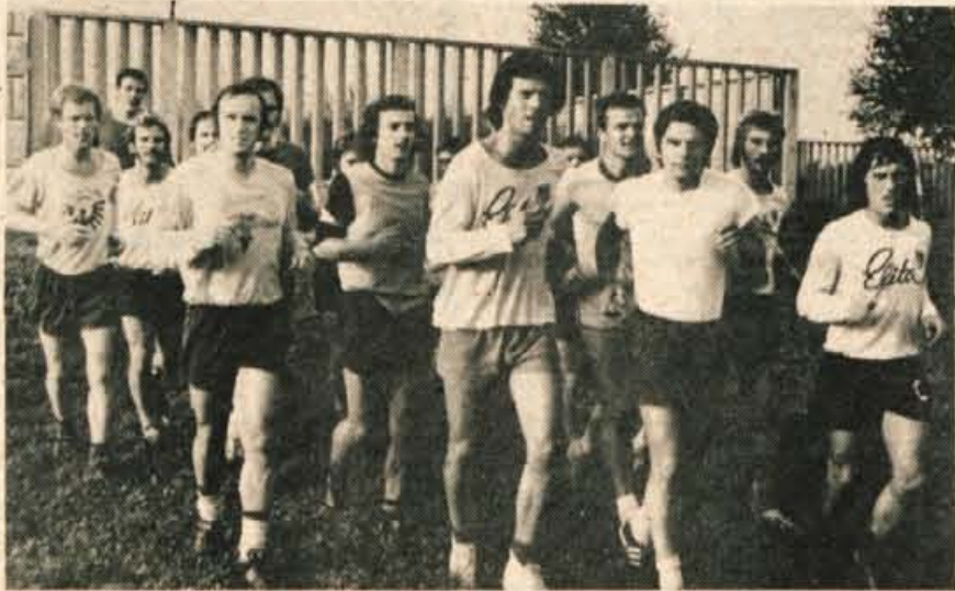
Zaradi pogostih tekem in zasedenosti obeh igrišč stadiona Stanka Mlakarja se morajo nogometaši Korotana večkrat preseliti in vaditi zunaj stadionske ograde