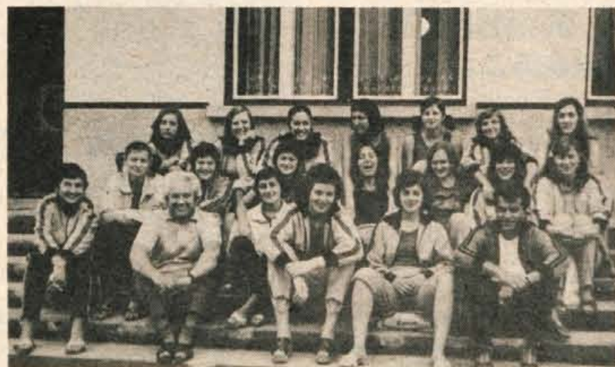
Škofja Loka z okolico je po vsemu sodeč zadnja leta postala pravi raj za športnike. Tja ob koncu poletja prihaja vse več športnih kolektivov na priprave za novo prvenstveno sezono. Se posebno pogosti gostje so rokometarji in košarkarji. Ti imajo tudi dokaj dobre možnosti za delo, saj so jim na razpolago ustrezni športni objekti. Te dni so bile na pripravah v Trebiji v Poljanski dolini košarkarice Topolčanke iz Bačke Topole, ki tekmujejo v I. zvezi košarkarski ligi. Dekleta in vodstvo kluba, prav vsi so bili zadovoljni s potekom priprav. Se posebno jih je navduševalo mirno in čisto okolje. Poleg tega pa je ekipa imela najprej na voljo igrišče v Škofji Loki, nato pa v bližnji Gorenji vasi. (jg)

Pred nedavnim so balinarji s Trate pripravili tudi balinarski turnir za prehodni pokal kluba. Udeležili so se ga člani BK Trate, BK »Loka 1000«, BŠD Žiri ter izven konkurence dve domači mladinski ekipi. To je bil mladim tudi prvi javni nastop. Prehodni pokal so osvojili domačini. Mlada ekipa s Trate, njeni člani so tekmovali izven konkurence, pa so premagali vse ostale ekipe. V skupini najmlajših balinarjev so nastopili Jure Stancar, Adi, Ferko, Bojan Berčič ter Drago Stremfelj. Fantom, ki so stari šele petnajst ali šestnajst let, je to prav gotovo velika spodbuda za delo v prihodnje. J. Govekar