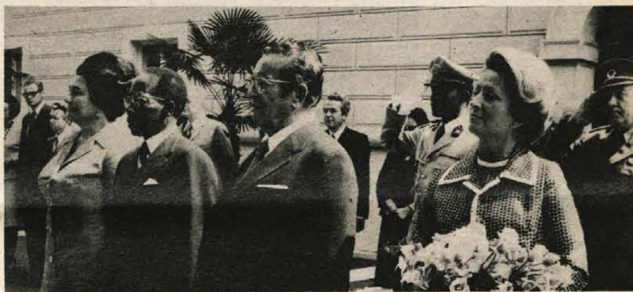
Predsednika republike Senegala Leopolda Sedarja Senghorja in ženo je v soboto na Brdu sprejel predsednik Tito z ženo Jovanko.