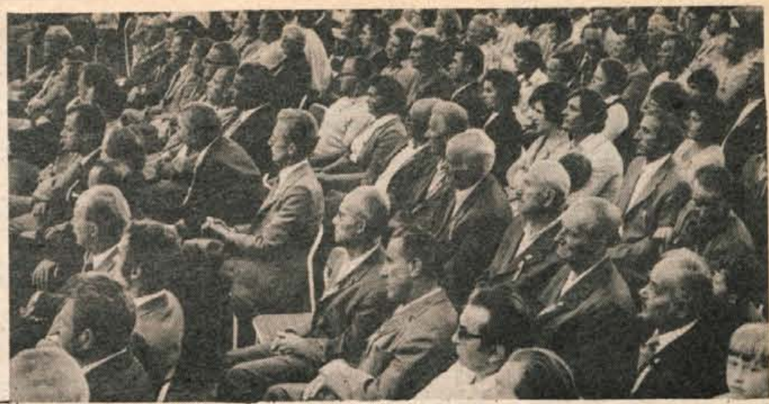
Pogled na oder z nastopajočimi in v halo nove hladne valjarne, kjer se je zbralo več kot 4000 ljudi, pričata o veličastnosti sobotnega slavlja na Jesenicah.