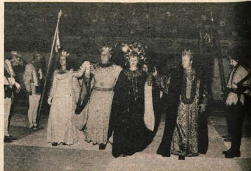
Partija »živega šaha« se lahko prične! Na šahovnico prihajata kraljevska para ...

Kaj je pravzaprav »živi šah«? Na Jesenicah so bila šahovska polja vsana na betonski areni hokejskega igrišča. Igralne figure niso bile lese-