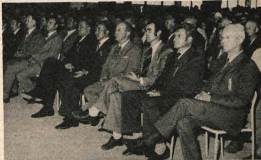
Vabilu jeseniških železarjev na sobotno proslavo so se odzvali številni predstavniki družbenopolitičnega in gospodarskega življenja

Slavnostni govornik, predsednik CK ZKS Francé Popit, je uvidoma orisal revolucionarno zorenje jeseniškega delavstva in njegov velik prispevek k predvojnemu stavkovnemu in naprednemu delavskemu gibanju in narodnoosvobodilnemu boju. Poudaril je velike zasluge Jesenic pri povojni graditvi socialistične Jugoslavije, saj je na primer jeseniška Železarna že leta 1947 proizvedla 9000 ton surovega jekla ali 60 odstotkov vseh jugoslovanskih potreb. Po uvedbi delavskega samoupravljanja leta 1950 (Železarna je tretja v državi stopila na to pot!) pa je proizvodnja še skokoviteje narasčala. Govornik je ocenil tudi