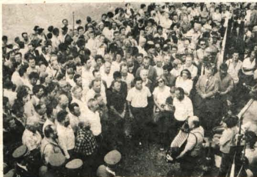
V kulturnem programu je sodeloval partizanski invalidski pevski zbor iz Trsta.