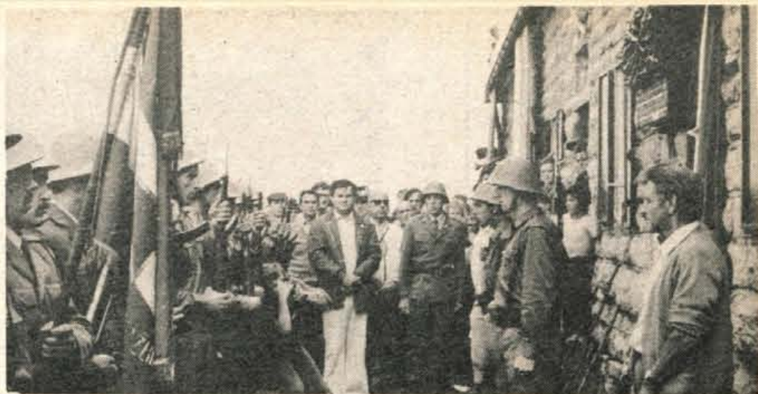
Nedeljsko slavlje na Poreznu ob odkritju spominskega obeležja v spomin legendarnega boja borcev Kosovelove brigade in Gorenjskega vojnega področja.