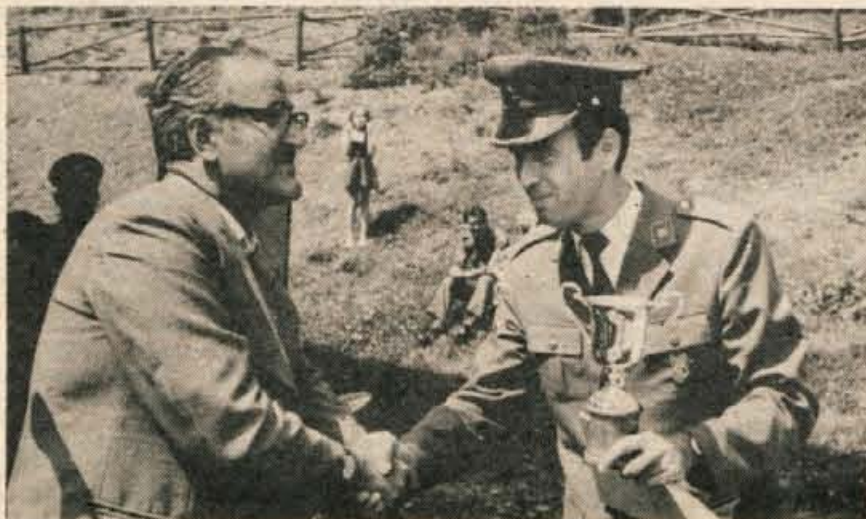
Na proslavi so podelili pokale prvouvrščenim na nedavnem športnem srečanju v Podmežakli na Jesenicah ...