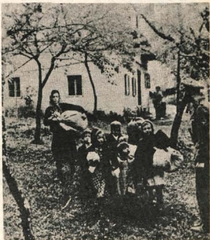
Dne 8. avgusta 1942 je nemška soldateska izselila iz vasi Korene (Wurzen), obč. Kostanje, zavedno slovensko Streharjevo družino. — Slika je gotovo eden od najpretrpljivejših dokumentov o trpljenju naših koroških rojakov, hkrati pa dokaz nemških »skulturnih« metod...