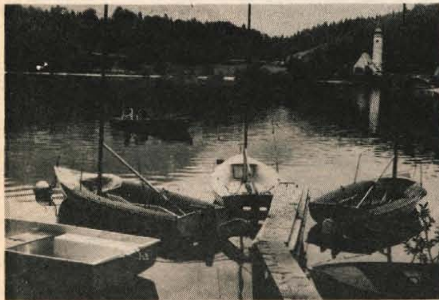
Čolnarjenje in ribolov — usakdanje razvedrilo turistov