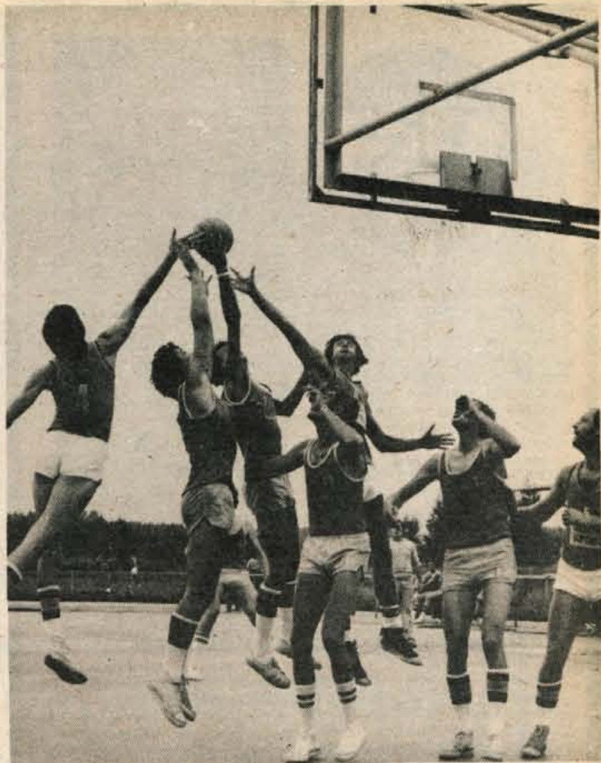
Košarkarski klub Triglav Kranj je organiziral v počastitev občinskega praznika Kranja kvalitetni košarkarski turnir, na katerem so sodelovale ekipe Olimpije, Slovana, Velenja in domačega Triglava. Turnir je bil v soboto in v nedeljo na stadionu Stanka Mlakarja. Na fotografiji trenutek s tekme Triglav : Velenje, ki so jo dobili domačini z 69:65. (j.k.)

Olimpija: Lorbek 16 (4:2), Sibolič 21 (2:1), Vujačić 6 (2:2), Ivanović 31 (16:13), Križnar 10, Jakhel 13 (2:1). D. Humer