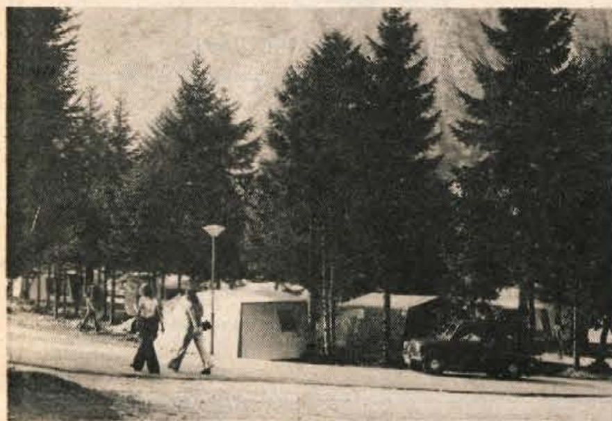
Kamp, ki sprejme okrog 700 gostov, je bil julija in do srede avgusta poln