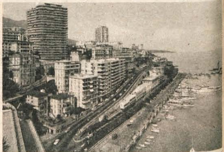
Kneževina Monako — Monte Karlo, pristanišče in del krožne ceste, na kateri potekajo dirke za veliko avtomobilsko nagrado.

Kot vse obiskovalce in turiste, ki brez slehernih mejnih formalnosti pridejo v Monaco, je tudi nas pot najprej vodila h knežjemu dvoru. Mogočna oker rumena palača z belo-rdečimi polknicami na visokih oknih stoji vrhu skalnatega hriba na majhnem polotoku. Obdana je z obzidjem in lepimi parki. Razen dvora je vrhu hriba stari strnjeni del mesta Monaco s katedralo in veličastno marmornato palačo oceanografske-