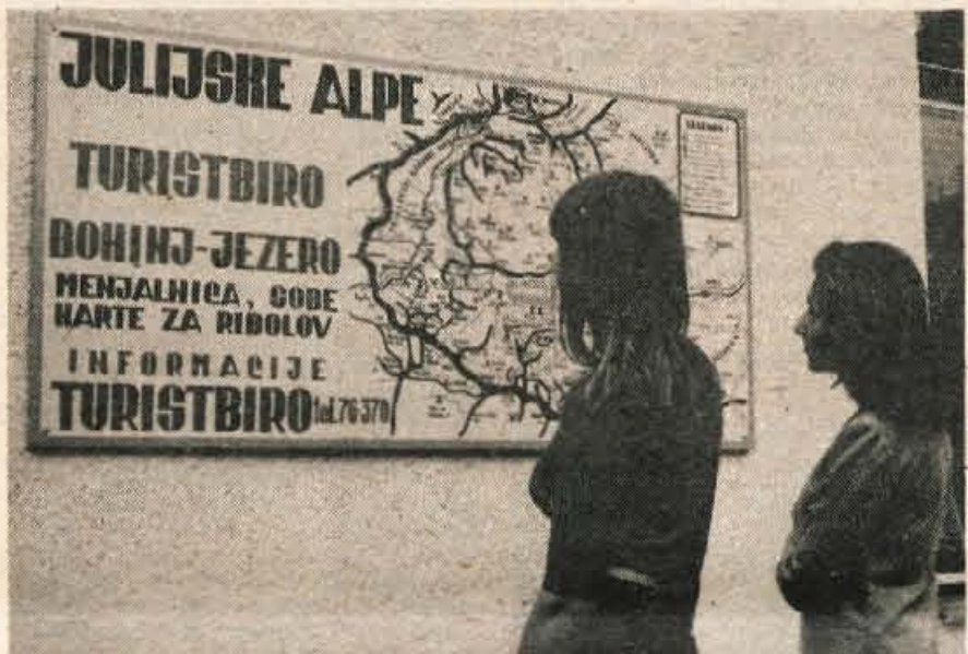
Za izletnike so namestili štiri nove reliefne table

nimivost za turiste je bila tudi proslava 50-letnice gasilskega društva Polje in potem so še tradicionalni pikniki vsak petek, pa nastopi domačih in tujih ansamblov ter folklornih skupin.