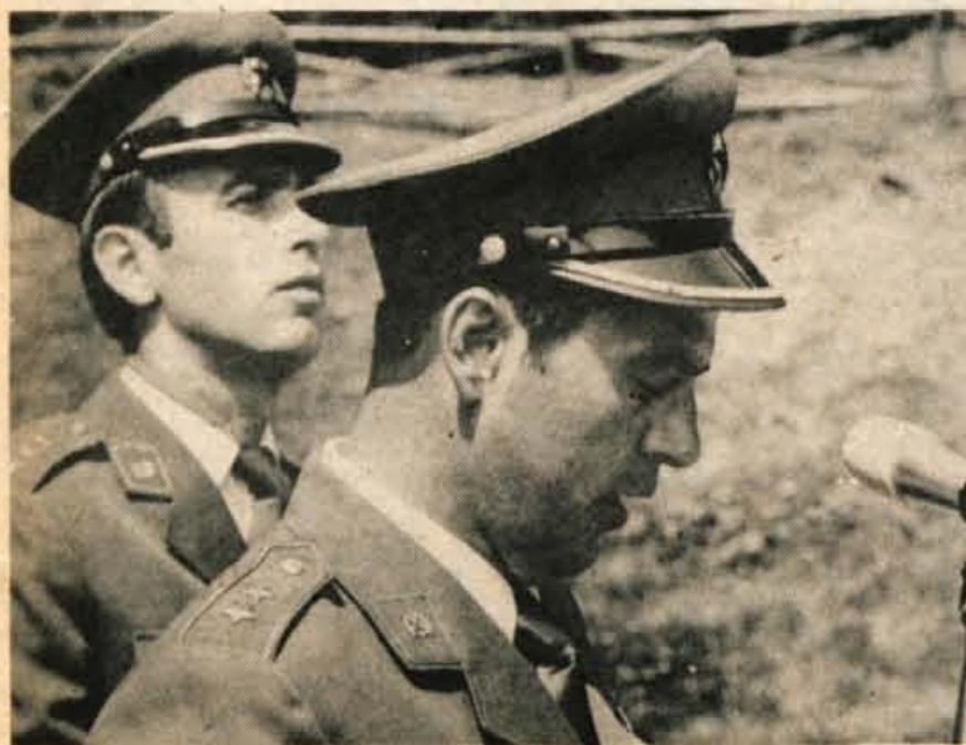
Na osrednji gorenjski proslavi so številne goste in graničarje tudi iz sosednjih karavil pozdravili z najpristržnejšimi čestitkami za njihov praznik ...

LIP BLED lesna industrija Ljubljanska c. 32 tel 064 77 384