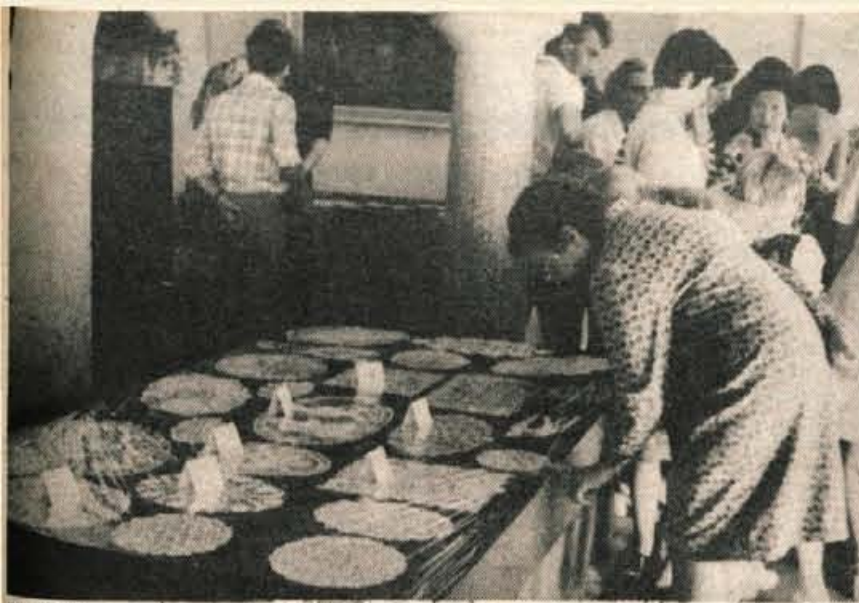
Turistično društvo Železniki je v nedeljo v Železnikih v Selški dolini že trinajstič zapored pripravilo tradicionalni čipkarski dan. Že v zgodnjih jutranjih urah so v prostorih muzeja odprli razstavo čipk. Obiskovalci so imeli možnost, da razstavljene čipke tudi kupijo. Nato so se med seboj pomerile klekljarice iz turističnih društev škofjeloške občine. Udeležence čipkarskega praznika je dopoldne zabaval ansambel »Mladci«, popoldne pa so se obiskovalci zavrteli ob zvokih Fantov Selške doline. (jg)