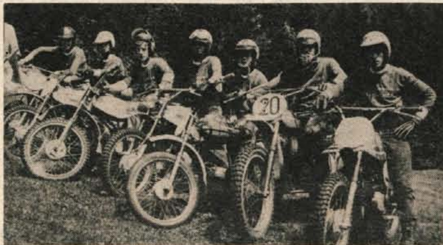
Člani AMD Radovljica so pod karavlo nad Ratečami prikazali ta lep in zanimiv šport vsem udeležencem proslave ...