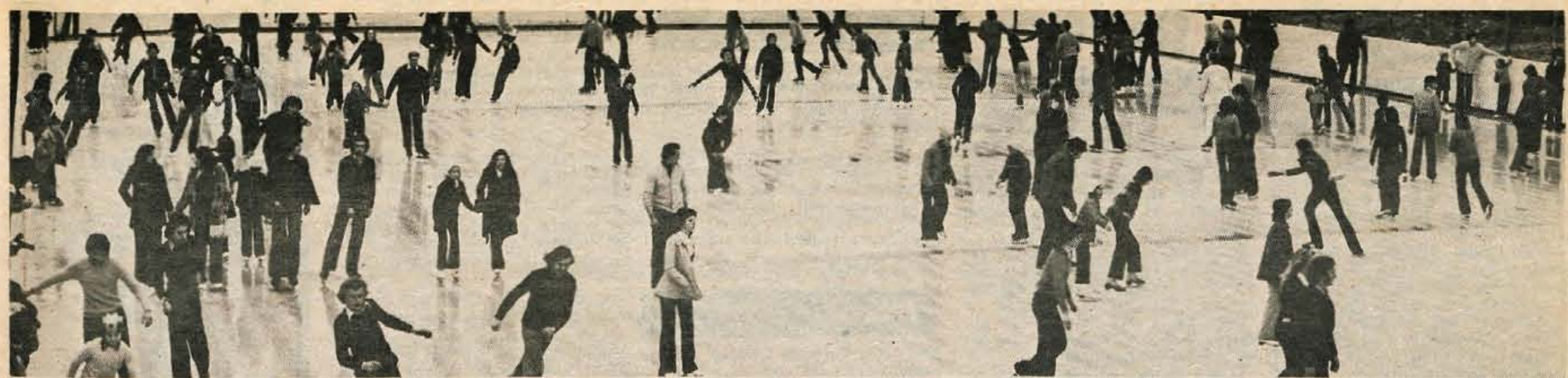
V petek smo s tihim upanjem, da se bo začela prava zima, objavili sliko in vest, da je blejsko jezero začelo zmrzovati. No z ledom kot kaže ne bo nič. Edina zimska rekreacija na Bledu je ta hij umetno drsališče. V petek so se na Bledu sestali tudi člani interesne skupnosti za izgradnjo rekreacijske in turistične infrastrukture Bleda. Razpravljali so o nadaljnji gradnji drsališča