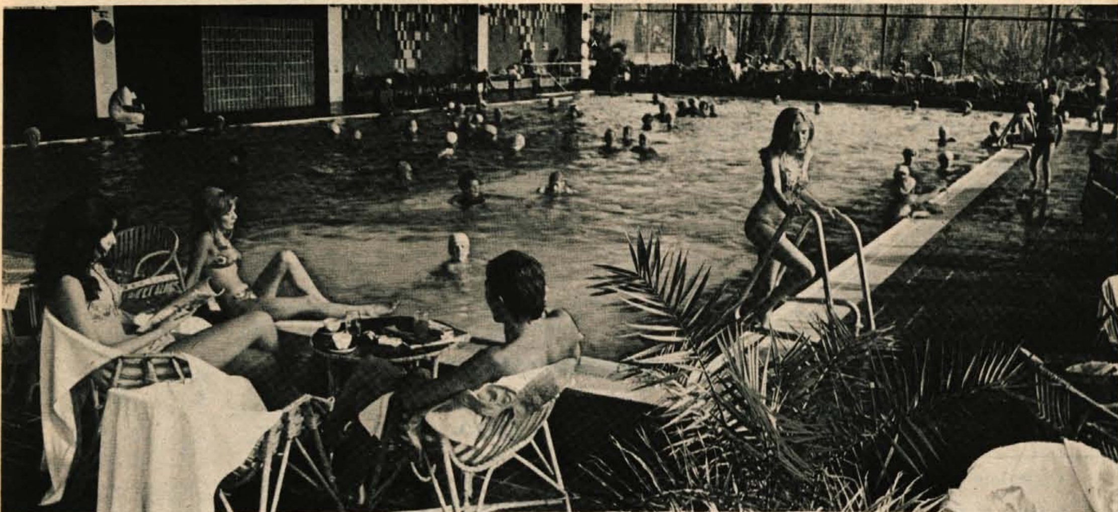
Pokriti bazen v portoroškem hotelu Palace