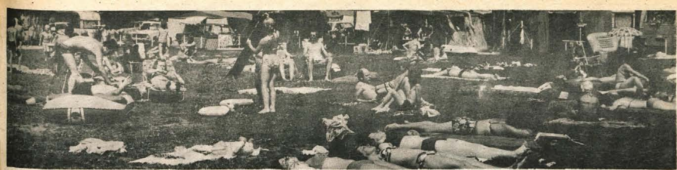
Cepprav muhasto vreme s prepogostimi hladnimi nevihtami ni najbolj naklonjeno kopalcem in iz letnikom in lahko upamo, da bo pravo vroče poletje še prišlo, je v kampu Sobec zelo živahno