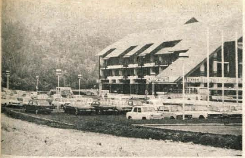
V teh dneh je Kranjska gora polna do zadnjega kottička. Številni dopustniki so se odločili, da preživijo letni oddih prav v Kranjski gori, saj je prav tako kot v zimskih, privlačna tudi v poletnih mesecih. Kot izhodiščna točka nudi dovolj možnosti za izlete na Vrščic, na Vitranc, do kopaljšča v Jasni in drugam. V Kranjski gori preživijo poletne dni največ Nemcev in Nizozemcev, med domačimi gosti pa največ Hrvatov in Srbov, ki se že leta in leta odločajo za Kranjsko goro ali okoliške kraje. Na sliki: prepoln Kompasov hotel.