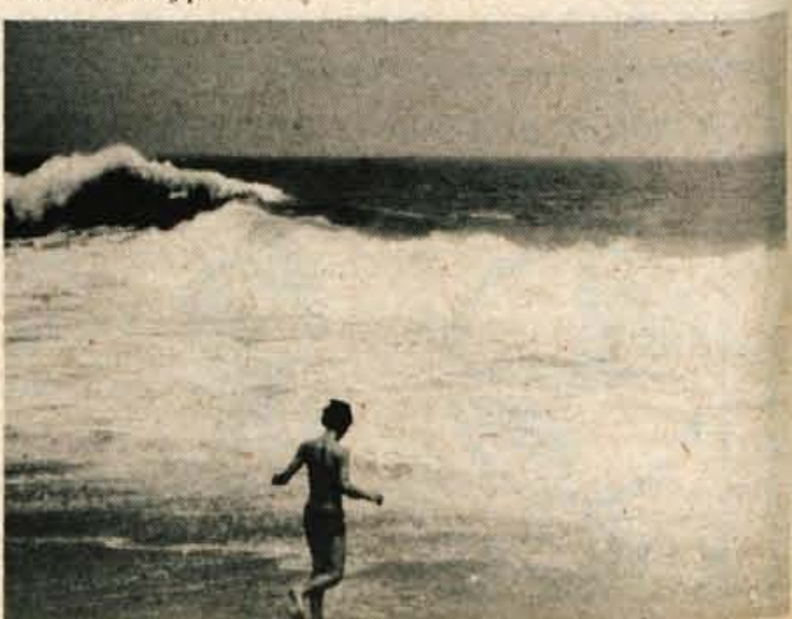
Večni valovi ob tihomorski obali