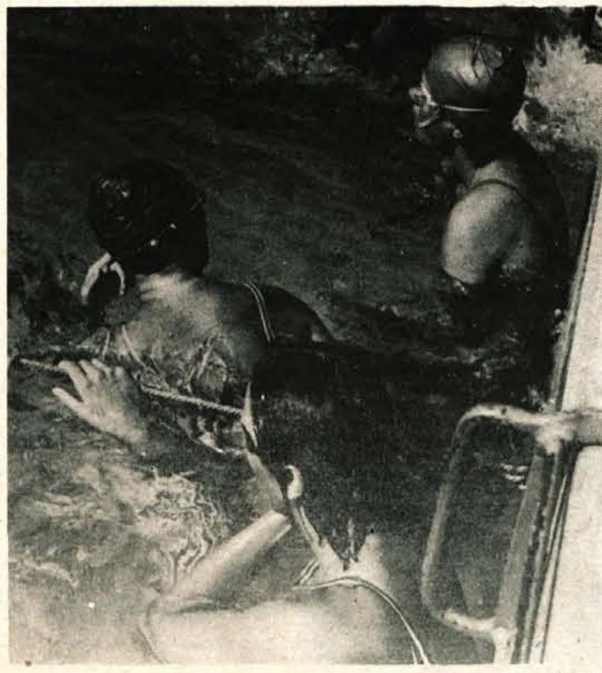
Kranjski plavalci se intenzivno pripravljajo za nastop na letošnji svetovni prireditvi v Preddvoru.