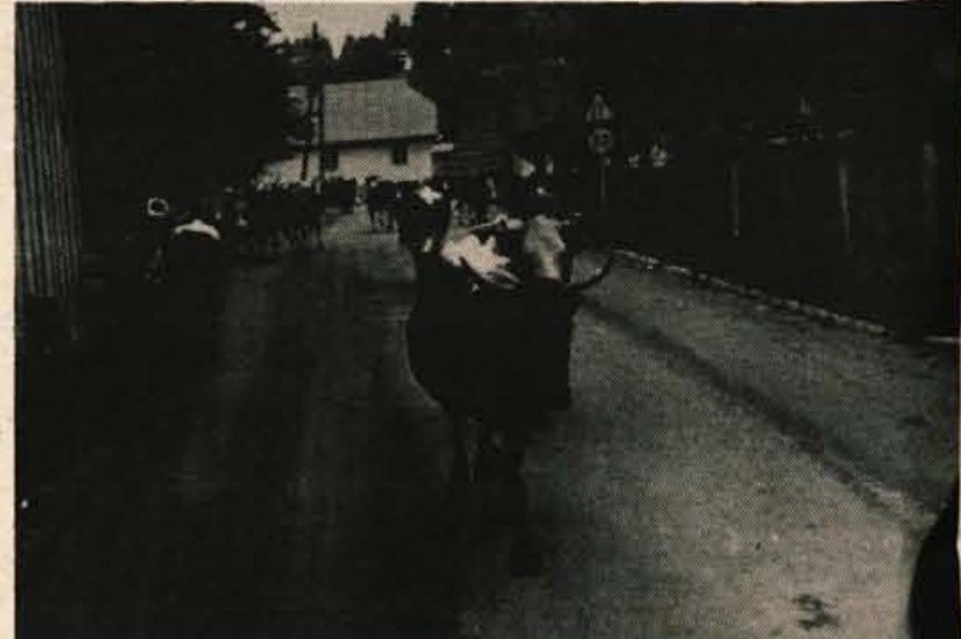
V poletnih mesecih vsako jutro domačini iz Rateč pri Planici ženejo na pašo na bližnji pašnik Rute v Italiji okoli sto glav živine. Čredo spremljata dva pastirja. Ker je v Ratečah ozko čestno grlo, se morajo številni turisti, ki tod prestopajo mejo, umakniti čredi, kar za marsikatero pomeni zanimivost. Ratečani imajo lepe pašnike tudi v planini pri Belopeških jezerih pod Mangartom v Italiji, kjer se pase živina vse poletje.

V soboto, 12. julija, ob 1.30 uri zjutraj je strela udarila v dimnik stanovanjske hiše Miha Polaka iz Kranja. Zgorelo je ostrešje stanovanjske hiše, poškodovana pa je tudi notranja oprema. Škode je za približno 80.000 din.