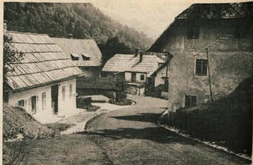
V Podlublju v trziški občini so delavci Cestnega podjetja iz Kranja pred dnevi položili zadnje metre asfaltne prevleke na krajevnih cestah. Krajanje so prispevali približno polovico vseh sredstev, polovico pa jih je doteklo iz negospodarskih investicij. Po predračunu naj bi vsa dela veljala okrog 360.000 din, vendar so v letu dni stroški narasli za skoraj 100.000 din. Z akcijo asfaltiranja krajevnih cest so prebivalci Podlublja začeli že v začetku lanskega leta. (jg)