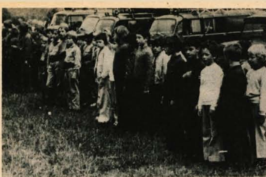
Na Produ v Mojstrani je bilo prejšnji teden občinsko tekmovanje pionirjev-gasilcev Prostovoljnih gasilskih društev jeseniške občine. V prvi skupini so zmagali pionirji iz Smokuča, v drugi pa pionirji iz Zabreznice. Prvouvrščena ekipa iz Zabreznice si je pridobila pravico udeležbe na republiškem tekmovanju, ki bo jeseni v Žalcu.