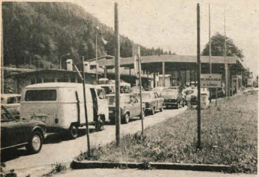
Mejni prehod na Korenskem sedlu je eden izmed najbolj prometnih, saj običajno v teh dneh prihajajo vozila kar v štirih vstopnih kolonah.