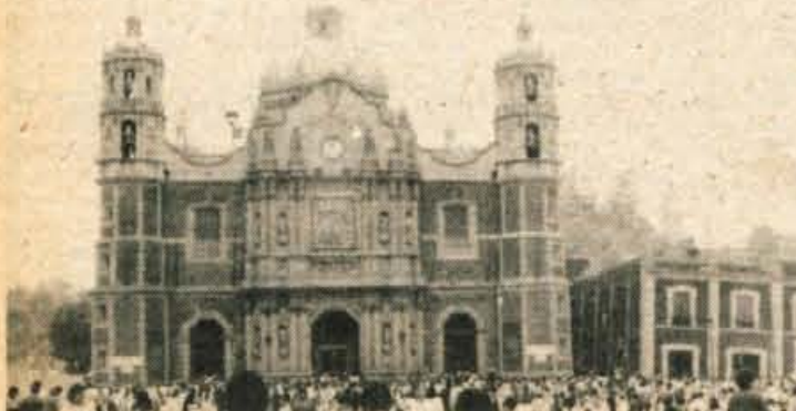
Bazilika Guadalupe, božja pot vseh Indijancev v Mehiki