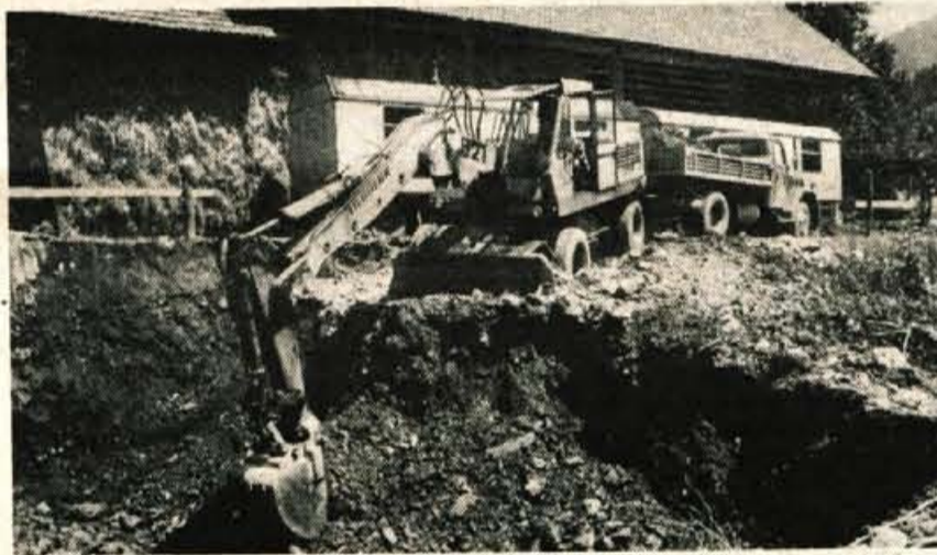
Pred tedni so začeli z izkopom zemlje v Železnikih, na parceli, kjer naj bi do konca novembra letos zrasel pokrit plavalni bazen.

Organizator razstave, Turistično društvo Cerklje že sedaj načrtuje jubilejno 10. razstavo cvetja in lovstva, ki bo prihodnje leto v istem času in prav tako v vseh prostorih osnovne šole.