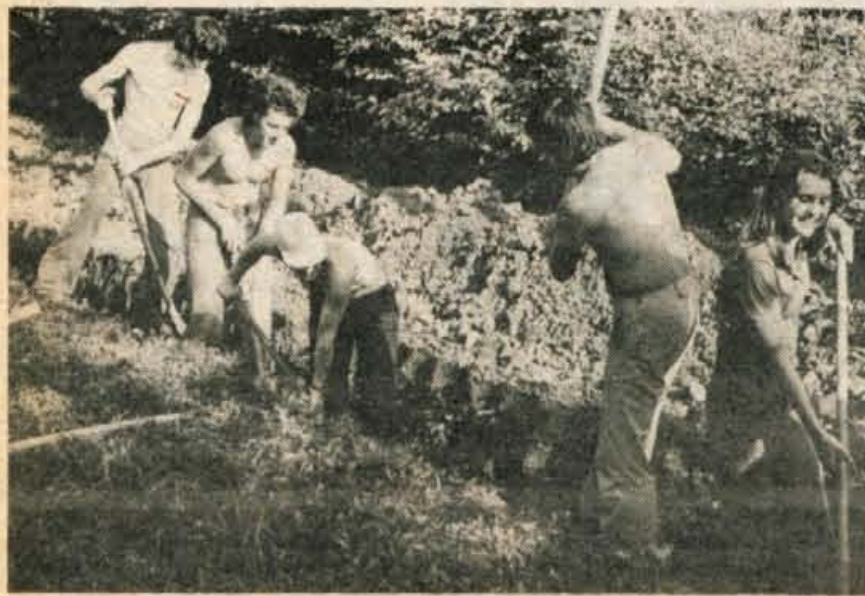
Brigadirji kopljejo jarek za vodovod čez Ptujsko goro