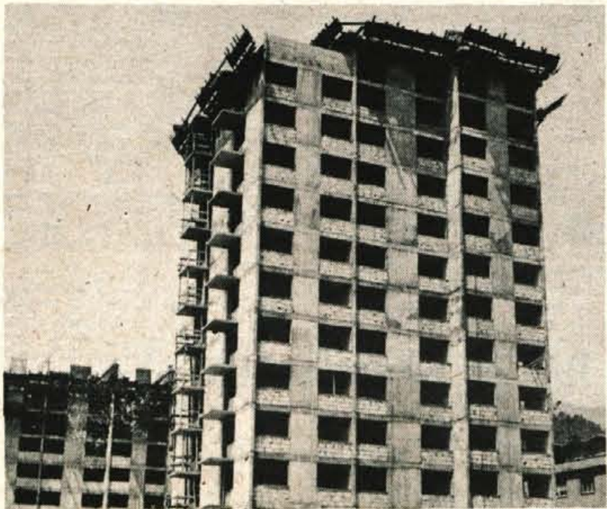
Novi stolpnici ob Koroški progi na Jesenicah gradbeno podjetje Sava z Jesenic. Stanovanja v njih bodo odkupile delovne organizacije ter občinski solidarnostni sklad.