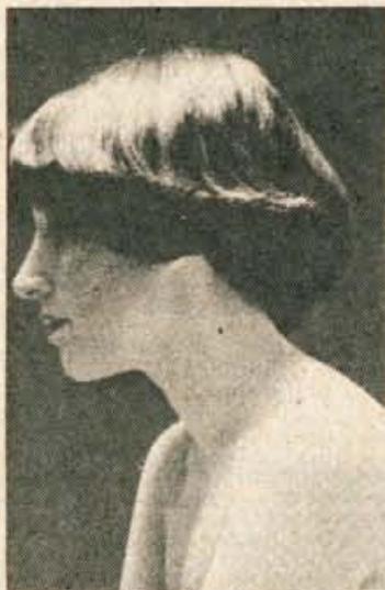
Nadse praktična poletna pričeska za dovolj goste in skrbno pristržene lase. Pričesko urejamo brez navijanja le s krtačo in fenom.

Na navadni plošči bo zavrel liter vode v 10 minutah, za kar potrebujemo 0,3 kilovatne ure. Liter vode bo na hitrokuhalni plošči zavrel v 7 minutah, porabili pa bomo 0,25 kilovatne ure; na avtomatski plošči pa bo voda zavrela v 5 do 6 minutah ob porabi 0,15 kilovatne ure.