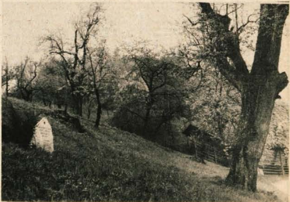
Spominsko obeležje padlemu borcu Janezu Čimžarju pod Babnim vrtnom