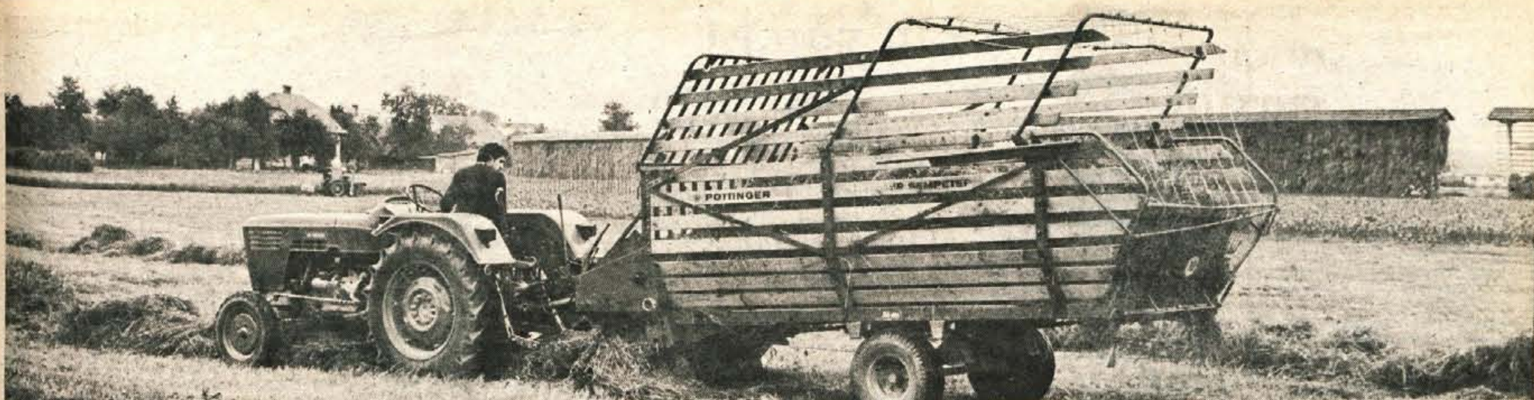
Zaradi slabega vremena se je začetek letošnje košnje zavlekel. Zato kmetovalci hitijo in izkoriščajo vsako urico lepega vremena. V taki naglici so jim kmetijski stroji veliki pomočniki.