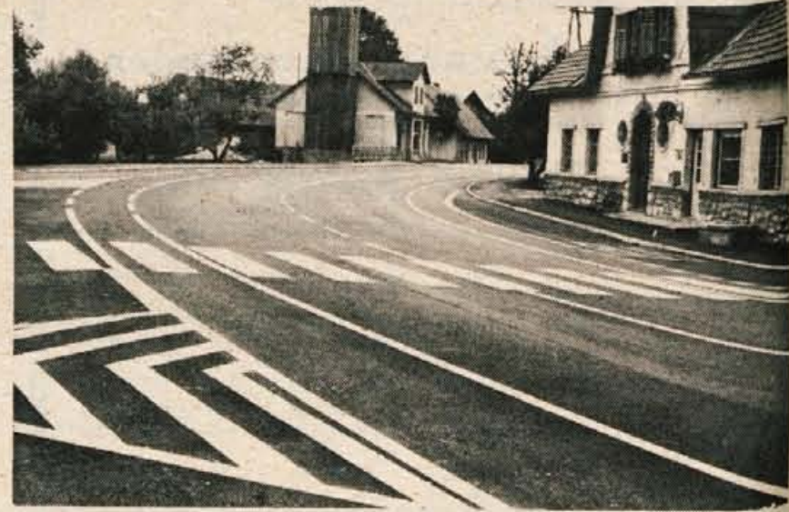
Po ureditvi mostu v Žabnici je Cestno podjetje Kranj pred nedavnim uredilo še zadnja dela na cesti Kranj-Škofja Loka v Žabnici. Zaključna dela pri mostu v Žabnici bi bila končana že prej, če ne bi aprila urejali železniškega nadvoza na cesti Kranj-Ljubljana pri Drulovki.

Naslednja številka bo izšla v sredo, 2. julija