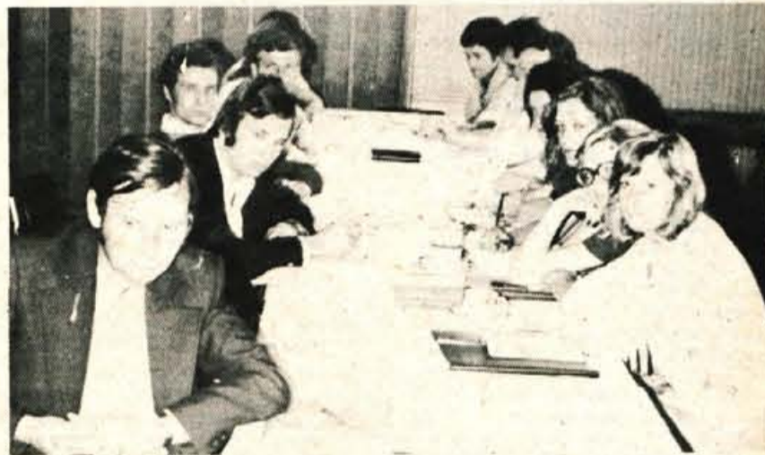
Udeleženci zadnjega seminarja za novo sprejete člane Zveze komunistov na Jesenicah. Seminar je organizirala ideološka komisija pri občinski konferenci ZK, izvedla pa ga je jeseniška delavska univerza.

Upravni postopek v zvezi z varstvom pravic je spremenjen toliko, da bo strokovna služba v primeru odklonitve pravice izstavila obvestilo, na drugi stopnji pa bo o sporni zadevi izstavila odločbo komisija za reševanje ugovorov.