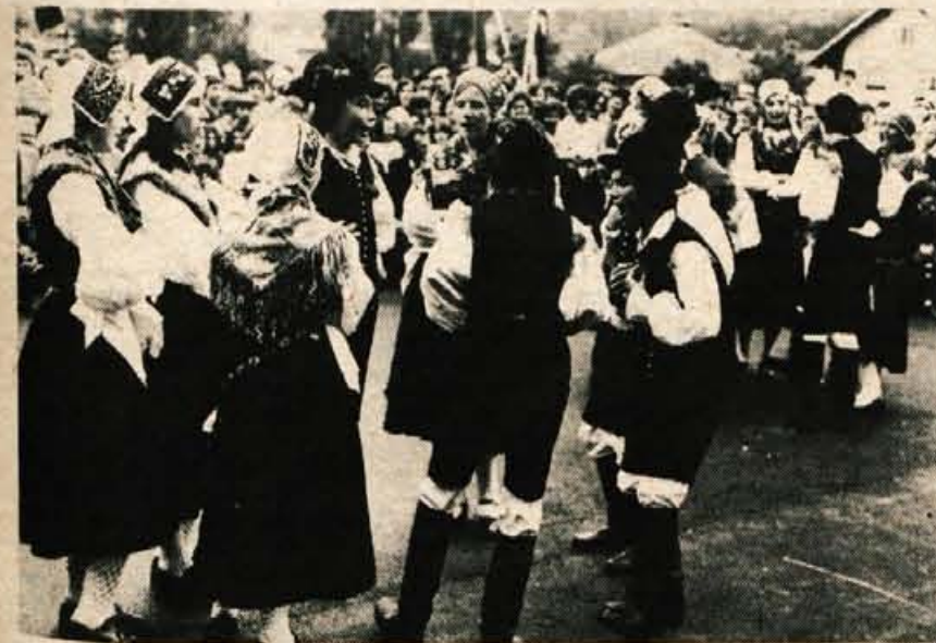
V pestrem kulturnem programu, ki so ga ob otvoritvi pripravili učenci in učitelji, je sodelovala tudi folklorna skupina z venčkom narodnih pesmi in plesov.