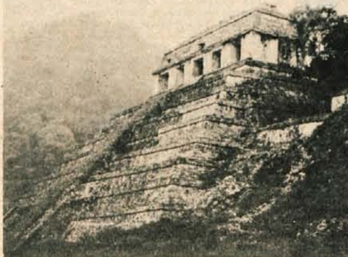
Piramida v indijanskem svetem mestu Palenque. Na vrhu piramide je hram, v katerem so žrtvovali bogovom ljudi in živali.