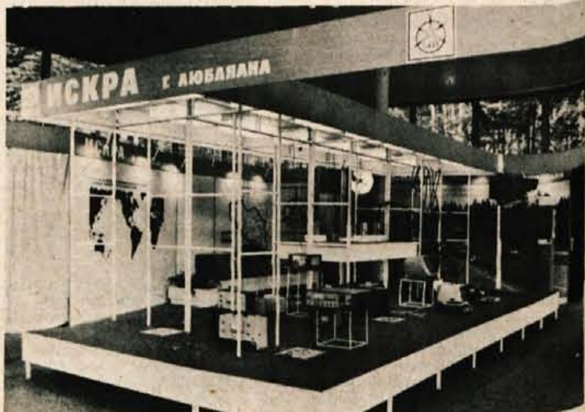
ISKRA NA SEJMU V MOSKVI – Na mednarodni razstavi Zveze 75 v Moskvi, kjer je bila zbrana vsa svetovna elita proizvajalcev telekomunikacij, je razstavljala tudi Iskra. Od razstavljenih primerkov so v glavnem prikazali izdelke kranjske industrije s področja telekomunikacij in merilne tehnike. Po končanem sejmu je Iskra sklenila pogodbo za izdelavo in montažo velike elektronske tranzitne avtomatske telefonske centrale sistema Metaconta 10 C. S pomočjo te centrale bo v prihodnje potekal ves mednarodni telefonski promet med Moskvo in drugimi državami. – M. Kralj.

Že nekaj časa ugotavljamo, da takšna politika ekstenzivnega zaposlovanja prinaša s seboj cel kup težav predvsem glede družbenega standarda. Člani izvršnega odbora so zato menili, naj bi poskusili spodbuditi delovne organizacije, da bi se v večji meri odločale za dislocirane obrate, za izvoz kapitala v druge občine, tja, kjer je delavcev dovolj, možnosti zaposlovanja pa so omejene. L. M.