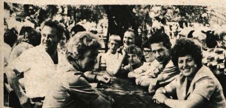
Pred opoldansko pripeko se je tale skupinica Ločanov zatekla v zavetje drevoja, h klöpem in mizam, postavljenim v neposredno bližino prireditvenega prostora. Prišleki iz Skofje Loke so budno spremljali potek dogodkov, saj bodo prihodnje leto prav oni organizatorji VIII. zbora gorenjskih aktivistov v Dražgošah.