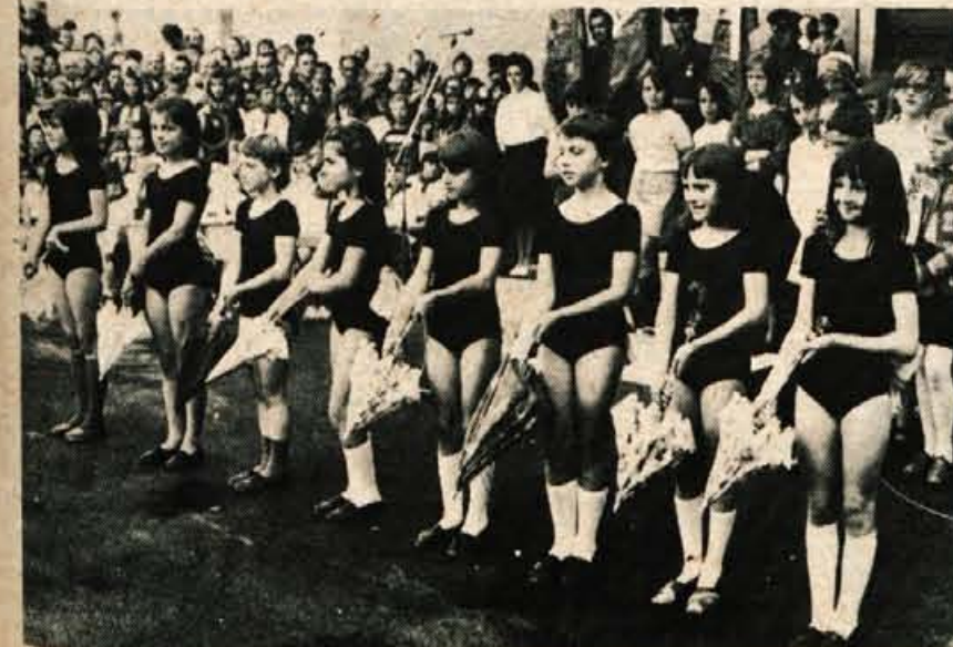
Učence so pripravile pravo baletno predstavo.