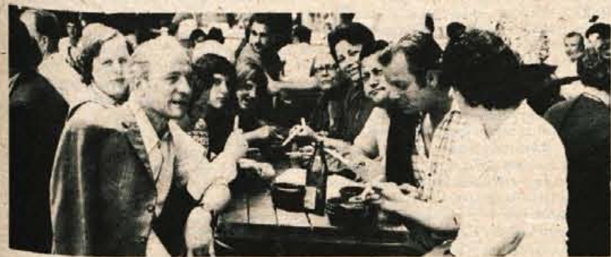
Družbici gostov iz Trziča spričo bogatega sporeda in dobre organizacije prirediteljev v Domžalah ni bilo niti za trenutek dolgčas.