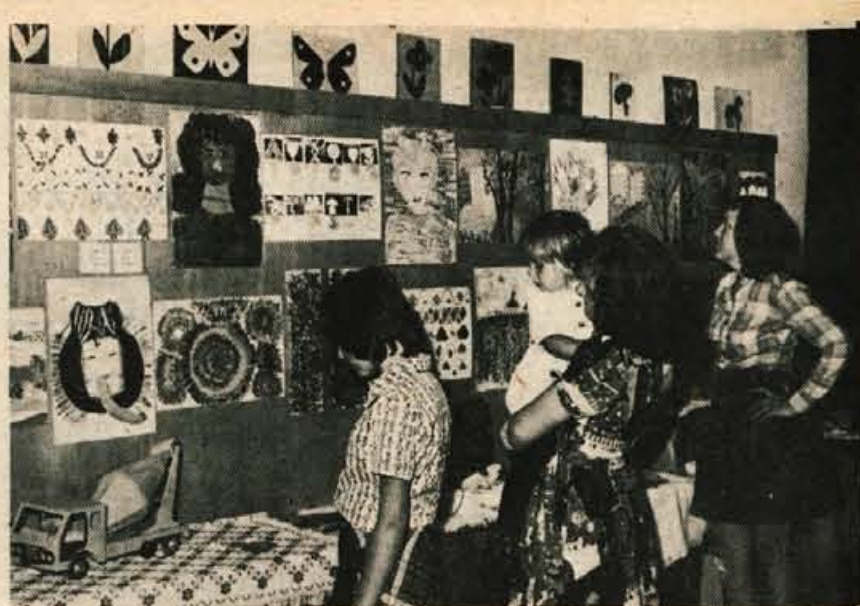
Ob zaključku šolskega leta so na posebni osnovni šoli v Podlubniku pripravili razstavo likovnih del učencev.