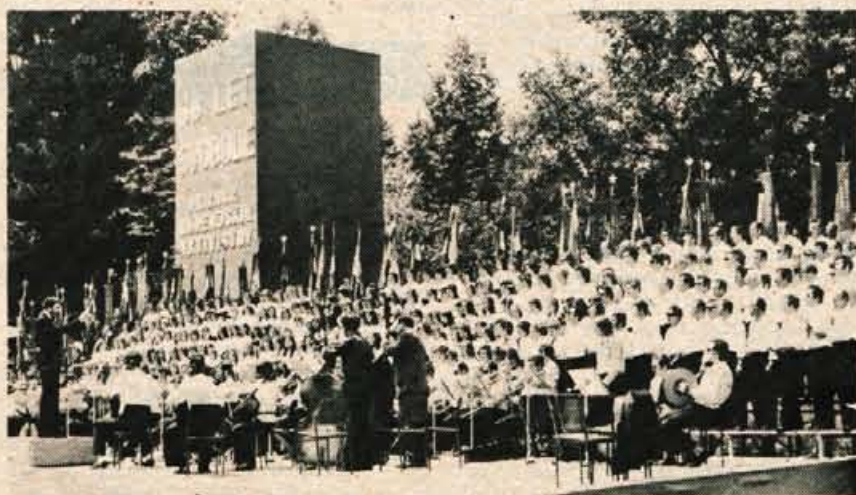
Veličasten je bil pogled na glavno tribuno v domžalskem športnem parku, ki so jo zapolnili pevci, glasbeniki in recitatorji, akterji bogatega kulturnega programa.