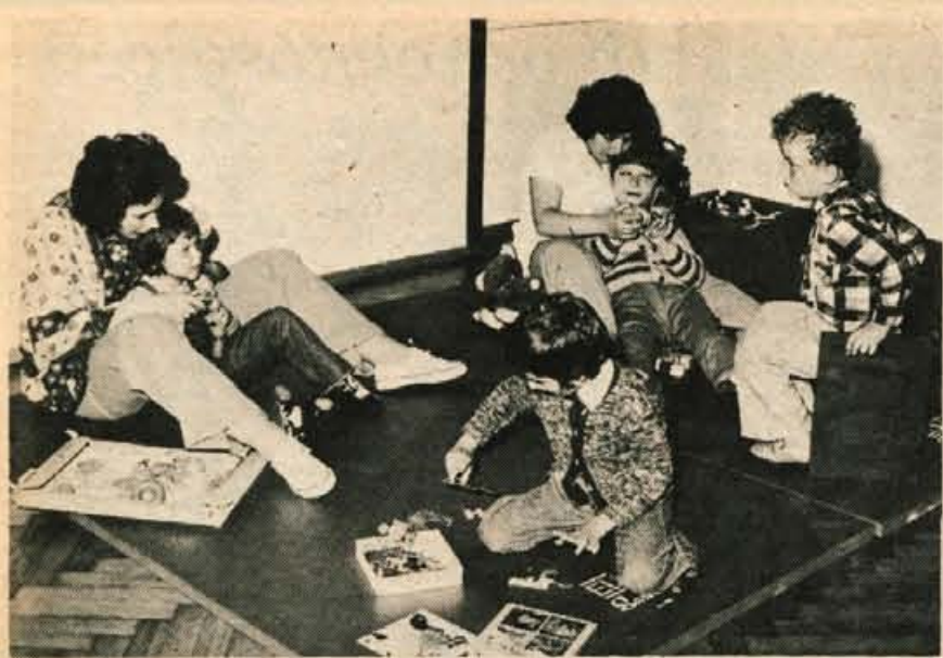
Oddelek dela že dva meseca poskusno, ko pa bo v jeseni odprt ves dan, se bodo matere teh otrok lahko zaposlile.