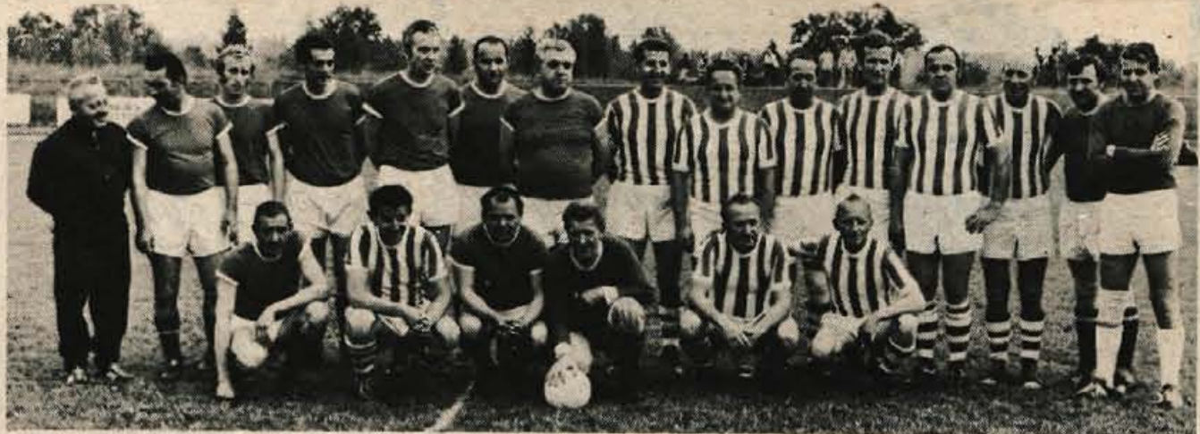
V soboto bi morala biti v Kranju na stadionu Stanka Mlakarja nogometna tekma veteranov kranjskega Korotana in Slovana iz Ljubljane. Žal gostov ni bilo, tako da so se med sabo pomerili domačini. Zmagala je ekipa v modrih dresih z 2:0.

V finalni tekmi za pionirskega prvaka Gorenjske sta se med tednom pomerila prvaka skupin gorenjske pionirske lige. Zmagal je LTH, ki je odpravil v podaljšku ekipo Primskovega s 6:5 (0:0, 1:1), in tako postal letošnji prvak Gorenjske za pionirje. P. Novak