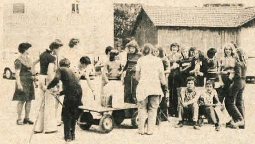
Na osnovnih šolah Prežihov Voranc in Tone Čufar so imeli prejšnji teden očistevalno akcijo, ko so očistili področje krajevskih skupnosti Sava in Plavč. Pri akciji so jih vodili mentorji šol, turističnega društva in delavci Komunalnega podjetja Kovinar. Na sliki so učenci šole Tone Čufar, ki so se udeležili akcije.

Podjetje za distribucijo električne energije Slovenije Ljubljana n.sub.o. TOZD ELEKTRO ŽIROVNICA b.o., Moste 6