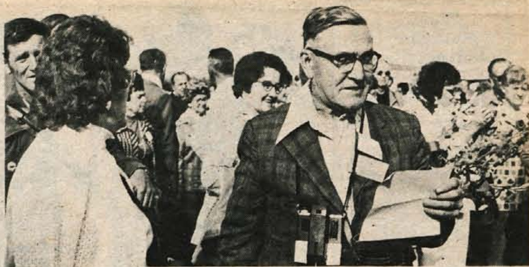
V nedeljo dopoldne je na letališče Ljubljana-Brnik prispelo 460 slovenskih rojakov iz ameriškega mesta Minesotta. Skupino vodi znani ameriški Slovenec Frenk Tekavec.