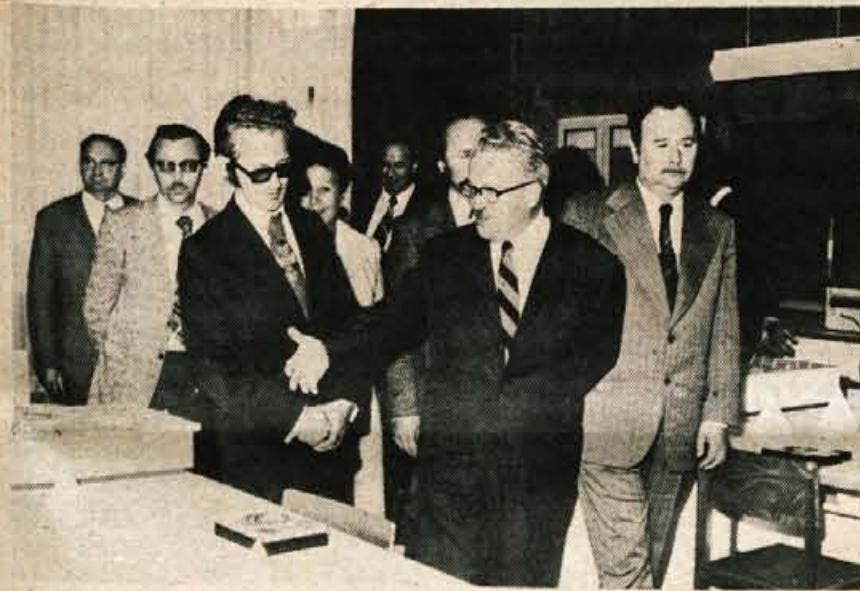
Ob otvoritvi si je nove prostore najprej ogledal član predsedstva ZKJ in član predsedstva SFRJ Edvard Kardelj v spremstvu družbenopolitičnih predstavnikov kranjske občine in krajevne skupnosti ter drugih gostov.