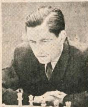
P. Keres - M. Botvnik Sicilijanska obramba

Nedavno so naši časopisi - razmeroma skromno - objavili, da je preminil eden najplodovitejših šahovskih teoretikov in najuspešnejših turnirskih borcev Paul Keres. Odsel je eden velikih iz skupine Botvnikovih sodobnikov, morda sploh najpomembnejši, ki pa vendar ni nikoli okusil časti svetovnega prvaka. Pač pa je s svojo stalno dovršeno in kombinatorno igro dosegal vedno visoko uvrstitev, večkrat drugo mesto na največjih turnirjih, zato se ga je oprjel naziv «večno drugič». V spomin na Keresovo ustvarjanje objavljamo njegovo partijo z Botvnikom leta 1956 v Moskvi s spominskega Aljehinovega turnirja.