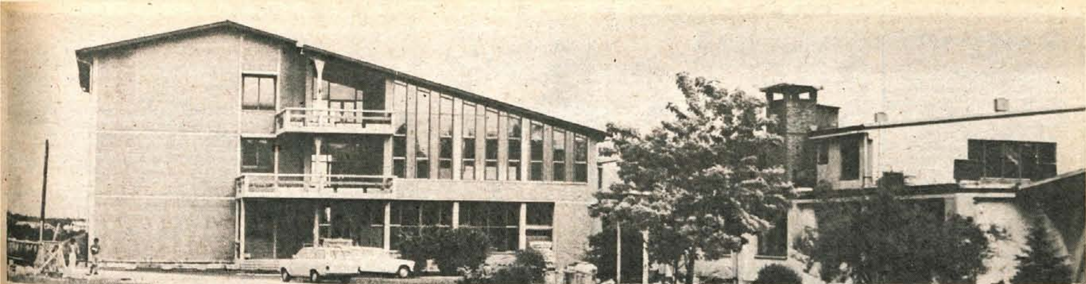
Danes popoldne bodo pri osnovni šoli Lucijana Seljaka v Stražišču odprli nov prizidek. To bo hkrati tudi osrednja svečanost v počastitev krajevnega praznika krajevne skupnosti Stražišče.