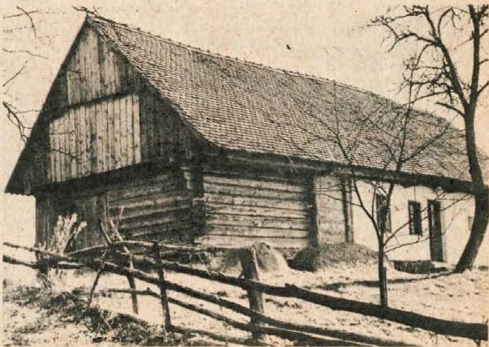
Rojstna hiša Bleiweisovega rodu, »pri Frjanu« na Trsteniku.