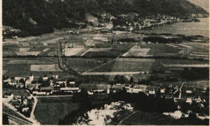
Sentropert ob Osojskem jezeru. Na sliki sta dobro vidna stolpa: na levi je luteranska, na desni katoliška cerkev. Ob tej je grob Prešernove matere.