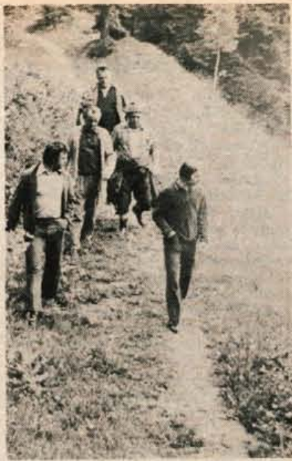
Člani komisije so si temeljito ogledali predel, kjer naj bi potekala jeseniška TRIM steza.

Do zdaj so denar za izgradnjo telovadnice na vzhodni strani objekta Železarsko izobraževalnega centra že zagotovili v jeseniški Železarni, pri temeljni izobraževalni skupnosti občine, pri republiški izobraževalni skupščini, pri republiški telesno-kulturni skupnosti, nekaj denarja pa bodo prispevali tudi zaposleni v delovnem kolektivu Železarsko izobraževalnega centra. Republiški skupnosti bosta za telovadnico namenili kredite. Nova telovadnica bi veljala 5 milijonov dinarjev. D. Sedej