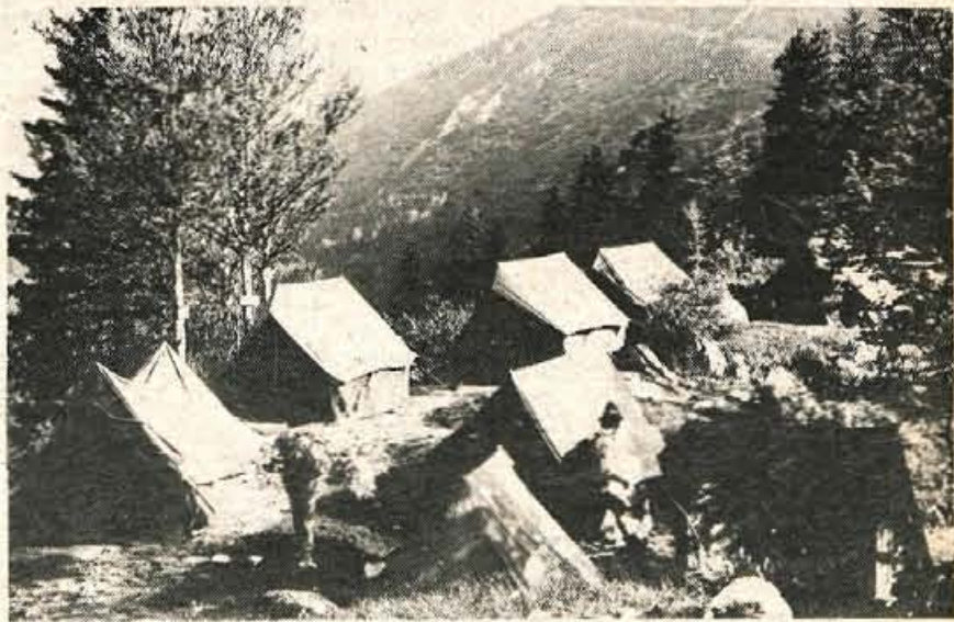
Kališče se je v soboto in nedeljo spremenilo v naselje šotorov, ki so jih postavili vojaki, pripadniki teritorialnih in partizanskih enot kranjske in trziške občine, miličniki, taborniki in planinci ter pripomogli, da je kališko slavnostno srečanje potekalo v prijetni okolici. Plateno naselje pri Domu Kokrškega odreda je bilo za večino obiskovalcev Kališča prijetna zanimivost, obenem pa pomoč pri premostitvi prenočitvene stiske. (jk)

Kot zanimivost zase velja omeniti, da so prireditelji letos izdali specialne registrirne kartone, ki bodo lastnikom po petih zbranih žigih, se pravi po petih spominskih pohodih zapored, navrgli lepo jubilejno značko. Kartonov je bilo samo v nedeljo razdeljenih 864. I. G.