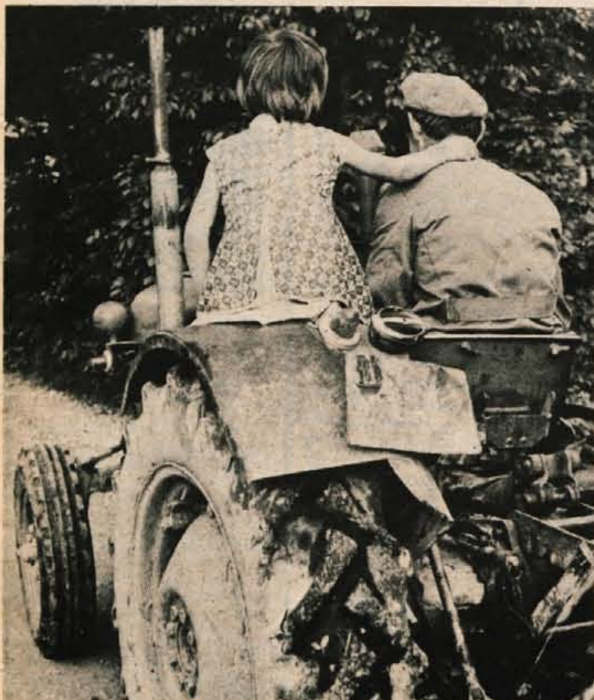
Z očetom se je res prijetno peljati na traktorju; a brez posebnega sedeža za sopotnika je takale vožnja kaj tvegana in se lahko prav nesrečno konča.

V primerjavi z drugimi prometnimi nesrečami, ki jih v Sloveniji povzročajo motorna vozila, so nesreče s traktorji razmeroma majhne. Vendar se nesreče, v katerih so udeleženi traktorji, pogosto končajo z zelo hudimi posledicami, tudi s smrtjo. V lanskem letu je bilo na primer prometnih nezgod s traktorji v Sloveniji 96, vendar niso vsi udeleženi nesreče pri delu s traktorji.