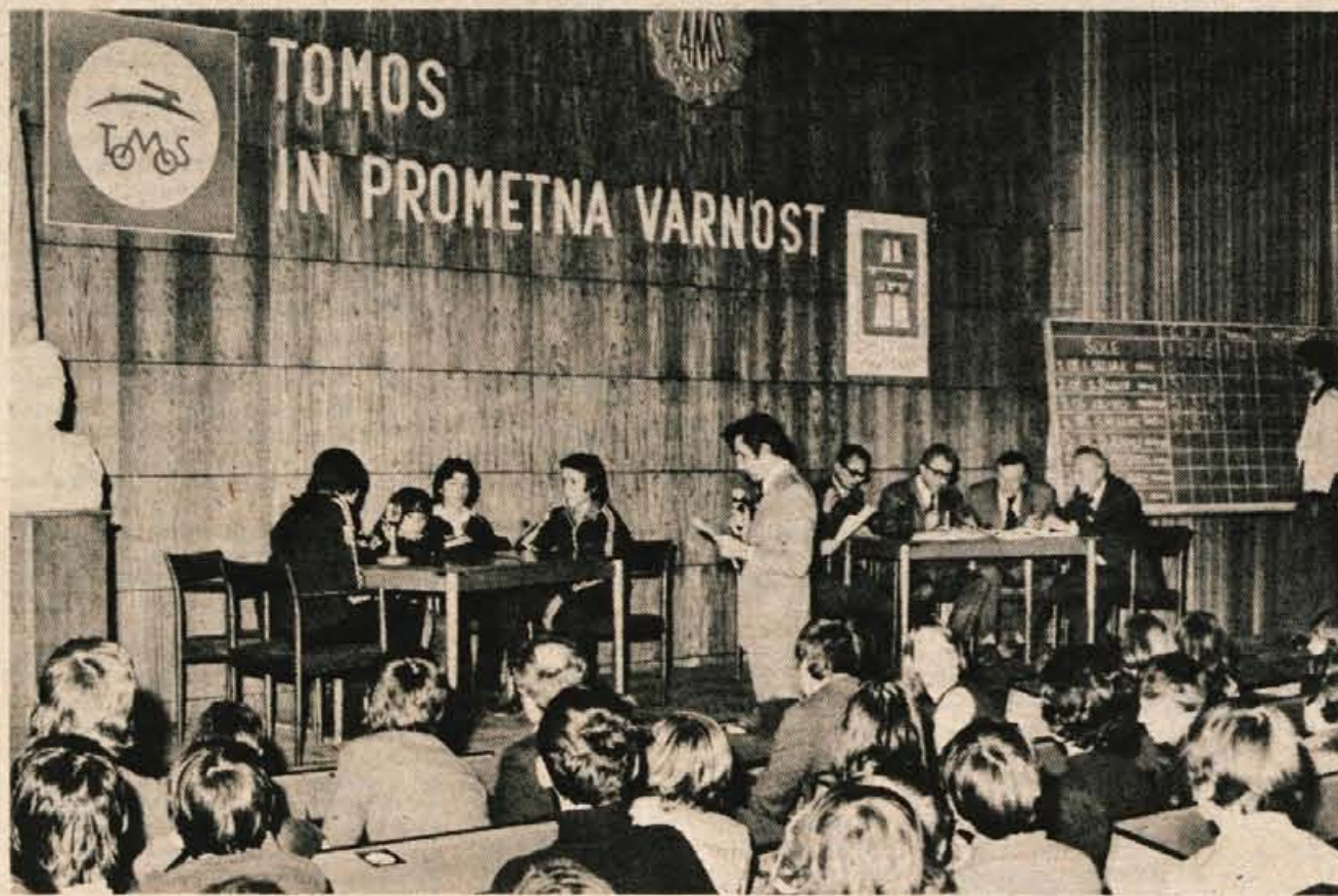
Delo s šolarji je prijetno in hvaležno, pravijo pri kranjskem AMD. Posnetek je z zadnjega kviza kranjskih osnovnih šol v počastitev 20-letnice koprškega TOMOSA.

Trudijo se, da bi bila njihova organizacija čim močnejša, kajti čim več bo članov, več bo tem organizacija lahko nudila. Kako pa je danes na cesti, pa vsi vozniki vemo, vsak trenutek se ti lahko zgodi, da potrebuješ pomoč. In če si član društva, je vse skupaj, verjemite, veliko laže. Os.