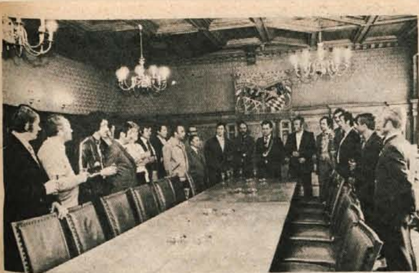
Kranjski strelci v Ambergu od 5. do 8. junija - Sprejem pri županu mesta Amberga.