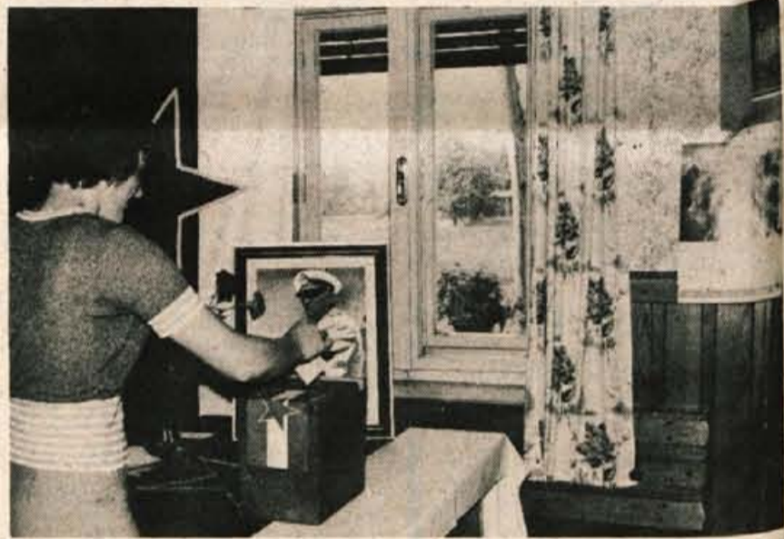
REFERENDUM V PODNARTU USPEL - Prebivalci krajevne skupnosti Podnart so se v nedeljo odločili za samoprispevek za asfaltiranje cest in ureditev nekaterih drugih komunalnih del. Od 625 volilnih upravičencev se jih je glasovanja na referendumu udeležilo 97,30 odstotka, za samoprispevek pa jih je glasovalo 73,91 odstotka. Samoprispevek bodo plačevali od 1. julija letos do 30. junija 1980. Zaposleni in upokojnenci, ki imajo več kot 1000 dinarjev pokojnine, bodo plačevali en odstotek od osebnega dohodka, kmetje pa en odstotek od katastrskega dohodka ter 10 dinarjev od kubičnega metra prirastka lesa na leto. Prebivalci bodo s samoprispevkom zbrali prek milijon dinarjev. - C. Rozman