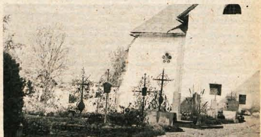
Umetno kovani križi na osojskem pokopališču.