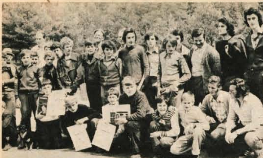
30. maja je bilo na jezeru na Šobcu pri Lescah občinsko prvenstvo ladijskih modelov. Na sliki udeleženci tekmovanja, ki ga je organiziral občinski svet zveze za tehnično kulturo Radovljica.