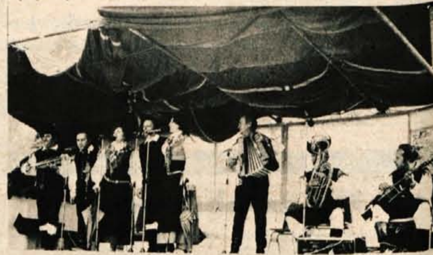
Organizatorji letošnje dirke za svetovno prvenstvo in Veliko nagrado Jugoslavije so letos poskrbeli za pester dodatni program. Posebno privlačen je bil koncert Avsenikov med odmorom med prvo in drugo dirko.