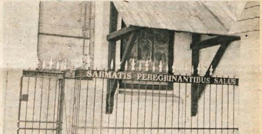
Grob poljskega kralja Boleslava — Mutca Osojskega.