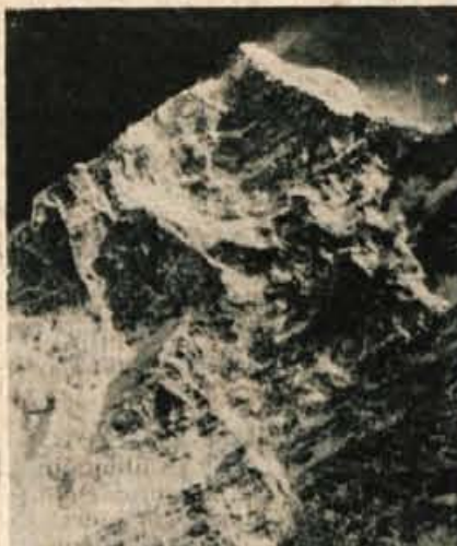
Južna stena Makaluja - 8481 m