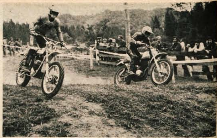
Na podljudeljski dirki se je po poškodbi prvič pojavil bivši svetovni prvak v kategoriji 250 kubičnih centimetrov Genadij Mojsejev iz Sovjetske zveze na stroju KTM. V prvi vožnji ni odigral vidnejše vloge, v drugi pa je bil peti ter tako najavil pohod med najboljše. Na fotografiji vidimo sovjetskega šampiona s številko 22 v boju s kasnejšim zmagovalcem Evertsem.