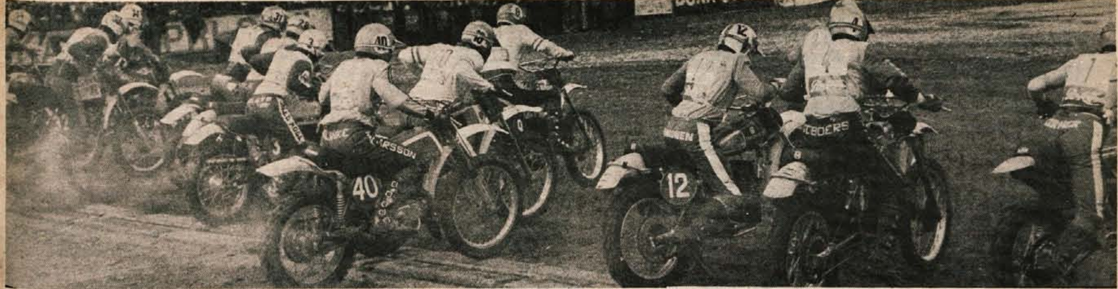
Nedeljsko dirko za svetovno prvenstvo v motokrosu za kategorijo 250 kubičnih centimetrov je spremljalo skoraj 20.000 ljudi. Žal je tekmovalce in gledalce posebno v drugi vožnji motil dež