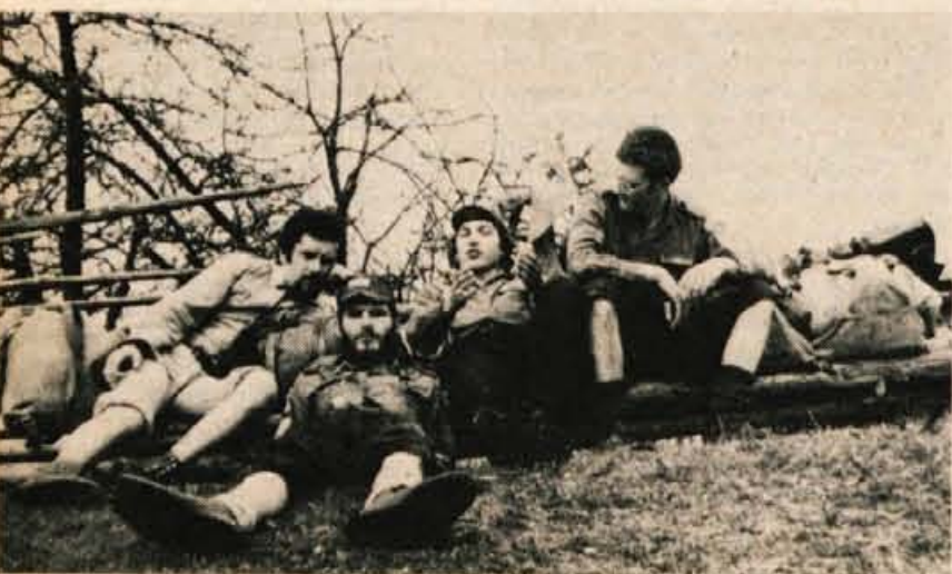
Ekipa odreda Zelenega Zirka je na slovenskem taborniškem partizanskem mnogoboju v Novem mestu zasedla prvo mesto.

Prvi dan tekmovanja so ekipe opravile teste iz prve pomoči, topografije in zgodovine taborništv. Pregledali pa so jim tudi opremo. Start za tekmovanje je bil v soboto, 24. maja, ob 4. uri zjutraj. Prvi dan so morale ekipe prehoditi več kot dvajset kilometrov in na tej poti opraviti številne naloge: od streljanja, signalizacije, prehoda pod določenim kotom, prehoda prek minskega polja do risanja skic terena, minskega polja in profila terena. Vse to in pa zelo težka pot ter dež, ki je neusmiljeno padal ves dan, sta tekmovalce zelo namučila. Najboljši so bili na poti skoraj dvanajst ur, zadnja ekipa pa je prišla na cilj šele uro po polnoči. Zaradi dežja tudi niso postavili bivaka in zakurili taborniškega ognja, temveč so se zatekli v vaško šolo.