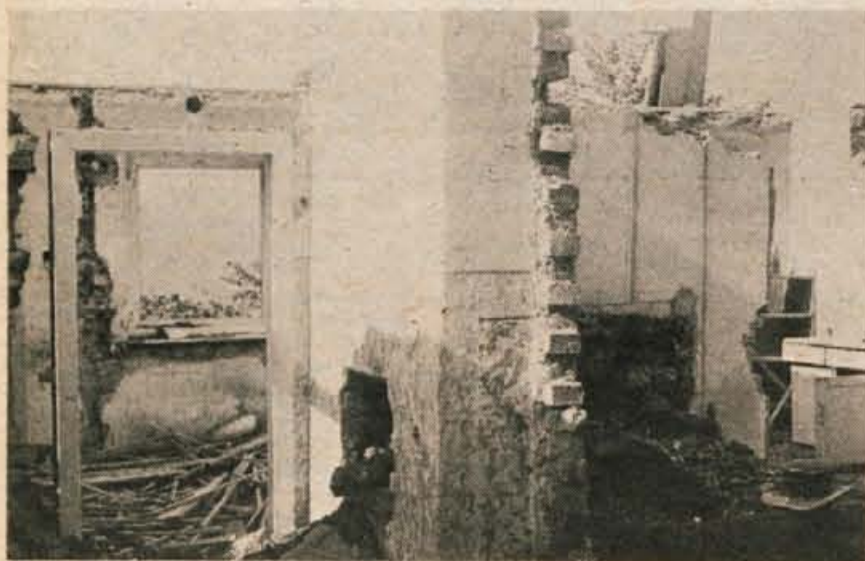
Podrt Ambrožičev dom v Dražgošah.

Letošnjo pomlad so naravne sile zdivjale kot že dolgo ne. Plazovi in vodna ujma so podirali hiše, odnašali zemljo in mostove, zasipali travnike s peskom in kamenjem. V Selški dolini je plaz načel oziroma podrl več hiš. Med njimi tudi hiše štirih delavcev tovarne Iskra — Elektromotorji Železniki.