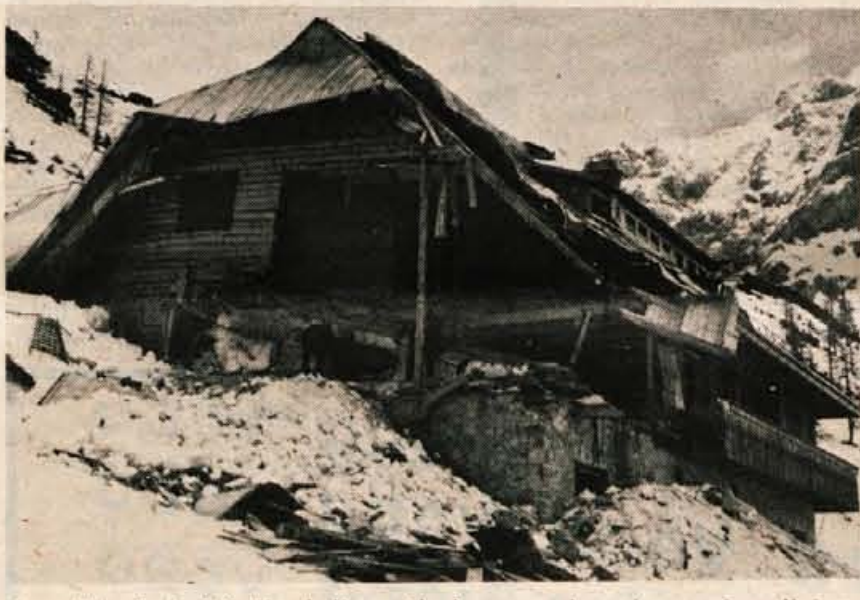
Jeseniški planinci čistijo okolico poškodovanega doma in ga pripravljajo za obnovo.