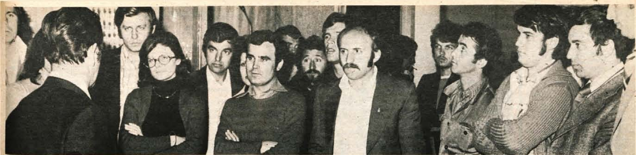
V nedeljo so se začele prireditve z naslovom »Dnevi kulture mladih iz SR Makedonije v SR Sloveniji«. Slovenskemu občinstvu so se predstavili mladi makedonski likovni, gledališki in filmski umetniki, slovenska mladina pa jih je seznanila s kulturnim in gospodarskim življenjem v naši republici. Včeraj so si gostje iz Makedonije ogledali muzeje v Kranju ter tovarno Gorenjska oblačila. Dveji bodo mladi umetniki iz Makedonije končali obisk v naši republici. (-lb)