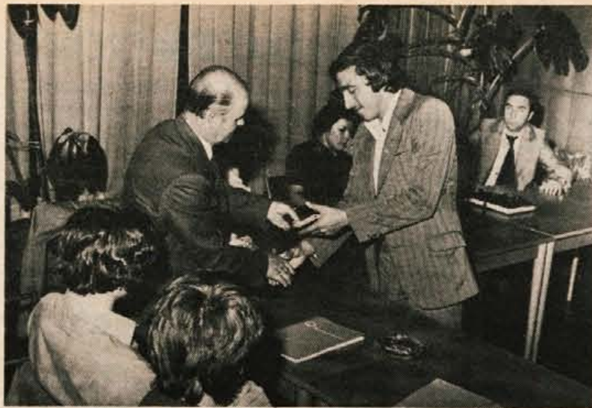
V Kranju so na pravkar končanem tečaju usposobili 28 gorskih stražarjev. Na zaključni slovesnosti so jim podelili izkaznice in značke.

Starejši člani oziroma klubovci so sestavljali 7 ekip. Najboljši so bili člani Zmajevga odreda iz Ljubljane, ki so zbrali 1992 točk, drugo mesto je zasedla ekipa odreda Srečka Kosovela iz Sežane s 1918 točkami in tretje ekipa odreda Sivega volka iz Ljubljane s 1713 točkami. J. M.