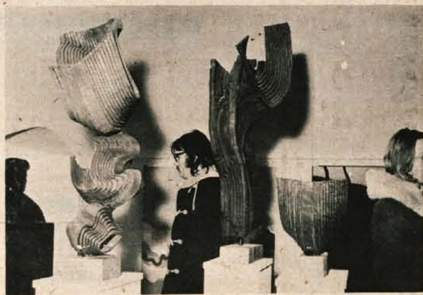
V petek, 10. januarja, ob 18. uri so v galeriji Prešernove hiše v Kranju odprli razstavo »Likovna prizadevanja na Gorenjskem 1974«, ki jo je pripravil Gorenjski muzej v Kranju. Razstavo bodo v okviru kulturne izmenjave s Pomurjem februarja prenesli v Murško Soboto. Ob tej priložnosti bo izšel tudi katalog. (jk)