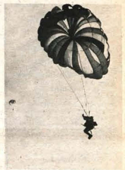
Na proslavi v Dražgošah so sodelovali tudi padalci Alpskega letalskega centra iz Lesca.