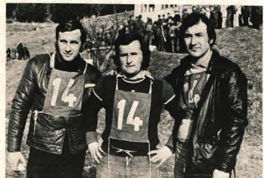
Patrulja ZRVS iz Radovljice je bila po doseženem času najhitrejša, vidnejšega mesta pa ni dosegla zaradi napak pri reševanju zastavljenih nalog.