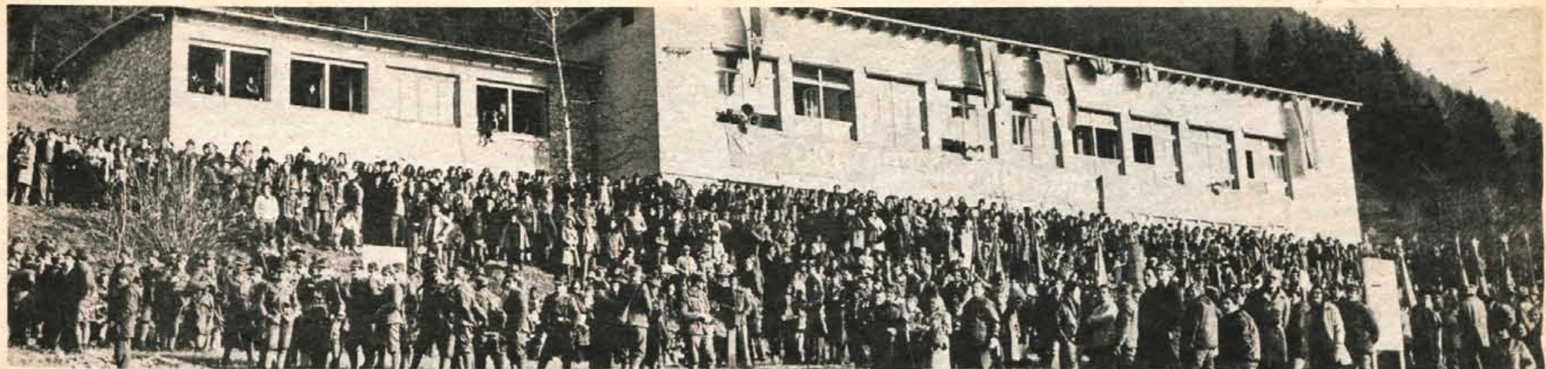
Skoraj 7000 ljudi je v nedeljo prisostvovalo letošnji osrednji spominski svečanosti v Dražgošah, ki ji niti odsotnost snega ni mogla skaliti izjemno prazničnega vzdušja