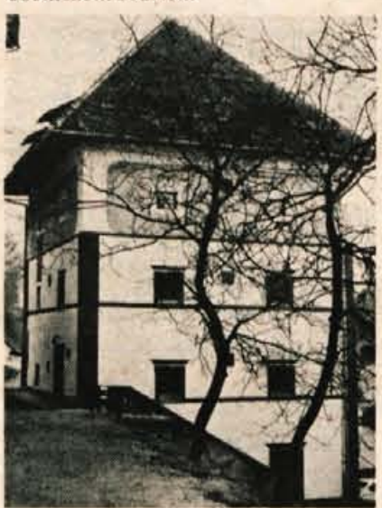
V petek, 10. januarja, so v prostorih nekdanje nunske kašče v Skofji Loki odprli nove prostore zgodovinskega arhiva.

Od začetka arhivske dejavnosti v Skofji Loki se je v arhivu nabralo že za približno 300 tekočih metrov gradiva. Gradivo se namreč meri po dolžinah, kakor je zloženo po policah. Največjo vrednost in zanimivost predstavljajo mestne in cehovske listine od 16. stoletja dalje. Pri cehih so najstarejše arhivalije lončarskega ceha iz leta 1522! V drugo polovico 18. stoletja sega fond zemljiške knjige, ki se veže na današnjo zemljiško knjigo pri škofjeloškem občinskem sodišču.