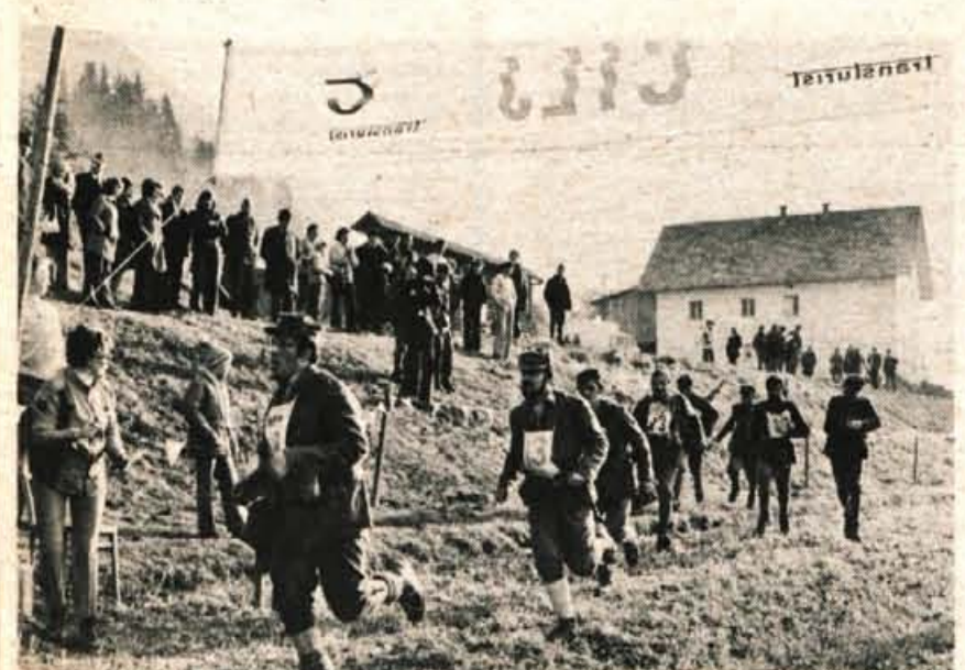
Drugo ekipo jeseniško-bohinjskega odreda so setavljali sami prekaljeni alpinisti — udeleženci himalajskih odprav. Zasedli so četrto mesto.