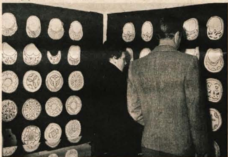
V galeriji Mestne hiše v Kranju so v petek odprli razstavo »K zametkom slovenske kulture«, ki sta jo pripravila Narodni muzej v Ljubljani in Gorenjski muzej iz Kranju.