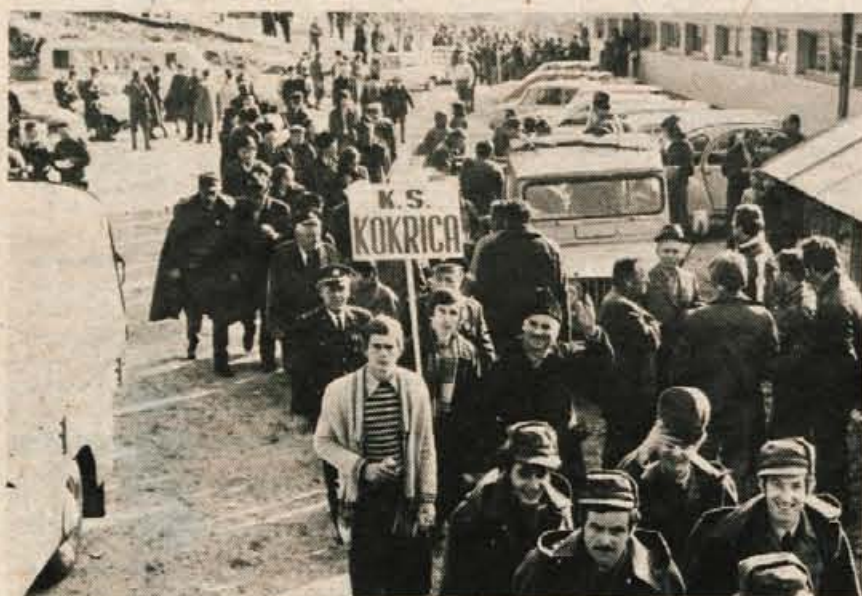
V Dražgoše so prišli tudi Kokričani.