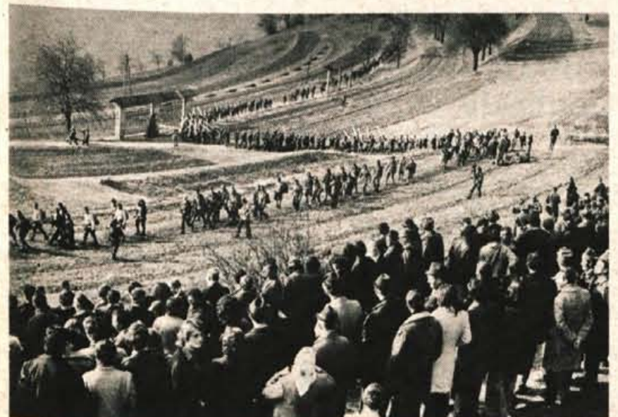
Iz Bohinjske Bistrice je v Dražgoše prispela dolga kolona udeležencev dražgoškega slavlja. Pohodna enota je štela več kot 700 ljudi.