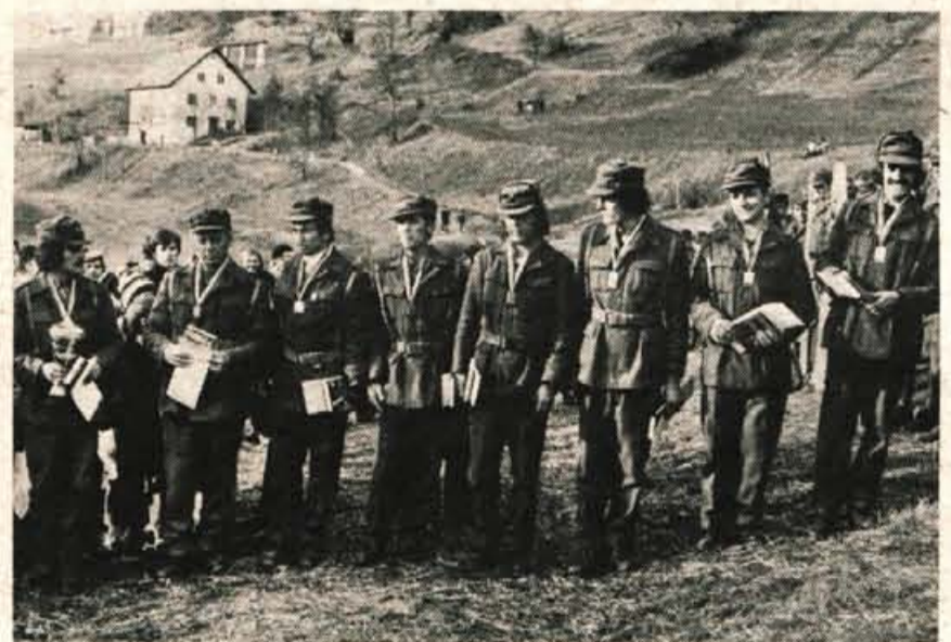
Med patruljami partizanskih odredov je bila najboljša ekipa kokrškega partizanskega odreda.