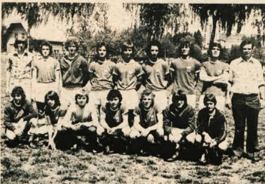
V nedeljo se je v Škofji Loki končal mednarodni nogometni turnir mladinskih ekip. Turnirja so se udeležile enajsterice: TSV Stuttgart 1999 A, TSV Stuttgart 1999 B, NK Preddvor in NK LTH. Največ uspeha so imeli domači nogometaši. Rezultati: Stuttgart B : Stuttgart A 0:4 (0:1), LTH : Preddvor 9:1 (4:0); Preddvor : Stuttgart B 2:2 (0:1) - po streljanju enajstmetrov 7:6, LTH : Stuttgart A 3:1 (3:0). Vrstni red: 1. NK LTH, 2. TSV Stuttgart A, 3. Preddvor, 4. TSV Stuttgart B. V bližnji prihodnosti bodo Škofjeločani urni, obisk ekipe Stuttgarta iz ZR Nemčije. Na posnetku: zmagovalna mladinska ekipa LTH iz Škofje Loke (-jg)