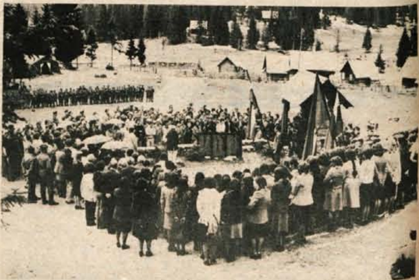
Udeleženci občnega zbora slovenskega zdravniškega društva in gostje so ob zaključku s komemoracijo počastili spomin padlih borcev tretjega bataljona Prešernove brigade ob spomeniku, ki so ga postavili na kraju nekdanjega hotela Lovca in ki je postal grob za 79 borcev tega bataljona. Ob spomeniku delu Toneta Svetine je govoril Matej Bor, partizanske in borbene pesmi pa je pel združeni mladinski pevski zbor radovljiške občine.