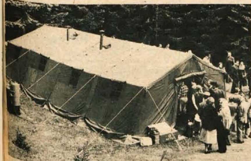
Saniteta postaja vojaške enote, kot je bila prikazana na Pokljuki, lahko nudi ranjencem in bolnikom specialistično zdravstveno pomoč. Zaradi naravnih pogojev prikaza delovanja je bila sodobna poljska bolnišnica postavljena ob cesti, kar bi sicer bilo v drugačnih »zaresnih« pogojih nemogoče. Sestavljena je iz več oddelkov od dekontaminacijskega, do operacijskega, kjer lahko operira kirurška ekipa z vso sodobno opremo, do reanimacijskega oddelka, sterilizacije, lekarne in evakuacijskega oddelka.

III. SEJEM OPREME IN SREDSTEV CIVILNE ZAŠČITE V KRANJU OD 26. DO 30. MAJA