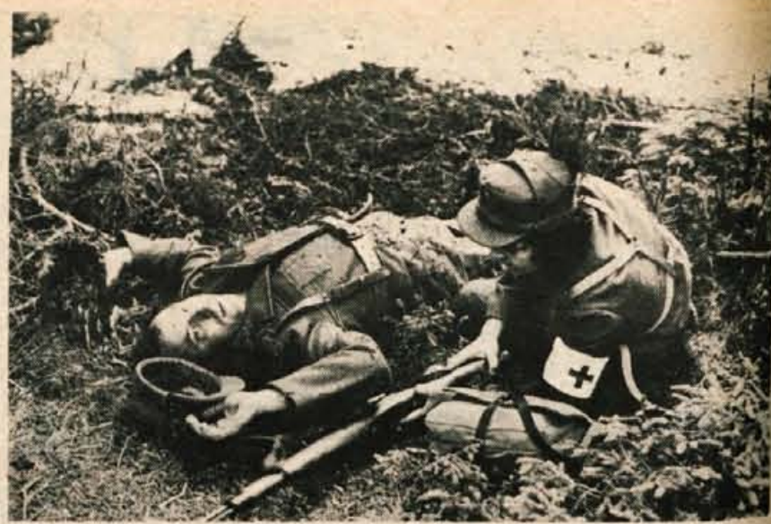
Udeleženci občnega zbora SZD in pa vabljeni gostje so si na Pokljuki v bližini Sport hotela ogledali demonstracijsko vojaško vajo s praktičnim prikazom delovanja sanitetne postaje vojaške enote in enote SLO. Na sliki: med napadom sovražnika nudi bolničarka - pripadnica enote teritorialne obrambe prvo pomoč ranjencu s sanitetnim materialom iz svoje torbice in s puško kot sredstvom za imobilizacijo. Ta prva pomoč na kraju samem ostaja še vedno na prvem mestu kljub sicer izredni opremini in zdravstvenemu kadru, ki pa jasno tu »na vroči liniji« nima mesta.