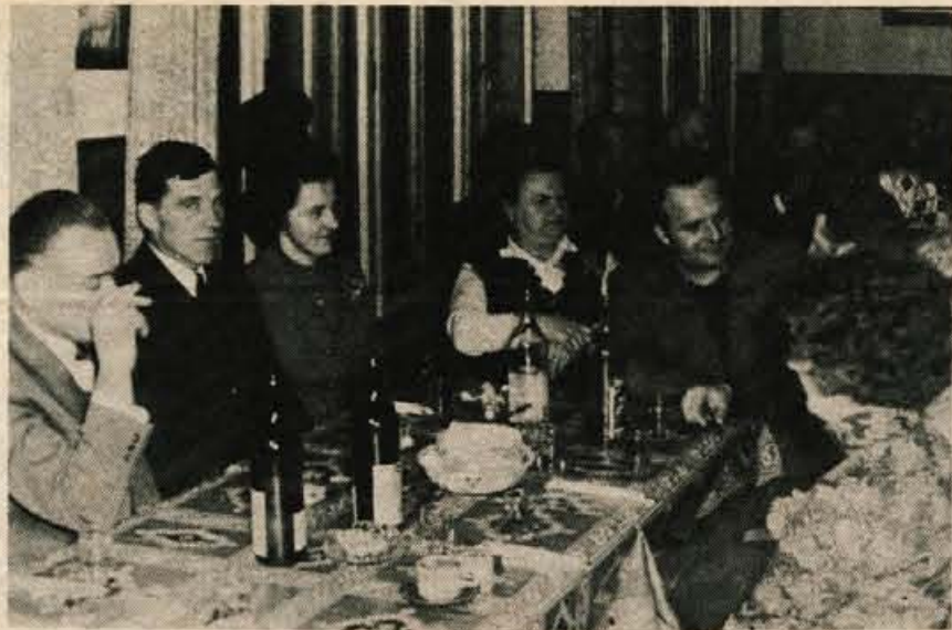
Krajevna skupnost Jošt je prejšnjo soboto pripravila v Domu na Joštu praznovanje v čast dneva žena. Nanj so povabili vse žene iz svoje krajevne skupnosti. Vse žene starejše od 70 let pa so obiskali na domu in jih obdarili. Praznovanje dneva žena v taki obliki je bilo v tej krajevni skupnosti prvič po osvoboditvi.

Na dispečerski službi Elektrogospodarstva Slovenije so povedali, da zadnje deževje še ni bistveno izboljšalo preskrbe z električno energijo, tako da so še vse omejitve v veljavi. S polno zmogljivostjo obratujejo le soške elektrarne, medtem ko se gladina Save in Drave še ni dosti zvišala. Trenutno proizvajajo hidroelektrarne 3,9 milijona kilovatih ur, kar je še vedno več kot 6 milijonov ur manj kot bi jih proizvedle, če bi delale s polno zmogljivostjo. Je pa za milijon in pol kilovatih ur več kot pred deževjem.