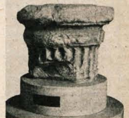
Knežji kamen so v drugi polovici preteklega stoletja prenesli v celovski Deželni muzej, ga ustrezno restavrirali in opremili z napisno tablico. Kamen je visok 65 cm.