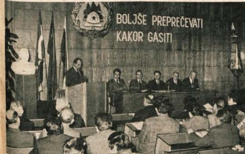
S sobotne skupščine Občinske gasilske zveze Kranj, ki združuje 2344 aktivnih članov in članic