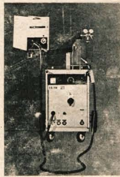
A 10-275 naprava za polavtomatsko varjenje A 10-275 in A 10-400

je naprava za ekonomično polavtomatsko varjenje in je izpopolnjena, zato ima še večje zmogljivosti