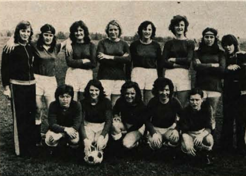
Zgoraj: nogometašice Domžal, spodaj: med razgibano igro.

Jugoplastika: Priznić, Erceg, Pešić, Mganić, Radojčić, Dožaj, Lelas, Kliškič (Čovo), Čosić, Čagalj, Glavaš.