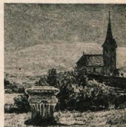
Knežji kamen, ko je še stal na Gosposvetskem polju v bližini krnskega gradu.