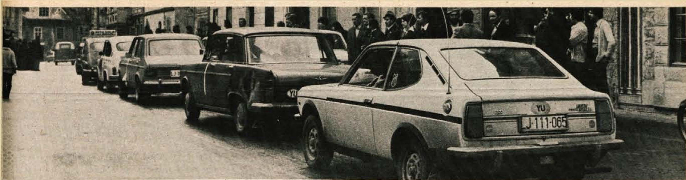
V povorki skozi Škofjo Loko so se minulo soboto občanom predstavili člani športne sekcije domačega AMD, ki bodisi v različnih vrstah avtomobilov bodisi na jeklenih konjičkih uspešno zastopajo barve kluba v Jugoslaviji in v tujini.