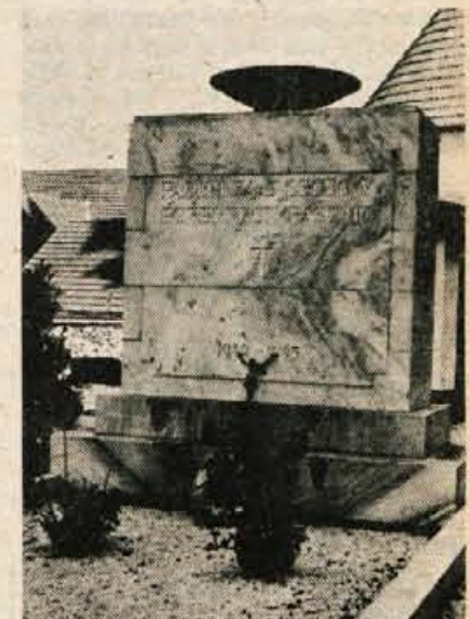
Tak je spomenik zdaj; namesto umetniške plastike uboga — skleda.