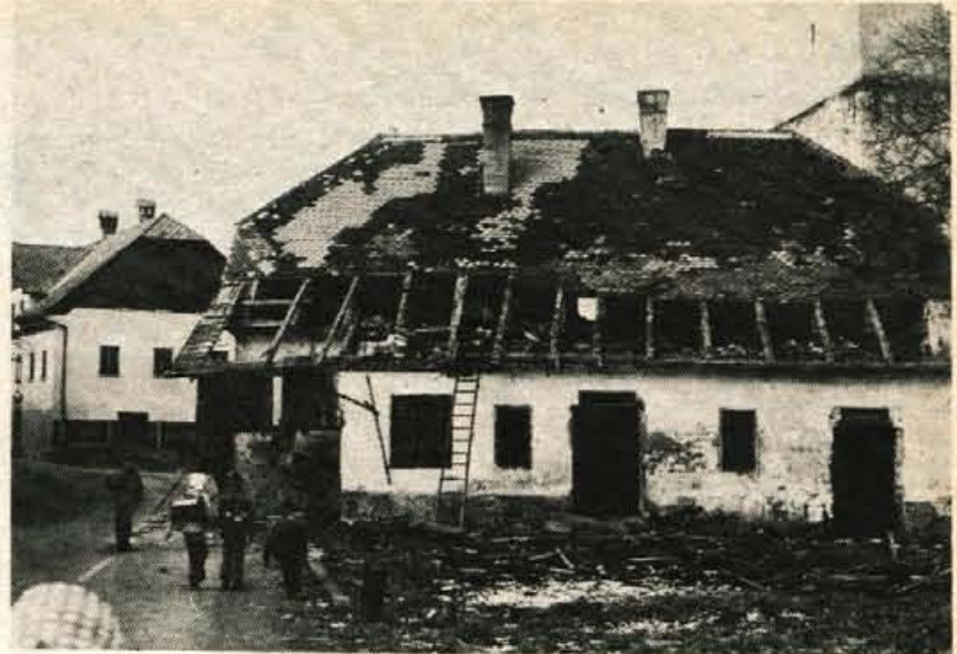
Po programu komunalnega urejanja so se v krajevni skupnosti Lesce v radovljški občini že pred časom odločili za rušitev stavbe, v kateri je bila včasih šola. Stavba, ki stoji blizu nove šole, je posebno v zadnjih letih močno ovirala promet v tem delu Lesce. Zdaj jo bodo končno porušili in nato uredili križišče. Pogovarjajo se tudi, da bi v tem delu nato uredili park in postavili spomenik NOB. — A. Ž.

Toliko denarja pa se iz prispevka delovnih organizacij ne bo zbralo. Zato v Kranju že razmišljajo o dodatnih virih: o novem samoprispevku občanov, novih prispevkih delovnih organizacij in večji prispevni stopnji za šolstvo. Najbolj se zavzemajo za slednje, saj bi financiranje osnovnega šolstva lahko na ta način sistemsko uredili in zagotovili stalna sredstva za gradnjo novih šolskih prostorov. I. R.