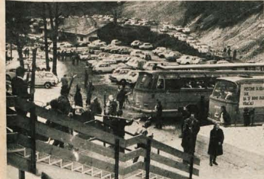
LETOŠNJI KRVAVŠKI REKORD — Kljub pičlim snežnim razmeram so krvavška smučišča dosegla v soboto in nedeljo rekorden obisk v letošnji zimi. V soboto so gondole popeljale na Kravce 2500 smučarjev, v nedeljo pa jih je bilo najmanj 1000 več. Na parkirnem prostoru se je v nedeljo stalno zadrževalo okrog 1000 osebnih vozil in avtobusov. Obiskovalci Kravca so v nedeljo popoldne povedali, da je smuka ugodna, čeprav dosega snežna plást ponekod le 20 centimetrov. Krvavški žičničarji letos cen niso povečali. Največ zanimanja je za popoldanske karte, ki veljajo vsak dan od 12. ure dalje in je treba zanje odšteti le 40 dinarjev! Dober obisk pričakujejo tudi med tednom. Žičnico ponavadi poženejo ob pol osmih zjutraj in jo ustavijo ob pol sedmih zvečer. (jk)

V nedeljo se je karavana najboljših svetovnih alpskih smučarjev poslovala od japonskega mesta Naeba in se napotila proti Kanadi in Združenim državam Amerike. V družini najkvalitetnejših svetovnih smučarjev je tudi Trzičan Bojan Križaj, ki je že na prvi tekmi v veleslalomu dokazal, da je bila njegova pot v daljne dežele upravičena. V veleslalomu je dosegel odlično 15. mesto, kar je njegova najboljša veleslalomska uvrstitev nasploh. V sobotnem slalomu ni imel sreče, saj je odstopil. -jk