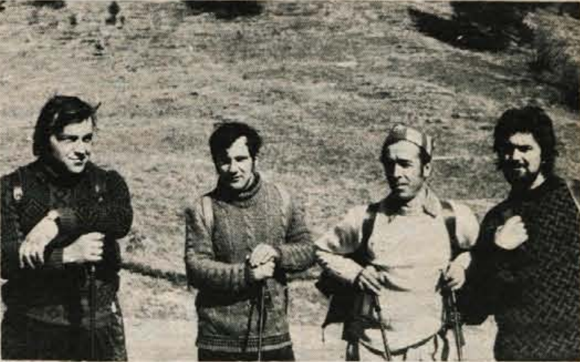
»Vzpon in sestop v takem vremenu sta bila pravi užitek, četudi je bila pot zel poldenela.« so dejali izkušeni planinci z Javornika in Koroške Bele, Kočn in Bleda, ko so se za hip ustavili ob Valvasorjevem domu.

V sicer precej mirnem sobotnem večeru z malo prometa ni bilo kakih posebnih dogodkov; omenimo morda le to, da je skupina postaje milice Kranj ugotovila, da je neki voznik sedel v ukradenem avtomobilu, na Jesenicah pa so ustavili soferja tovornjaka nekega podjetja, ki je uporabljal tovornjak v privatne namene. L. M.