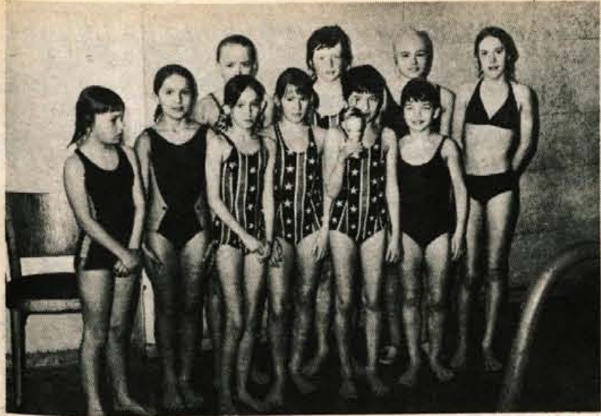
Zmagovalna štafeta 10 x 25 m Vodovodni stolp III.