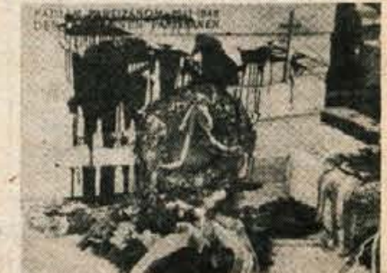
Tak pa je bil partizanski nagrobnik v Žrelcu pri Celovcu po napadu nacističnih barbarov.