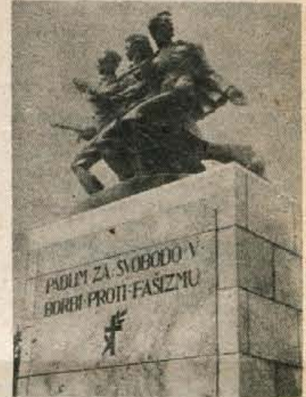
Prvotni partizanski spomenik na velikovškem pokopališču pri Sentrupertu.