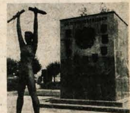
Tako stoji spomenik padlim avstrijskim vojakom na ljubljanskih Zalah — še nikoli oskrujen.