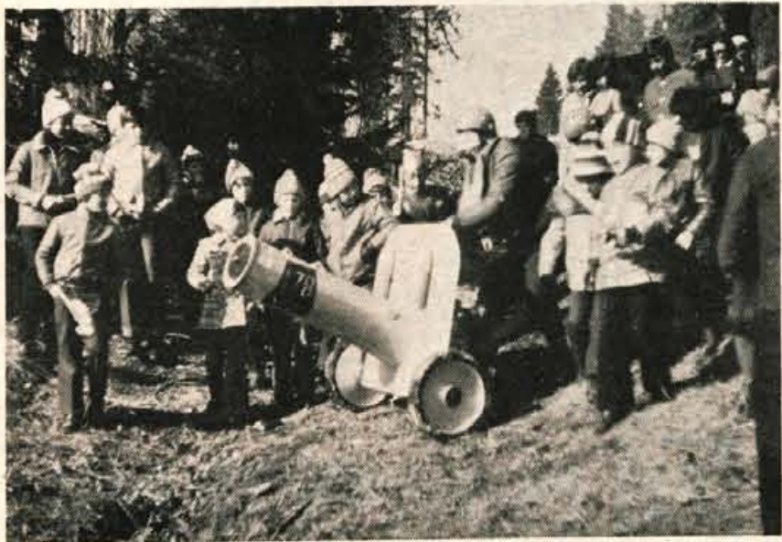
»Snežni top« je kot najbolj aktualna maska prejel prvo nagrado posebne žirije tekmovanja »svinjska glava«.