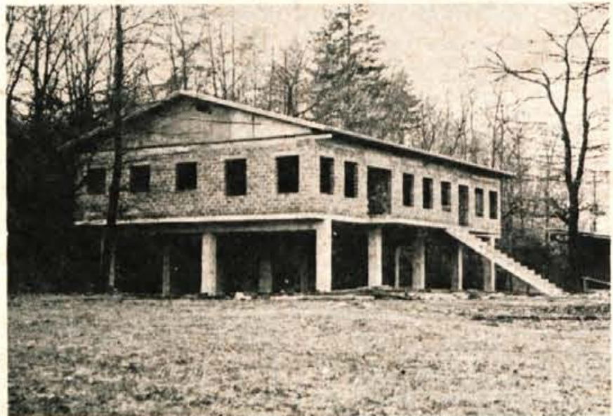
Elan iz Begunj ureja v Kavčah pod Lipcami ob akumulacijskem jezeru pred pregrado hidroelektrarne Moste vodni center. Narediti so že ploščad in skakalnico na vodi, zdaj pa gradijo poslopje za spravilo čolnov in druge opreme. Če bo dovolj denarja, (objekt bo veljal okrog 700.000 dinarjev), bodo z deli končali in opremljen objekt odprli še letos — B. Blenkus

Vendar bo v Lomu neviščnost čez dober mesec odstranjen. Del Spodnjega Loma in Potarje bodo priključili na omrežje elektrogospodarstva Slovenije, omrežje v delu Spodnjega Loma in v Zgornjem Lomu pa bo še naprej napajala zasebna Anžičeva elektrarna. -jk