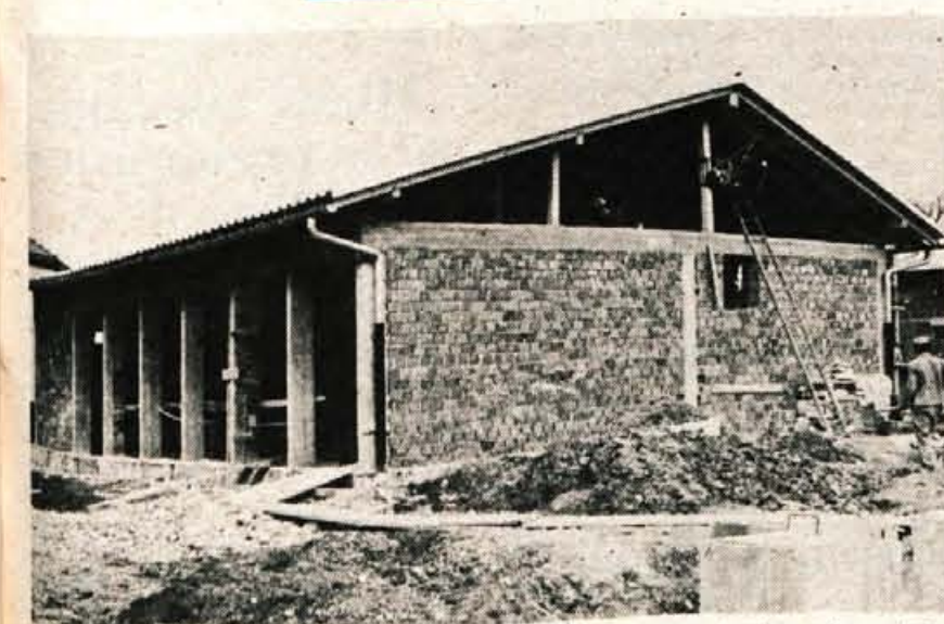
Veletrgovina Loka iz Škofje Loke je v sredini oktobra lani začela pri Sv. Duhu graditi moderno samopostrežno trgovino. V njej bo 94 kvadratnih metrov prodajnih, okrog 40 kvadratnih metrov skladiščnih ter 20 kvadratnih metrov pomožnih prostorov. Gradbena dela so zaupana SGP Tehniku iz Škofje Loke. Trgovina bo predvidoma odprta konec maja. (jg)