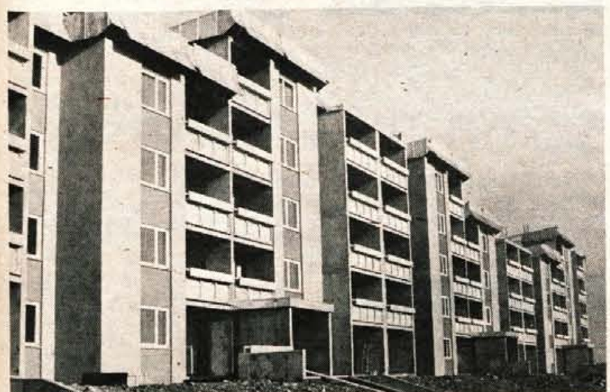
V prvem od načrtovanih blokov v novi stanovanjski soseski na Planini v kranjski občini, kjer bo do leta 1978 zgrajenih 1400 novih stanovanj in dom za samske delavce z okrog 240 posteljami, so v petek razdelili ključe za 12 stanovanj (6 garsonjer in 6 enosobnih stanovanj) iz solidarnostnega stanovanjskega sklada. Preostala stanovanja v tem bloku, kjer so že gotova stanovanja v prvem stopnišču, bodo dobili zaposleni iz delovnih organizacij. — A. Ž.

GLASILO SOCIALISTIČNE ZVEZE DELOVNEGA LJUDSTVA ZA GORENJSKO