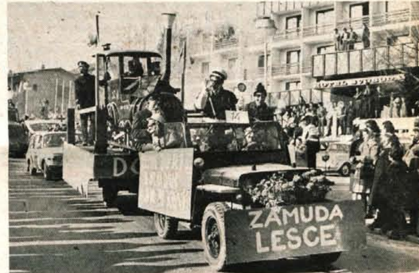
Leščani so si privoščili zamudo na železnici