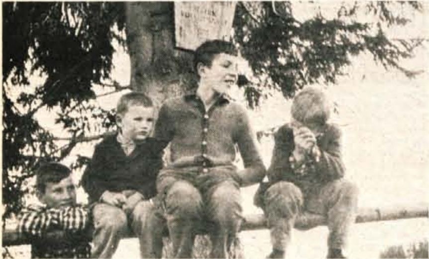
Slovenski dečki iz Kneže