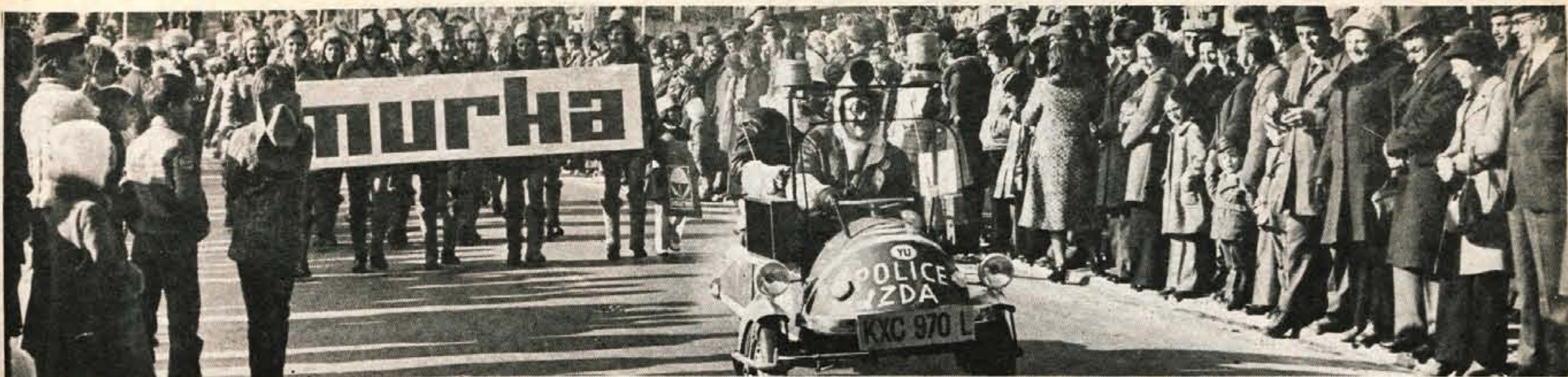
Oj ta norčavi pust. Tudi letos je pokazal vrsto domišlic in »spustile« prenekatero bodico. Nedeljski pustni sprevod na Bledu (od koder je posnetek) je nasmejaj številne domačine in izletnike