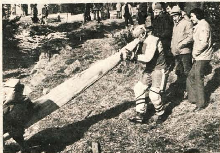
Na prireditvi so bili »na tapingu« tudi jeseniški hokejisti, ki so »presmučali« smuk progo z zelo zelo dolgim nosom.

Tudi Jeseničani in okoličani vsako leto dostojno, verno in zvesto praznujejo in praznujejo pustne dni, najbolj seveda spoštujejo tradicionalno tekmovanje za trofej Svinjska glava. Ob tej priložnosti izvolijo župana Črnega vrha, ki pa bi moral biti presneto dober, da bi ga kritični občani izvolili dvakrat zapored. Običajno je na pustno nedeljo izpostavljen takim kritikam, da se hočeš nočes umakne in prepusti mesto drugemu.