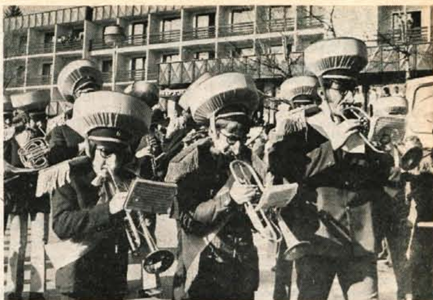
V letošnjem pustnem sprevodu na Bledu so sodelovali tudi godbeniki iz Gorij, Kranja in Lesce. Na sliki: Godbeniki iz Gorij.