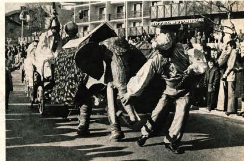
Zamisel o reševanju kmetijstva: združitev krave in slona