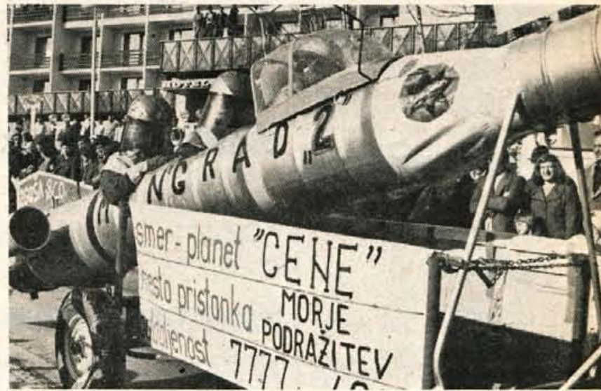
Cene so bile tarča neznanih astronautov