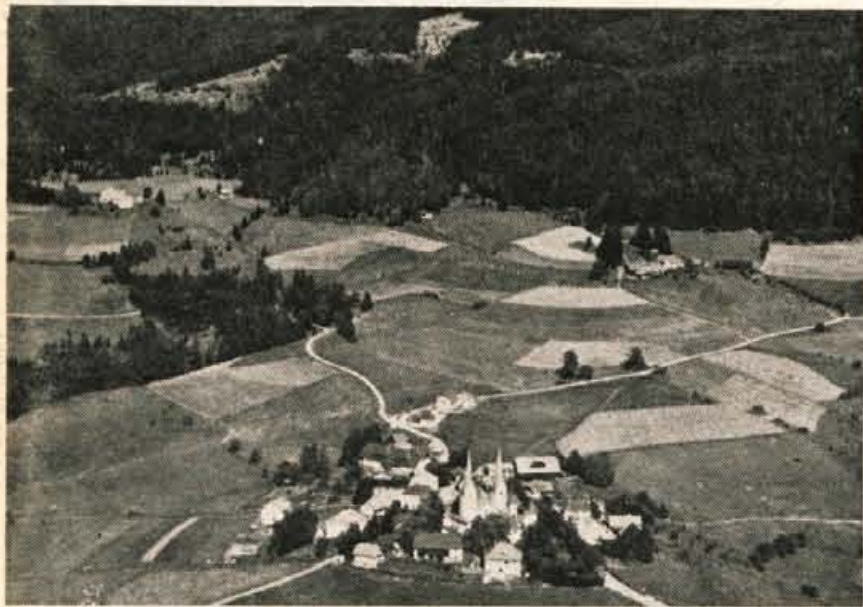
Pogled na Djekše na Svinški planini.