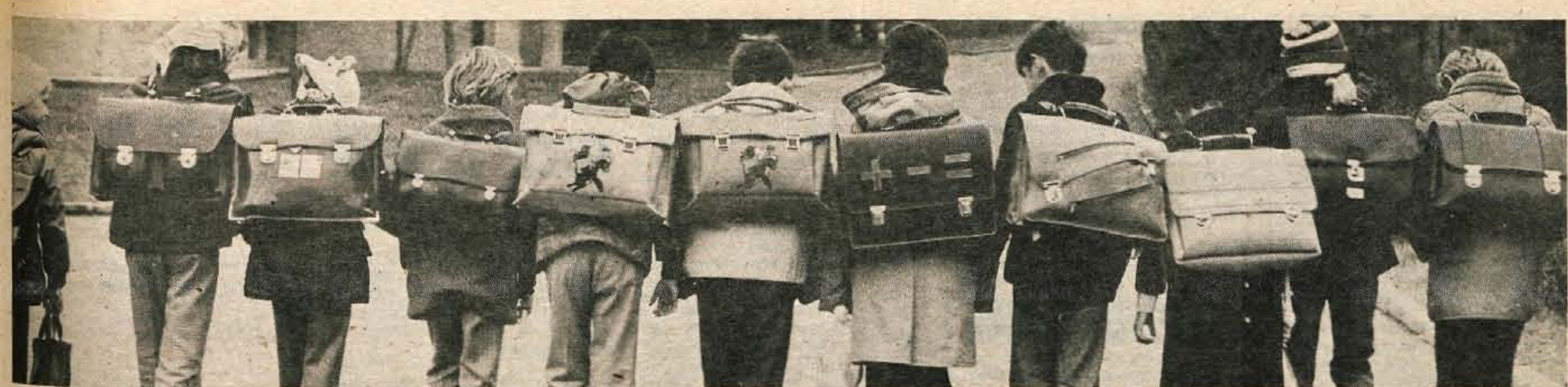
Kar dobro jo stopimo — do doma je še daleč in torbe so težke.