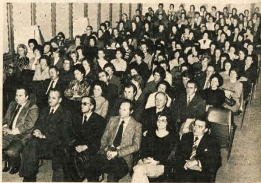
Delavci TOZD Preskrba in gostje na ponedeljkovi prireditvi ob 25. obletnici Mercatorja

Besedilo: J. Košnjek