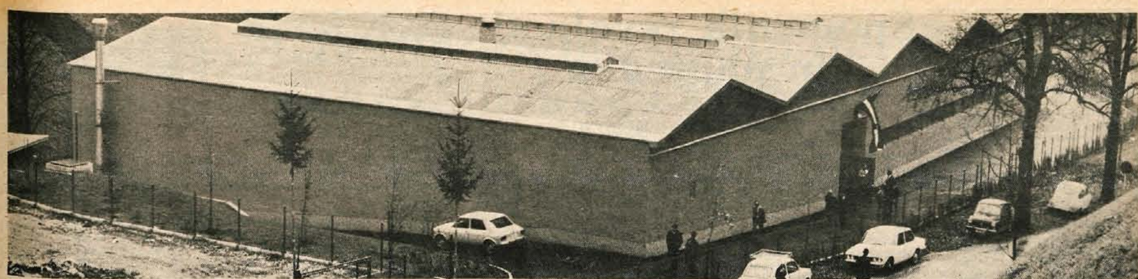
V soboto popoldne so v tovarni vijakov Plamen v Kropi odprli nov proizvodni obrat za čiščenje in vleko žice. Svečana otvoritev je bila hkrati tudi uvod v proslavo 80-letnice obstoja podjetja.