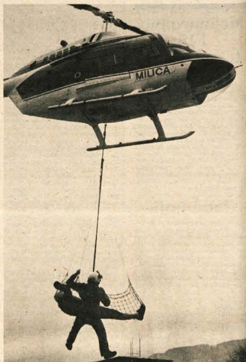
Helikopter republiškega sekretariata za notranje zadeve nese reševalca na mesto nesreče