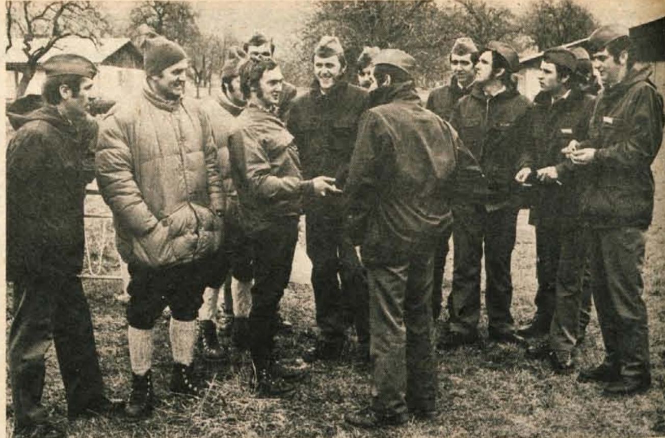
Mličniki in gorski reševalci čakajo na pričetek vaje po uspešnem 8-dnevem tečaju v Lescah, med katerim je helikopter pristal tudi na Kredarici

»Pa še kako sem vesela priznanja. Doslej še nobenega nisem dobila! Na letališču sem se zaposlila leta 1965. Blizu je letališče, razen tega pa sem želela še kaj zaslužiti in obenem popoldne pomagati doma na kmetiji. Na letališču skrbim za čistočo in postiljanje postelj. Pozimi sem bila na Krvaveu. Najprej v brunarici, potem pa v domu. Gori je bilo dela več. Čistila sem, postiljala postelje in še pomagala v kuhinji. Kdaj je bil dan kar prekratek. Na letališču ponavadi začnem ob petih zjutraj, vračam pa se opoldne ali ob enih, po potrebi pa tudi kasneje. Lahko bi že šla v penzijo, vendar bom raje še par let počakala.«