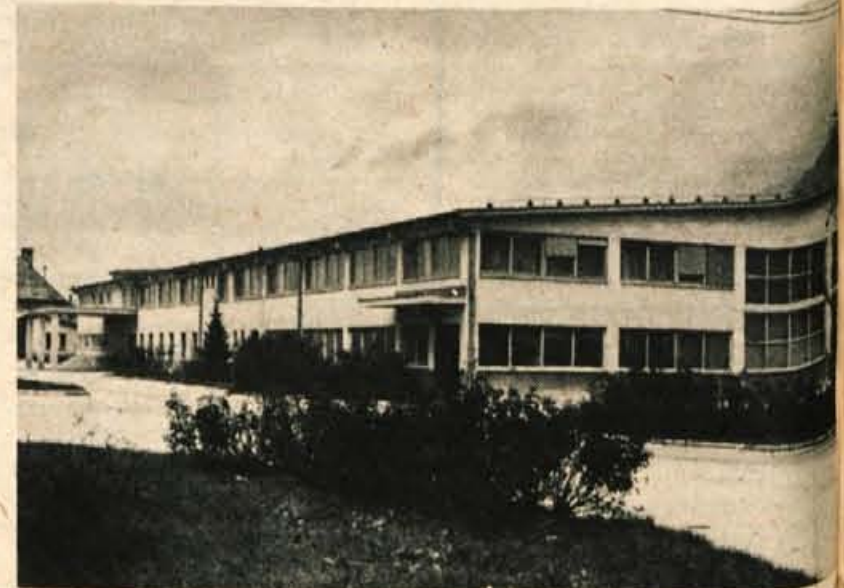
Sukno Zapuže je danes moderna tekstilna tovarna. V njej je okrog 290 zaposlenih.