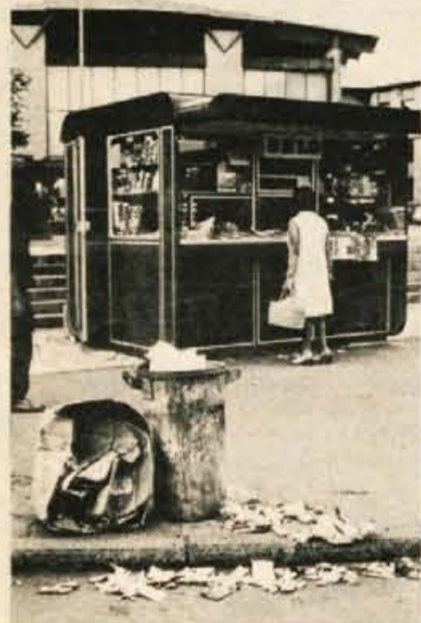
Kranjski turistični zanimivosti