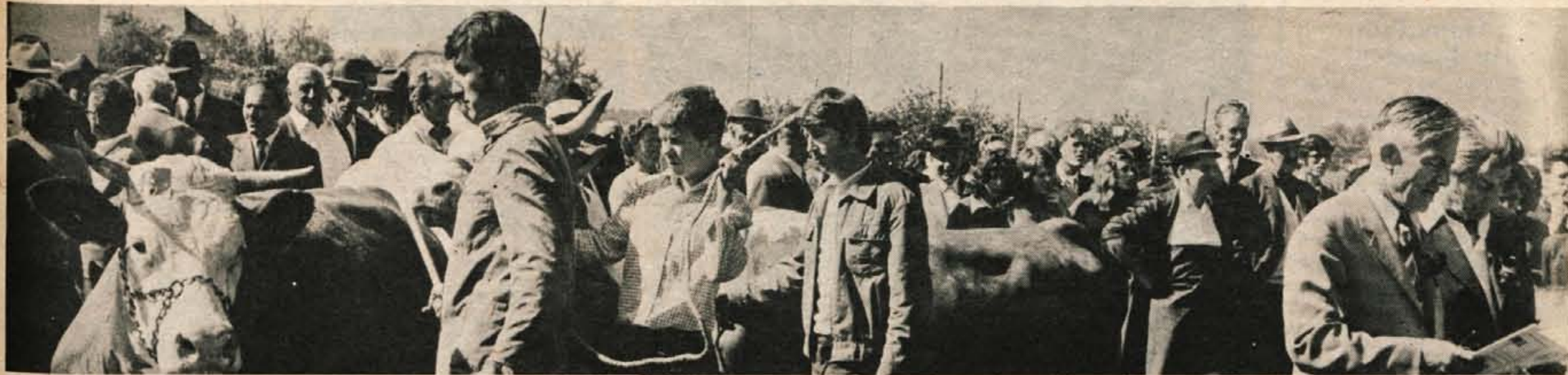
Na nedeljsko razstavo v Žabnici so rejci pripeljali 90 krav in telic svetlolisaste in črno-bele pasme, govodorejci iz Ptuja pa bika Fausta in Pilata