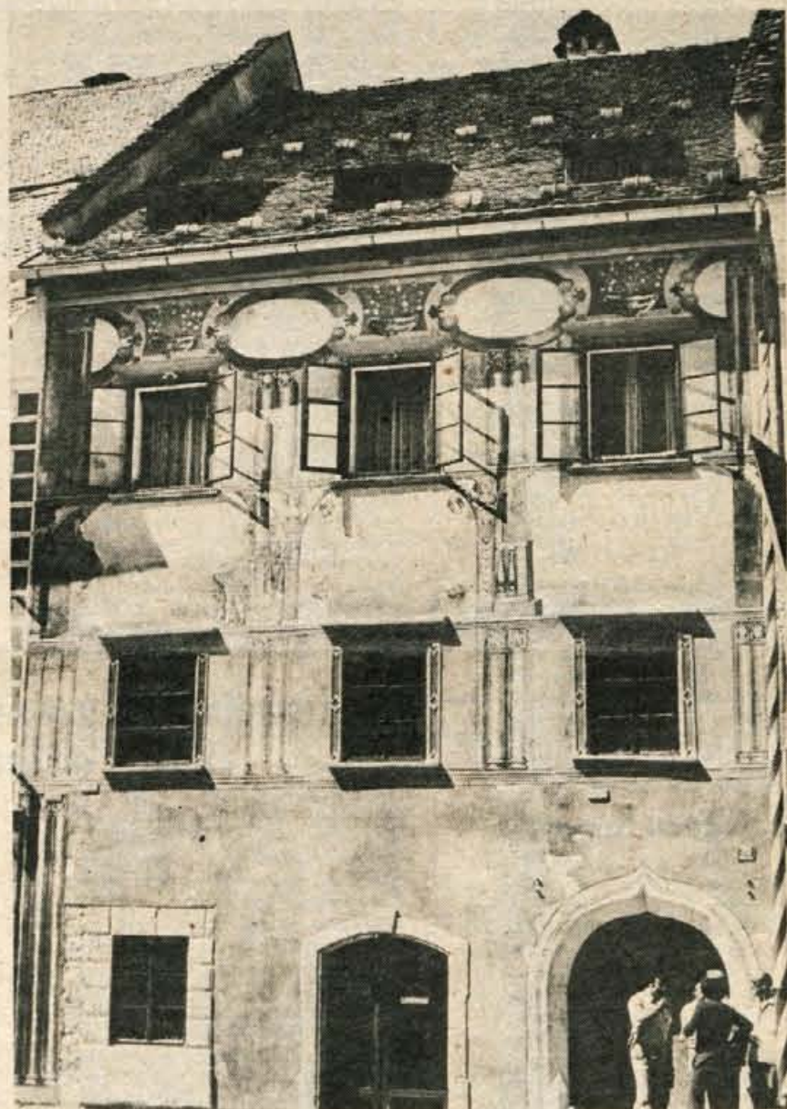
Že nekaj dni si Ločani in številni turisti, ki se te dni mudijo v mestu pod Lubnikom, z zanimanjem ogledujejo obnovljeno zunanost ene od hiš na škofjeloškem mestnem trgu. Strokovnjaki restavratorskega oddelka ljubljanske akademije za likovno umetnost ter zavoda za spomeniško varstvo so namreč restavrirali fresko na pročelju nekdanje mestne hiše — rotovža. Za vse, ki jih zanima nastanek umetnine, bodo Ločani že v kratkem pripravili posebno brošurico z najzanimivejšimi podatki. (—jg)

Občinske konference pa so svoje delegate za kongres izvolile že prej. Kranjska OK bo imela na kongresu 9 delegatov, radovljiško mladino bo zastopalo 6 delegatov, prav toliko jeseniško, tržiško 4 in škofjeloško mladino 5 delegatov. —lb