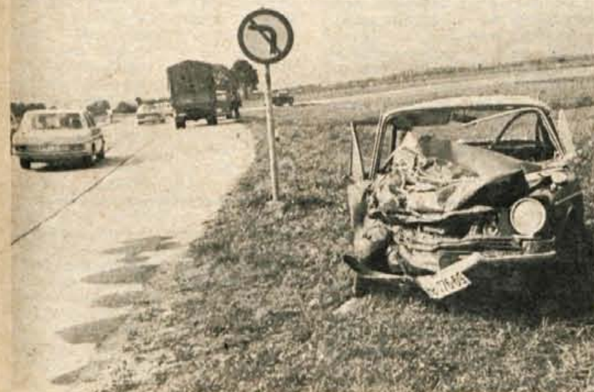
Zaradi neprevidnega pešca, ki je v petek, 23. avgusta, pri radovljiški bencinski črpalki stekel čez cesto, je moral voznik Gracej iz Ruš zavirati, pri tem pa ga je zaneslo v nasproti vozeči avtomobil.