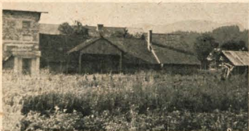
Pravo nasprotje domu TVD Partizan v Źgornjih Gorjah je dom DPD Svoboda Gorje v Spodnjih Gorjah. Dom, če mu lahko tako rečemo, ni nič drugega kot navadna lesena baraka, ki na vseh koncih kaže znamenja hiranja. Ne le zaradi doma, pač pa tudi sicer ne bi bilo odveč, če bi se v Gorjah enkrat kaj več pogovorili o kulturno-prosvetni dejavnosti. — J. Ambrožič

žgance z mlekom, ki jih bodo pripravljali majerji in planšarice. Zvečer bo v gostišču Ob tabornem ognju (pri Milčetu) večerja za vse planšarice in majerje. Poseben planšarski odbor vabi starih običajev željne obiskovalce, da pridejo v nedeljo na Pokljuko. Poskrbljeno bo tudi za ples. A. Ź.