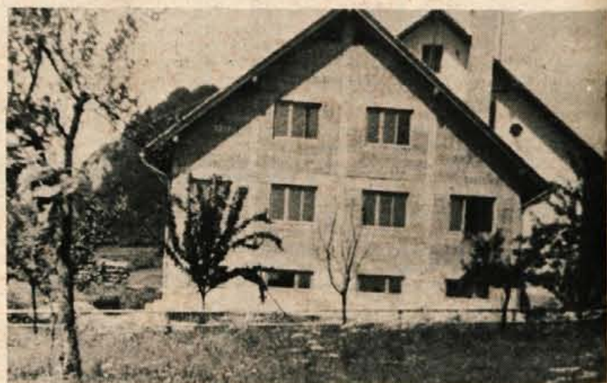
Pri domu TVD Partizan v Zg. Gorjah dogradili prizidek. Za gradnjo so se odločili v društvu. Kmalu bodo opremili tudi prostore v novem delu.

ATLETIKA — Na posamičnem atletskem prvenstvu Slovenije v Mariboru so nastopili tudi atleti kranjskega Triglava. V moških disciplinah se je najbolje uvrstil sprinter Ravnikar, ki je na 100 in 200 m osvojil 2. mesto, v ženski disciplini diska pa je Paplerjeva postala prvakinja SRS, Horvatova je 3., Kladnikova pa 8. Paplerjeva se ponaša tudi z zmago v metu krogle, medtem ko je bila Kladnikova 2. V metu kopja pa je Kranjčanka Kurnikova zasedla 3. mesto. -dh