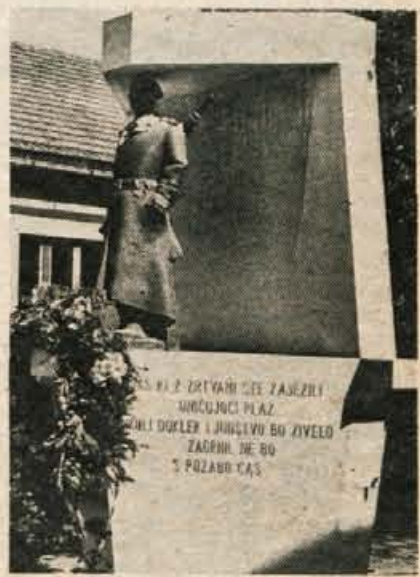
Osrednji spomenik padlim v NOB na Visokem

Stoji pred zadržnim domom na Visokem pri Kranju. Izdelan je iz belega istrskega kamna z vključeno kiparsko kompozicijo, 112 cm visoke bronaste plastike partizana na straži. Celotna višina spomenika je 254 cm, premer pa je 194 cm. V podstavek je vklesan napis: