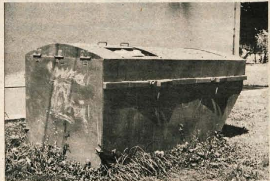
Kontejner za smeti