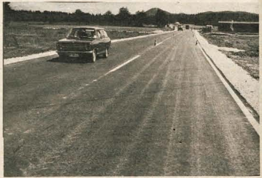
Prenovljen odsek ceste Reteče—Jeprca je že odprt za ves promet. Delavci Cestnega podjetja iz Kranja so položili asfalt na dolžini približno 800 metrov ter širini 7,70 metra. Na obeh straneh pa so uredili bankine v širini 1 metra.

Obiskali smo tudi kopališče, ki so ga nekaj oblegali Ljubljanci. Do Reteč je ob nedeljah iz Ljubljane vozil celo kopalni vlak. Letos gneče na plažah ob Sori ni bilo, malo je na to vplivalo slabo vreme, nekoliko voda, ki ni več tako čista kot je bila nekaj, pa še kak drug vzrok bi bilo