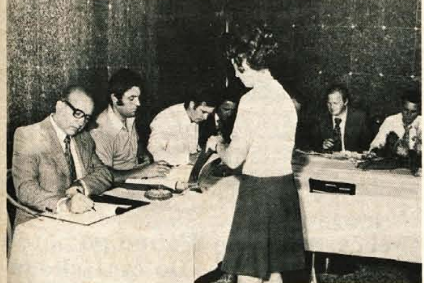
Predstavniki proizvajalcev kmetijskih strojev iz Slovenije (Creina Kranj, Krasmetal Sežana, Metalna Maribor, SIP Šempeter, Tehnostroj Ljutomer, Železarna Štore in Hmezad Zalec) so v petek popoldne v hotelu Creina v Kranju podpisali samoupravni sporazum o združitvi omenjenih delovnih organizacij v sestavljeno organizacijo združenega dela Združena industrija kmetijskih strojev in opreme. Slovesnega podpisa samoupravnega sporazuma so se udeležili tudi predstavniki občinskih skupščin kjer je sedež podjetij, predstavniki republiške gospodarske zbornice in drugi. — A. Ž.

Druga, že nekoliko starejša pobuda, pa je iz osnovne šole v Gorenji vasi. Letos se bo začelo že tretje šolsko leto, ki staršem ne prinaša skrbi, kje kupiti šolske knjige. V šoli so namreč uvedli zamenjavo šolskih knjig. Učenci konec šolskega leta oddajo svoje knjige in že takoj prejmejo druge — sicer rabljene — za višji razred. Zamenjave šolskih knjig so bile letos nekaj povsem običajnega že na vseh šolah v škofje-loški občini in nekaterih šolah v radovljiški in kranjski občini. Vendar ta zamenjava, ki so jo podprle tudi temeljne izobraževalne skupnosti in zavod za šolstvo v Kranju, še nima takšnega obsega, kot bi si ga zaslužila. O njej naj bi več razmišljali v novem šolskem letu. L. Bogataj