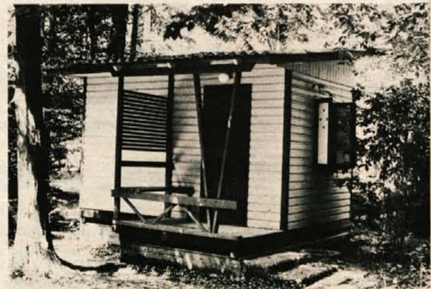
Prijetne počitniške hišice so postavljene med drevjem nad kopališčem ob reki Sori.

Kokra v avgustu — Kokra v avgustu — Kokra v avgustu