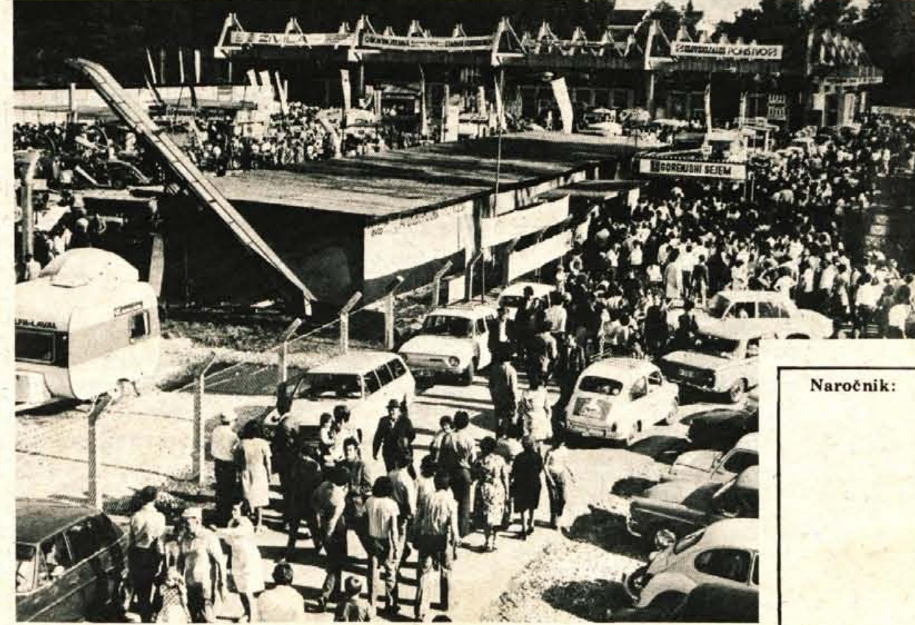
V Kranju so sinoči zaprli XXIV. mednarodni Gorenjski sejem, na katerem je 11 dni 280 razstavljalcev, od tega 80 iz 11 tujih držav, razstavljalo in prodajalo pohištvo, gospodinske stroje, tehnične predmete, tekstil, razne obdelovalne in kmetijske stroje, gradbeni material, motorna vozila in drugo blago. Zanimanje za letošnji sejemski prireditelj je bilo veliko doma in v tujini. Sejem si je ogledalo okrog 150.000 obiskovalcev, razstavljalci pa so po nepopolnih podatkih zabeležili za okrog 110 milijonov novih dinarjev prometa. Največji obisk so na sejmju zabeležili v četrtek, ko si ga je ogledalo okrog 20.000 obiskovalcev. Obisk na sejmju bi bil najbrž še večji, če v zadnjih dneh ne bi bilo tako vroče. — A. Ž.