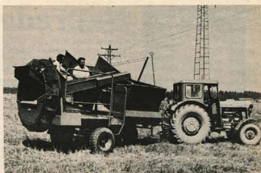
Kmetijsko živilski kombinat Kranj, TOZD Komercialni servis — enota Agromehanika, ki je letos na mednarodnem Gorenjskem sejmu razstavljal in prodajal različne kmetijske stroje, je v nedeljo dopoldne pripravil tudi demonstracijo s kombajni za krompir. Različne kombajne za krompir si je na zemljišču KZK na Zlatem polju ogledalo precej kmetovalcev. — A. Ž.

Direkcija tudi obračunava premijo za mlado pitano živino v višini 1,50 dinarja za kilogram žive teže kot je to določeno v zveznem odloku. Premije bodo plačali tudi za že odkupljeno živino vsem organizacijam in kmetom z urejeno dokumentacijo. Premijo direkcija izplačuje prek živinorejske poslovne skupnosti. -lb