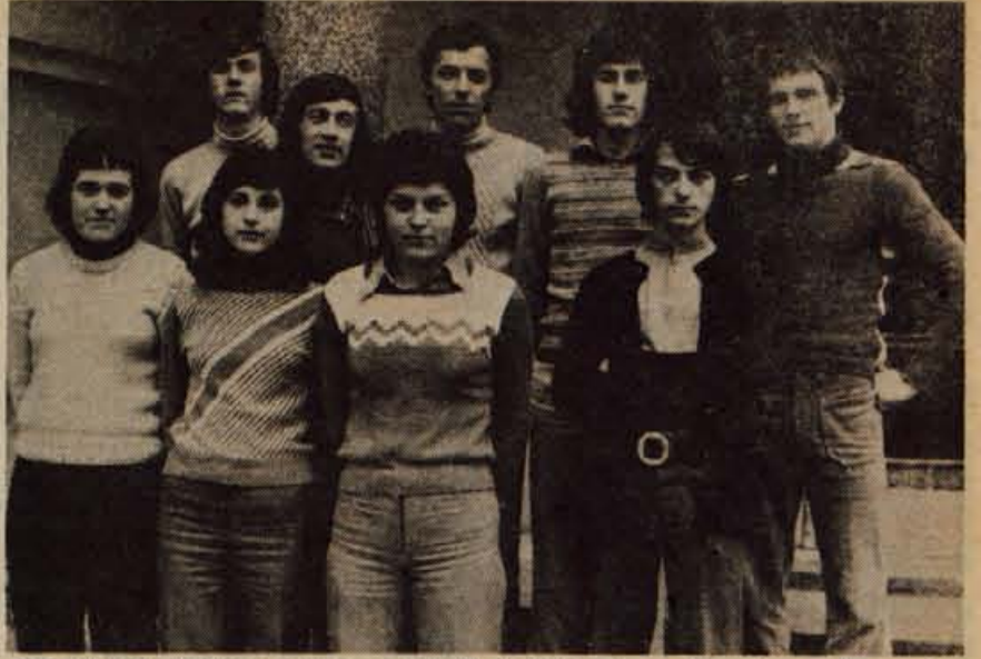
Z letošnjim šolskim letom so na škofjeloški gimnaziji ustanovili poseben smučarski oddelek. Vanj so vključili 13 dijakov iz vseh razredov, ki se aktivno ukvarjajo z zimskim športom in so člani enega od smučarskih klubov. Dijaki, ki so vpisani v oddelek, lahko odhajajo na treninge in tekmovanja tudi v času pouka. Profesorji in razredna skupnost redno spremljajo njihov uspeh in jim pomagajo nadoknaditi zamujeno. Oddelek je zamelek prave smučarske gimnazije, ki bo na škofjeloški gimnaziji zaživela jeseni. Septem- bra bodo vpisovali dijake v prvi letnik. (lb)