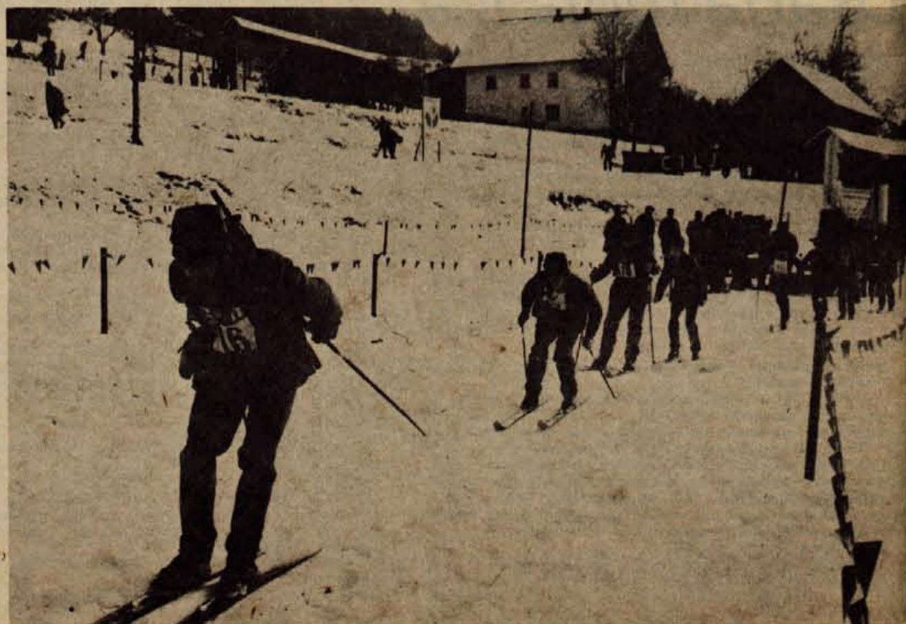
Pravo malo presenečenje na nedeljski tekmi »Po stezah partizanske Jelovice« v Dražgošah je pripravila PE S0 Kranj, ki je v patroljem teku partizanskih enot med šestnajstimi moštvi zasedla odlično tretje mesto.