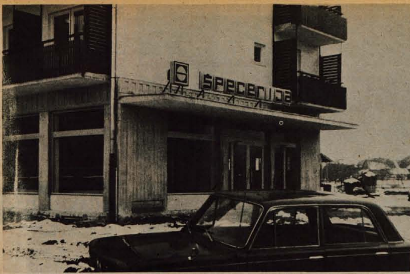
Veletrgovina Špecerija Bled bo v petek ob 16. uri v Finžgarjevi ulici v Lescah odprla novo samopostrežno trgovino z bifejem.