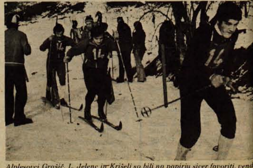
Alplesovci Grašič, L. Jelenc in Krišelj so bili na papirju sicer favoriti, vendar tudi bron zanje ni neuspeh.