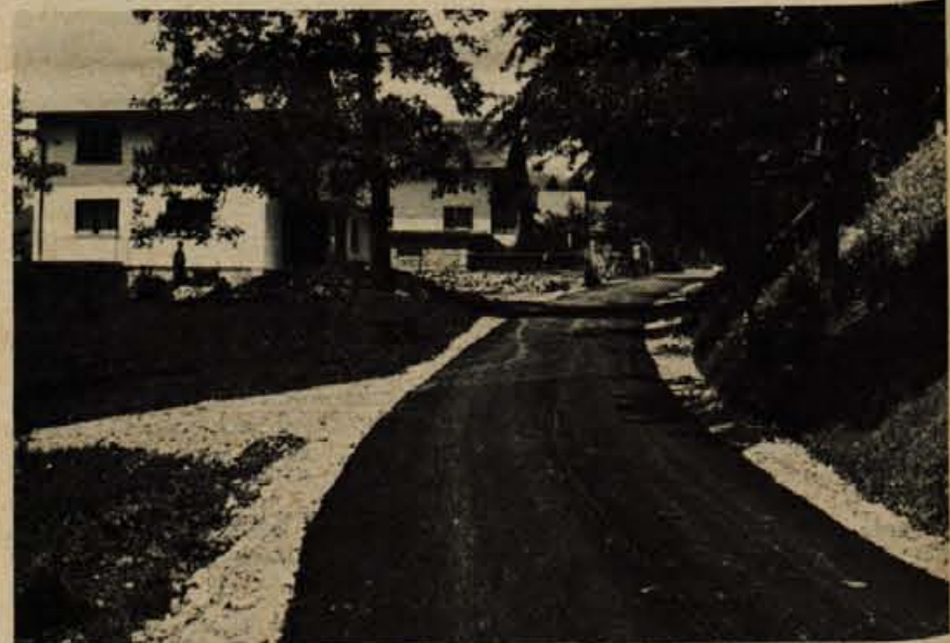
Minuli teden je Cestno podjetje iz Kranja začelo v Olševku v krajevni skupnosti Visoko asfaltirati cesto skozi vas. Prebivalci so sami zbrali 155.000 dinarjev, s prostovoljnimi delom pa so uredili kanalizacijo in opravili še nekatera druga pripravljala dela. V akcijo za asfaltiranje ceste se je vključila tudi krajevna skupnost, ki je s Cestnim podjetjem podpisala pogodbo o kreditiranju. Asfaltna preveka v Olševku je dolga okrog 1300 metrov. — A. Z.

sejo je pripravil republiški sekretariat za kmetijstvo in gozdarstvo. Izvršni svet je podprl spremenjen način mlečne proizvodnje na družbenih posestvih, ki ni več toliko odvisen od nakupa krme. Mlečna proizvodnja tudi ne bi smela biti več obremenjena s splošnimi stroški. Prav tako bi kazalo doseči večjo povezavo med mlekarjami in mlečnimi farmami. 10 milijonov republiškega denarja bomo potrošili za pomoč pri vzreji visokokvalitetnih plemenskih telic, 23 milijonov dinarjev pa za kreditiranje družbene mlečne proizvodnje. Pri delitvi državnega kapitala po občinah morajo priti do veljave tudi potrebe kmetijstva in z njim proizvodnja mleka.