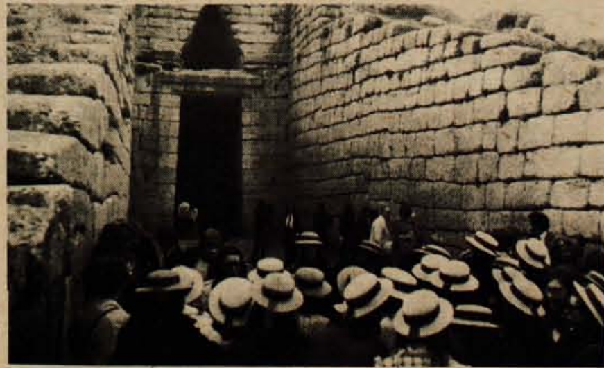
Pred Atrejevo grobnico smo se spet srečali z učenci iz Ugande. Vodnica te skupine je imela dober pregled nad svojo »čredico«: značilnih klobučkov deklet nisi mogoče zgrešiti.