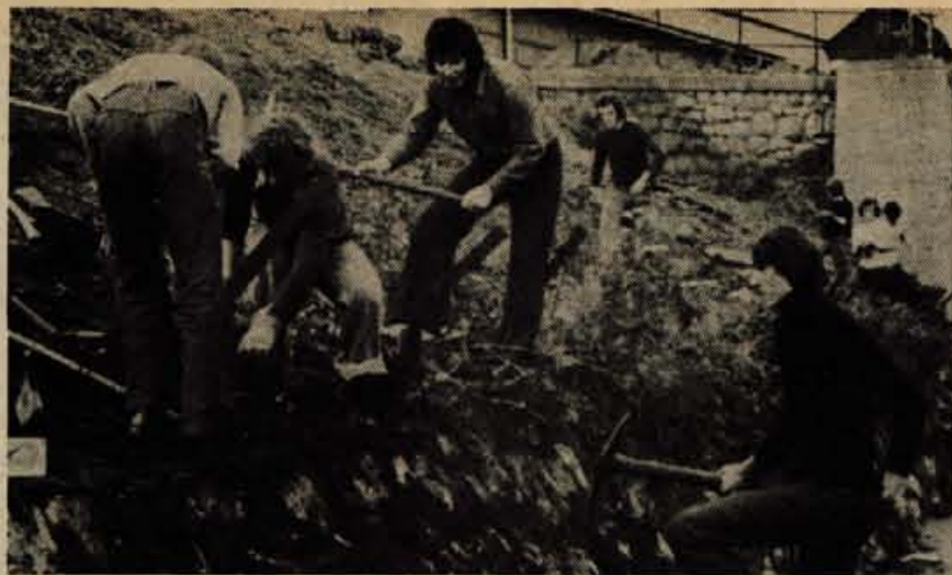
Mladinci jeseniške občine so v akciji za zbiranje sredstev za dom v Kumrovcu zelo prizadevni. Kot smo že poročali, s prostovoljnim delom urejajo pobočje železarnice ob glavni cesti med Javornikom in Jesenicami. Predvidevajo, da bodo svojo obvezo izpolnili do konca junija. — B. Blenkuš

Na Graški gori, prizorišču zmagovitega preboja 14. divizije je bil v nedeljo velik zbor slovenskih in hrvaških pionirjev. Pripravila ga je Zveza prijateljev mladine, da bi na področjih gore jurišev obudila spomin na junaštvo borcev stirinajste divizije.