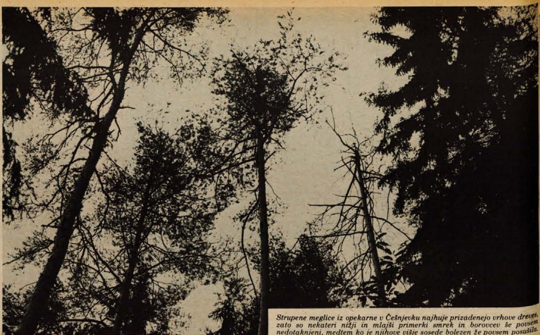
Strupene meglice iz opekarne v Češnjevku najhujše prizadenejo vrhove dreves, zato so nekateri nižji in mlajši primerki smrek in borovcev še povsem nedotaknjeni, medtem ko je njihove višje sosedne bolezni že povsem posušila.

Ponudbe pošljite na Kom- unalni servis Kranj, Mladinska 1 — odbor za medsebojna razmerja skupnih služb.