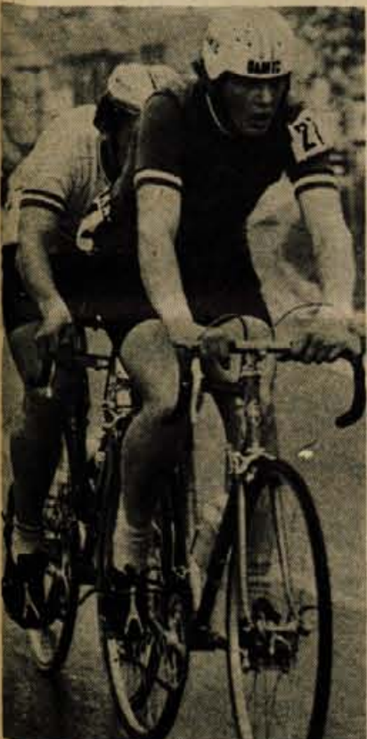
To je dokazal na sobotni dirki veteranov v Ljubljani, kjer je zmagal kot poročajo Sportske novosti v stilu Edija Merckxa, saj je v cilj pripeljal