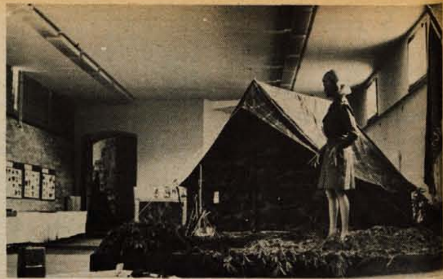
Na razstavi, ki so jo loški taborniki pripravili ob 20-letnici obstoja svoje organizacije, si imajo obiskovalci priliko ogledati tudi miniaturni tabor.