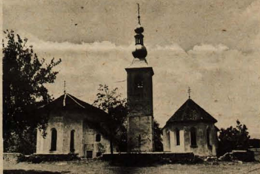
Cerkev sv. Katarine (desna) in sv. Radegunde v Srednji vasi pri Šenčurju

Kredit do 15.000 din brez porokov odobrimo takoj. Dostava brezplačna.