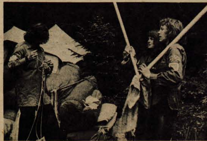
Taborenje je končano in treba je bilo pospraviti opremo