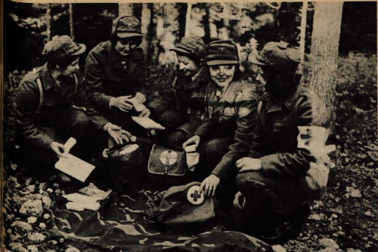
USPELE VAJE PARTIZANSKE ENOTE — S partizanskim mitingom so se končale v nedeljo na Jezerškem večdnevne vaje enot Kokrškega partizanskega odreda. Pripadnike enote so pozdravili predstavniki krajevne skupnosti, odbora za splošni ljudski odpor in komandant odreda. Mladinci pa so pripravili krajši kulturni program. Na vaji so pripadniki partizanske

enote utrdili že pridobljeno znanje in ga obogatili z novimi dosežki strategije in taktike ter se seznanili z orožjem. Razen tega so se »partizani« medsebojno spoznali in navezali s prebivalci Jezerškega, ki so jih nad vse tople sprejeli, nova znanstva. Na fotografiji ekipa bolničark. (jk)