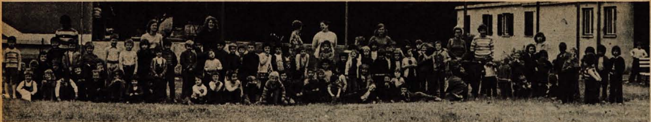
POZDRAV Z MORJA— Otrci iz gorenjskih vrtcev, ki so na letovanju v Pineti pri Novigradu, pozdravljajo mamice, očke, svoje vrstnike in tovarišice, ki so ostali doma, in jim sporočajo, da jim dnevi hitro minevajo, da se jim sonce skriva, da jih valovi morja škropijo, ko na sprehodih spoznavajo obalo in njene zanimivosti. — K. G.

Razburjenje, protesti in škoda zaradi obvoznice