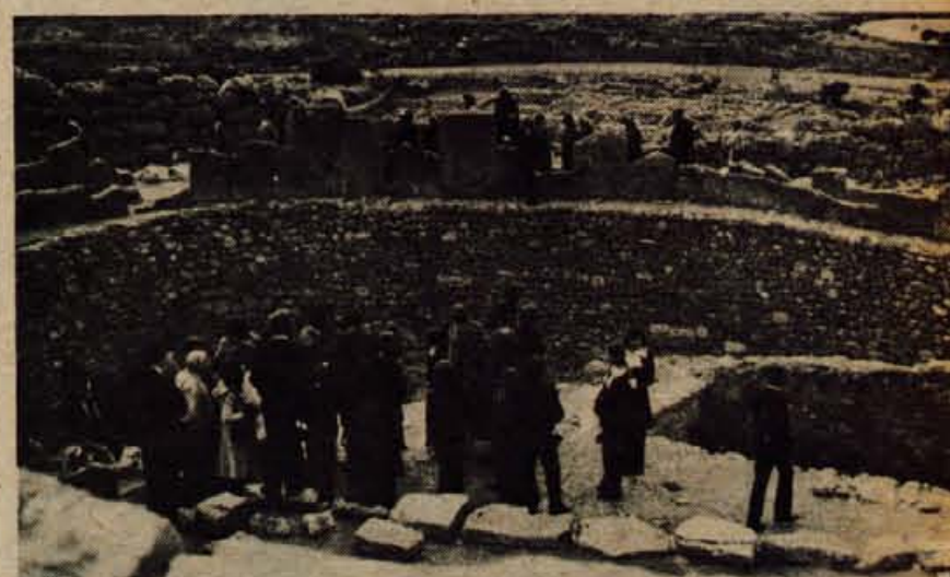
Pred Atrejevo grobnico smo se spet srečali z učenci iz Ugande. Vodnica te skupine je imela dober pregled nad svojo »redico«: značilnih klobučkov deklet nisi mogel zgrešiti.

Najprej se povzpnejo v Atrejevo zakladnico. Dohod je vsekan v zemljo in steni, ki se proti vходу dvigata, sta obloženi s kamni. Plošči nad vhomom sta pravi velikanki: po tri metre sta široki, po dobrih osem metrov dolgi, dober meter visoki in tehtata nič manj kot 120 ton vsaka. Znotraj te preseneti mogočna visoka kupola: kot nekakšna piramida je videti, le da je ta gradnja okrogla. Predvidevajo, da je bila tu grobnica, prostor zraven pa zakladnica. Svetloba prihaja le od vhoda, sosednji prostor pa je povsem