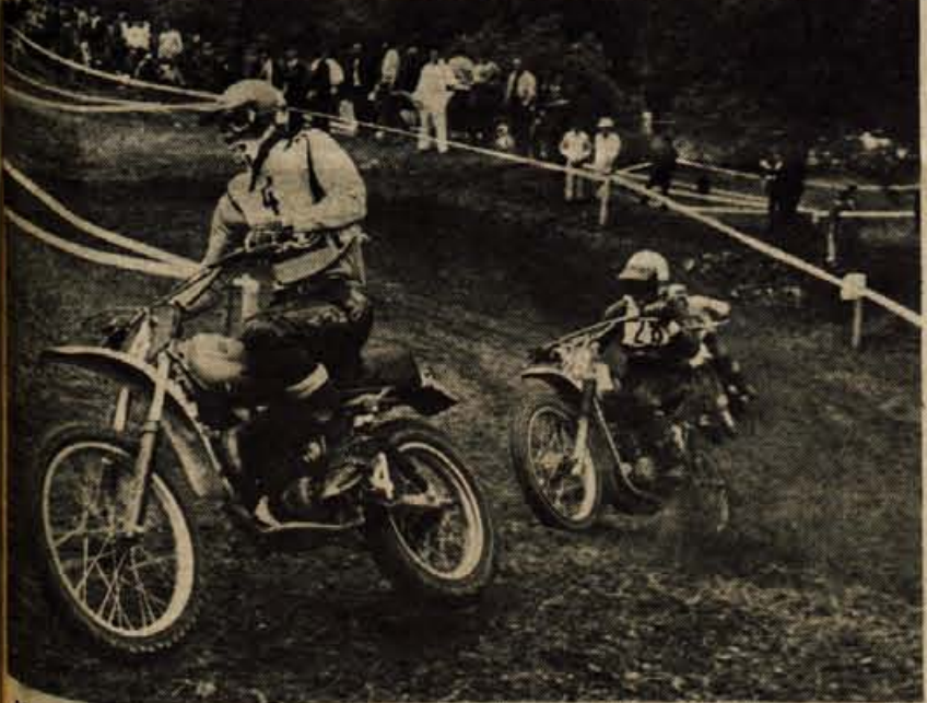
Na nedeljski dirki v motokrosu za svetovno prvenstvo v Podljubelju so nastopili dirkači iz devetih držav in navdušili več kot 10.000 gledalcev. — Počitalo z dirke na 10. strani.

Tako sedanji zakon o varnosti v cestnem prometu kot tudi novi zakon, ki bo začel veljati jeseni, še posebej poudarjata pazljivost ob navzočnosti otrok na cesti, starih ljudi in invalidnih oseb. Dolžnost voznikov motornih vozil je torej, da ne upoštevajo le svojih pravic o prednosti, tam kjer jo imajo, pač pa da so pozorni na otroke in ostale pešce tudi tam, kjer pešci posebnih prednosti, kot so prehodi, nimajo. Marsikatero življenje ali pa vsaj poškodbo je že rešil premišljen gib pozornega voznika, ki je vozil mimo gruče otrok počasneje in z nogo na zavori.