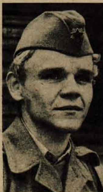
»Še najbolj nam je ponagajal dež,« je v soboto dopoldne povedal

Mladi partizani, združeni v odred Jožeta Gregorčiča, so se zbrali na Taležu v petek opoldne. Po kosilu so se lotili postavljanja šotorov. Ko so nekako napol opravili delo, so se prvič srečali s pravim partizanskim življenjem. Nad Jelovico so se privalili oblaki in ulilo se je kot iz škafa. Mladi partizani, nekateri med njimi tudi ne najbolj pripravljeni za nenaden pljusk, so bili na mah premočeni do kože. Vendar jih dež ni kaj dosti zmotil. Zvečer, ko so jih obiskali predstavniki občinske skupščine in občinskih družbenopolitičnih organizacij, so se ogreli in osušili ob tabornem ognju. O narodnoosvobodilnem boju jim je govoril Tone Svetina, potem pa je vsak bataljon pripravil 20-minutni kulturni program. Vmes so iznad smrek od časa do časa švigile rakete, nekje v notranosti pa so se rezko oglašale strojnice. Bil je pravi taborni ogenj, ki je zamrl s partizansko pesmijo.