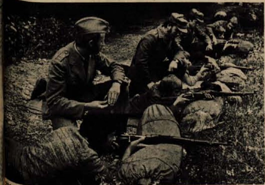
»Učencev se je v soboto dopoldne pomerilo tudi v streljanju z vojaško puško