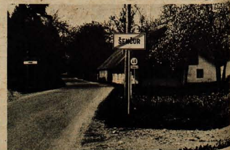
Znak, ki označuje konec naselja Senčur, stoji 250 m prekmalu, saj nosi deset hiš za znakom hišne tablice z nazivom Pipanova cesta. Občani tega dela Senčurja se pritožujejo, ker so jih kar naenkrat začeli prištevati med Srednjevaščane.