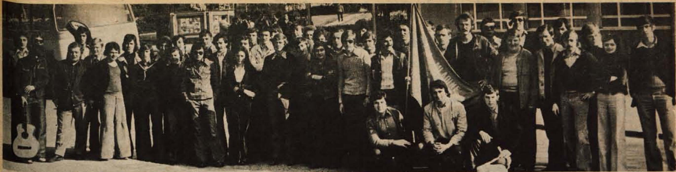
V soboto je odpotovala na Kozjansko gorenjska mladinska delovna brigada.