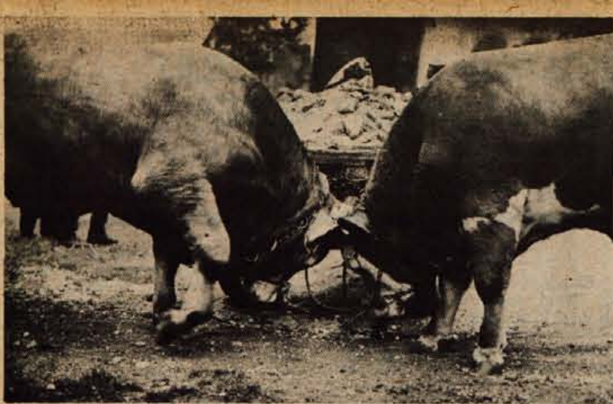
Gornji posnetek še zdaleč ni iz Španije kot bi prvi hip kdo utegnil pomisliti. »Bikoborbo« brez toreadorjev je naš fotoreporter France posnel precej bliže — v Gorenji vasi v Poljanski dolini. Rejena bika sta najbrž odločala, kdo bo prišel mesarjem v roke prvi! (—jg)