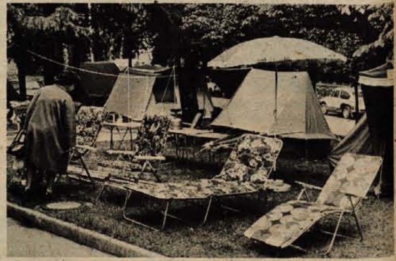
Razstava opreme za taborjenje in rekreacijo je v škofjeloški NAMI že dobila svojo tradicijo. Tudi letos so na zelenici pred trgovino razpeli platnene strehe in vse polno novega imajo, pravijo, za udobne in obnem najcenejše počitnice.

Komisija bo sedaj podrobneje izdelala svoj predlog. Se prej ga bo seveda morala uskladiti z gozdnim gospodarstvom, lovci in drugimi interesi na tem območju. Svoje mnenje pa bo morala povedati tudi radovljiška občina, saj leži košček bodočega parka že na njenem ozemlju.