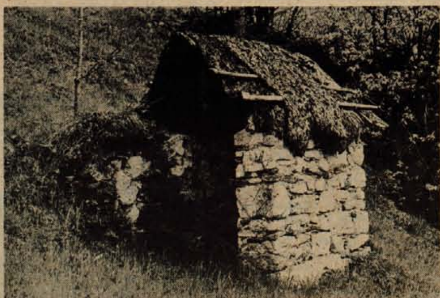
Sušilnica lanu na Šturmovi domačiji na Tičem brdu se danes ne uporablja več.