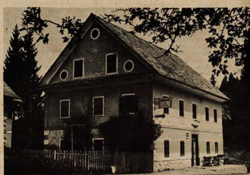
Gostilna »Pri Vilčku« na Kladju je vedno dobro obiskana.