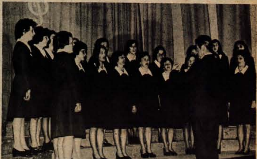
REVILJA PEVSKIH ZBOROV — V dvorani krajevne skupnosti Bukovica — Senkov turn v Utiku je bila v soboto revija pevskih zborov v počastitev krajevnega praznika, na katerem je nastopilo kar osem zborov s 185 pevci. Na posnetku nastop ženskega pevskega zbora KUD »Oton Zupančič« iz Sore.