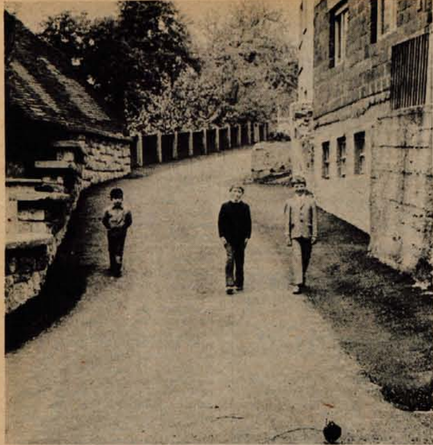
Do pred kratkim so bile na Jesenicah vsekakor najslabše ceste in poti v najstarejšem delu na Murovi. Zato je skupščina občine Jesenice že lani predvidela potreben denar za njihovo ureditev. Delavci podjetja Kovinar Jesenice so najprej uredili spodnji ustroj cestišč, prejšnji in ta teden pa so delavci Cestnega podjetja Kranj položili na Murovi tudi asfaltno prevleko. — B. B.