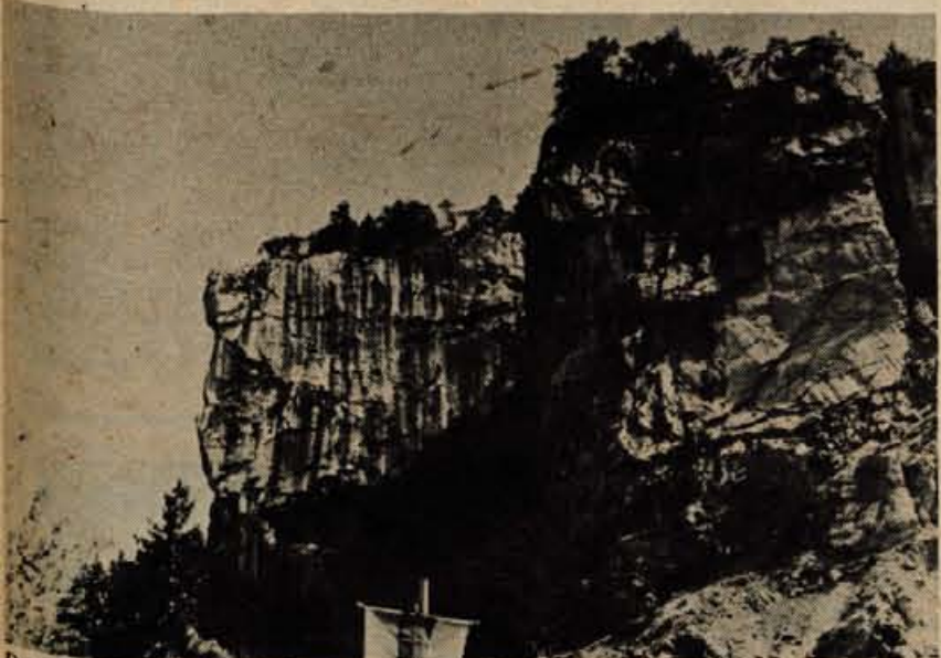
Detajl iz prvega Koroškega plezalnega »stadiona«: za navadne smrtnike grozljivo, za alpiniste pa izredno privlačno.

Dokler Slovenci ne dobimo podobnega središča, bodo tja hodili občasno trenirat tudi naši alpinisti in gorski reševalci