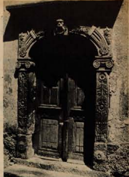
Portal pri Jožkovcu v Podplečah — tu je bila nekdanja gostilna — nosi letnico 1866!

pošta vedno v prave roke, poštar prihaja na Kladje le vsak drugi dan, da je vsako jutro zbrano mleko, ki ga kamion odpelje prek Cerkljanskega vrha.