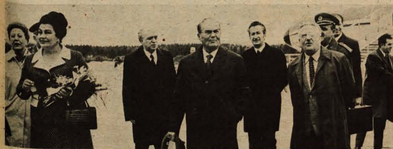
Prejšnji terek malo pred dvanajsto je predsednik Tito prispel na brniško letališče, kjer so ga pozdravili najvišji predstavniki republike Slovenije in kranjske občine. (Poročilo z obiska objavljamo na 2. strani)

GLASILO SOCIALISTIČNE ZVEZE DELOVNEGA LJUDSTVA ZA GORENJSKO