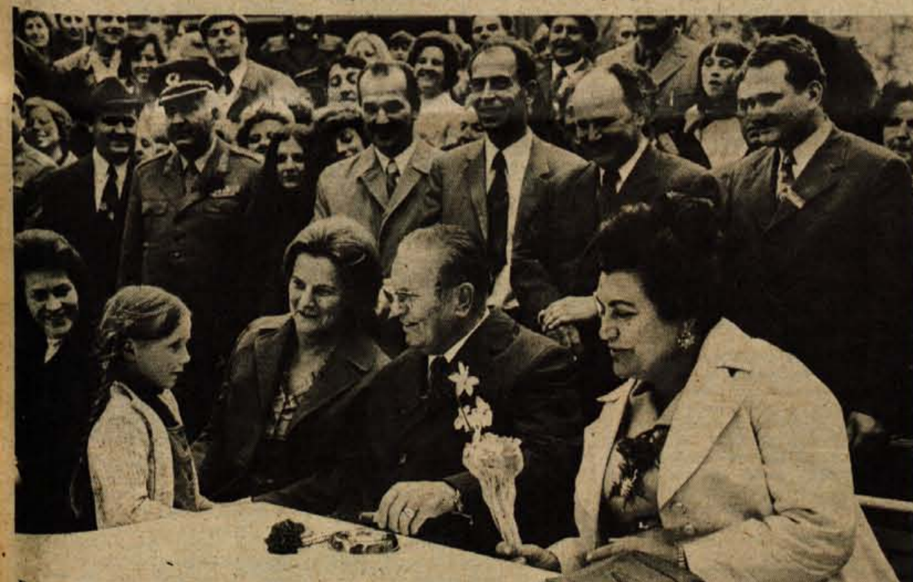
Po kosilu so gostje posedeli na vrtu