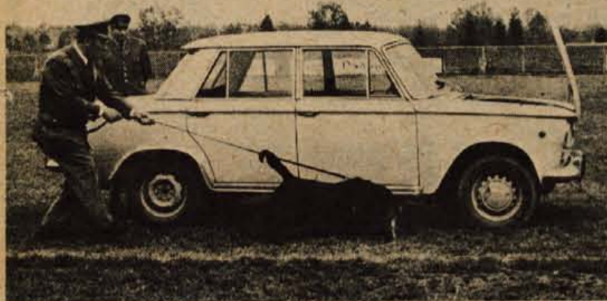
Posebej izšolan pes, labradorske pasme Zektas je na kranjski prireditvi nazorno pokazal, kako zna najti marvilo skrita v avtomobilu. Te vrste psi so še posebej dragoceni pomočniki na mejnih prehodih, saj je njihova sposobnost zaznati vonj po mamilih že marsikateremu tihotapcu prekrizala račune.