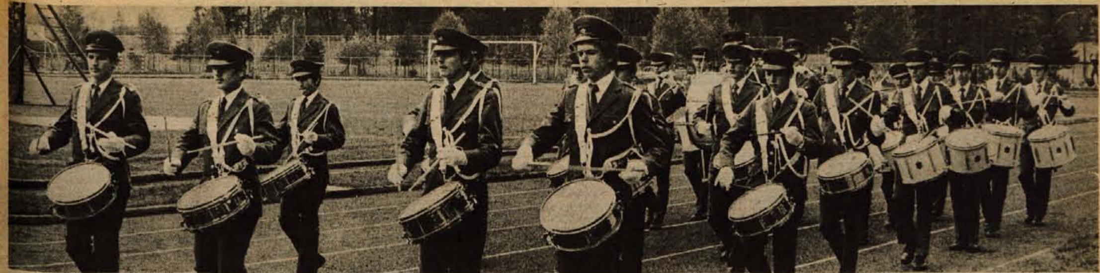
Na Stadionu Stanka Mlakarja v Kranju je bila v ponedeljek popoldne prireditev v počastitev dneva organov javne varnosti. Več s prireditve na zadnji strani.