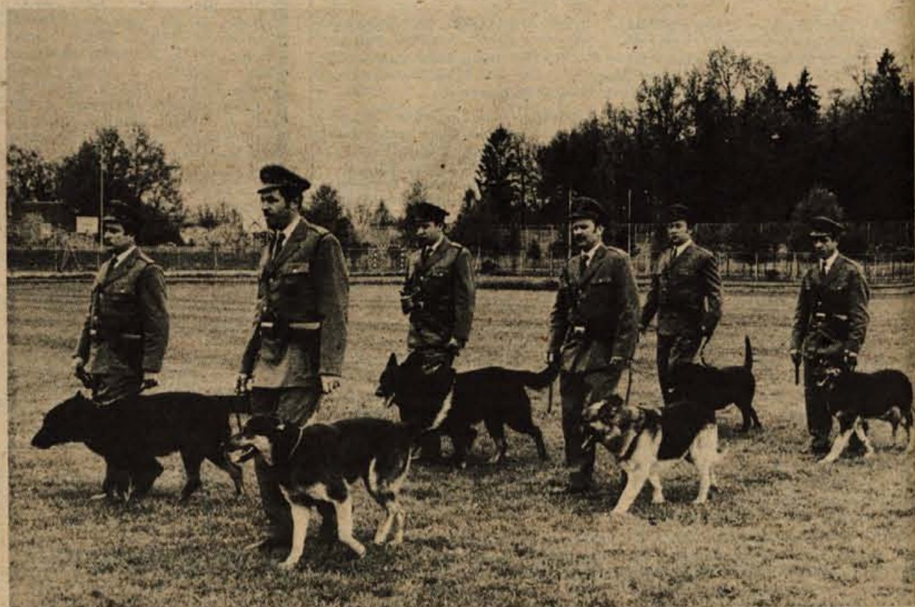
Brez službenih psov teh štirinožnih človekovih prijateljev bi bila marsikatera naloga v službi varnosti težje izvedljiva. Na prireditvi v Kranju so se predstavili občinstvu vodniki s svojimi psi iz Velikih Lašč, Kungote, Celja in Ljubljane.