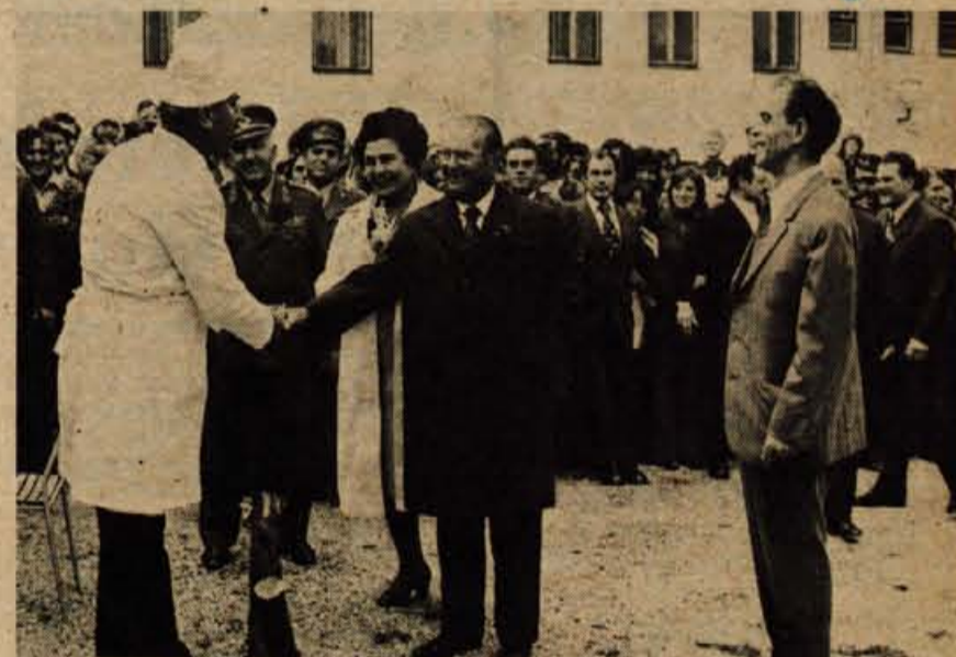
Nazadnje so gostje pri kuharju Jovotu poskusili še pečeno jagnje