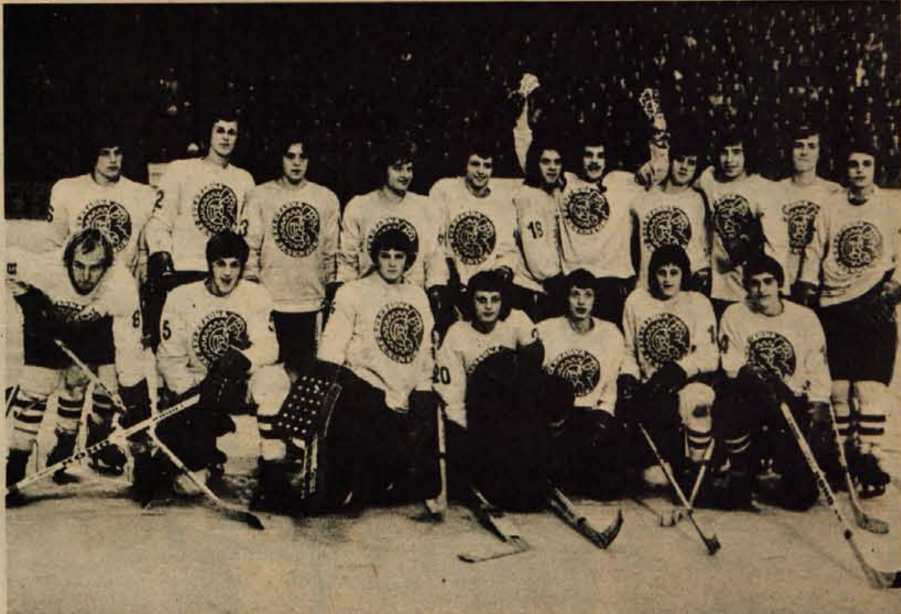
Mladinsko hokejsko moštvo Kranjske gore je letos osvojilo državni in pokalni naslov.

NAMIZNI TENIS — Končano je tekmovanje v II. zvezni namiznoteniški ligi — zahod. Namiznoteniškim igralcem kranjskega Triglava ni uspelo, da bi se obržali v ligi. V predzadnjem kolu jih je premagala Lokomotiva, v zadnjem pa Premium. Izidi: Triglav : Lokomotiva 1:5, Triglav : Premium 2:5. dh