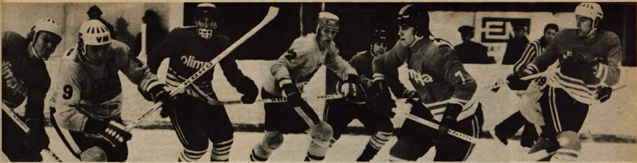
Jutri se bo v Hali Tivoli v Ljubljani začelo letošnje svetovno hokejsko prvenstvo skupine B. Našim želimo obilo uspehov.