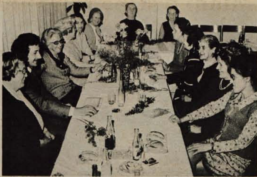
Za letošnji dan žena je sindikalna konferenca veletrgovine Kokra iz Kranja povabila na družabno srečanje in pogostitev vse žene-upokojenke. Vsaka udeleženka srečanja je prejela skromno darilo. Sindikalna konferenca Kokra namerava s takimi srečanji nadaljevati. Upokojenke so bile s sprejemom zelo zadovoljne. (jk)

Parkiranje na pločniku in s tem oviranje pešcev ni nobena redkost. Kot kaže, bo odslej marsikdo raje dvakrat prenuštil, kot bi pustil svoje vozilo na poti za pešce. Vsaj v Ljubljani bo tako. V našem glavnem mestu so namreč uveljavili predpis iz leta 1971, ki določa, da je prepovedano voziti po neurejenih bankinah, hodnikih za pešce in drugih delih javne ceste, ki niso dovoljeni za promet z vozili. Za takšen prekršek je predvidena kazen 3000 (novih) dinarjev. Za pravne osebe pa od 100 do 1000 dinarjev.