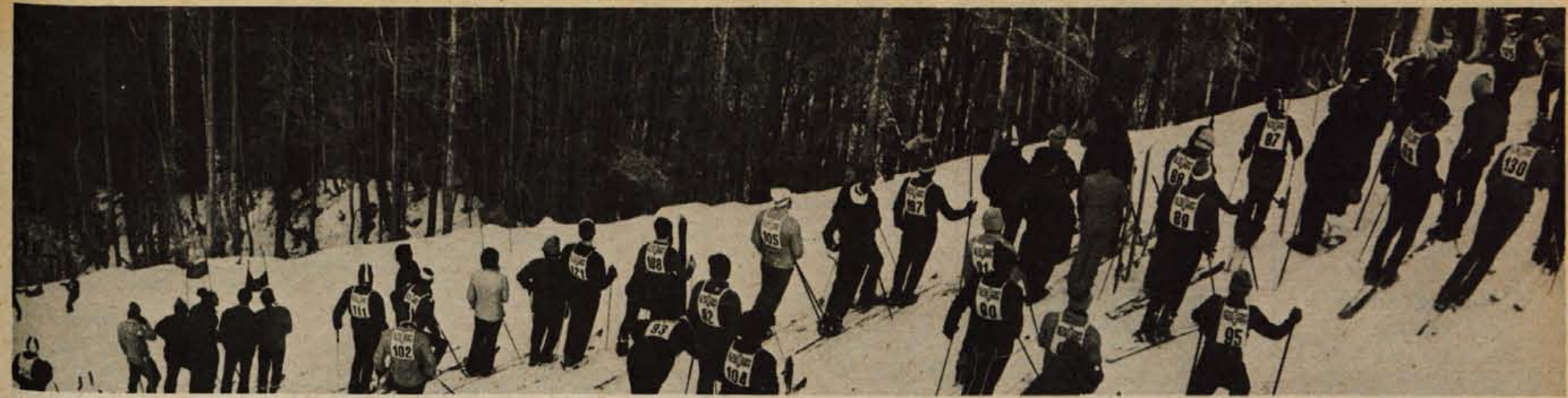
Danes dopoldne bo na Krvavcu IV. tekmovanje v veleslalomu za memorial Igorja Janharja, v Mojstrani pa bodo danes in jutri VII. zimske športne igre občinskega sindikalnega sveta Kranj