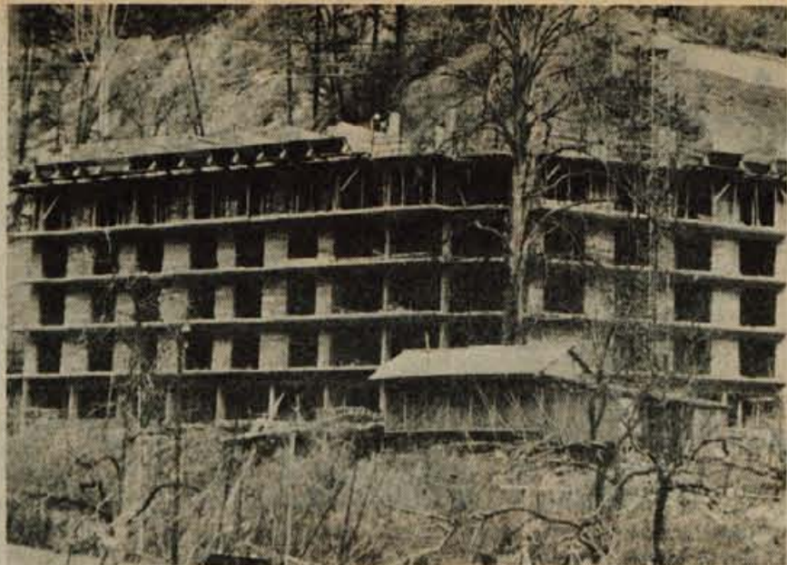
Streha za mirno jesen — Na Zgornjem Plavžu na Jesenicah je jeseniško gradbeno podjetje Sava lani začelo graditi stavbo za tiste oskrbovance doma dr. Franceta Berglja, ki bi jesen življenja radi preživeli skupaj z zakoncem in v udobnejših stanovanjskih razmerah. V stavbi bodo namreč zgradili garsonjere, veliko kuhinjo, dnevni prostor in napeljali vanjo centralno kurjavo. Dom, ki leži v mirnem in lepem kraju Jesenic, bodo sodobno opretili.

Jugoslovanska delegacija, ki jo vodi član izvršnega biroja predsedstva ZKJ Kiro Gligorov, se mudi v Ljudski demokratični republiki Koreji. Tja je odpotovala na povabilo korejske delavske partije. Pogovarjali se bodo o izkušnjah pri gradnji socialistične družbe v obeh državah.