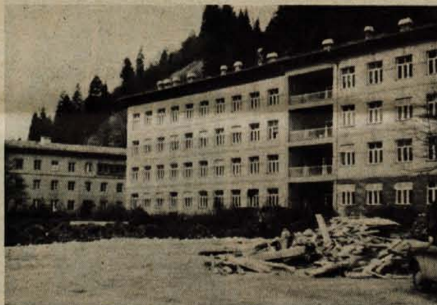
STISKA BO ODPRAVLJENA — Ob Splošni bolnici Jesenice so začeli urejati zemljišče, na katerem bodo postavili nov objekt. Splošno bolnico na Jesenicah so zgradili nekaj let po vojni, zato imajo hude probleme zaradi nefunkcionalnih in tesnih prostorov. Bolnikov je veliko, pa tudi razvoj medicinske znanosti zahteva postavitev sodobnih medicinskih naprav in aparatov v primernejše prostore. Rešili bodo tudi težave ambulantne službe.

Rezultati: 1. Sabo (T. Nadižar) 249, 2. Brezar (Tabor Cerklje) 244, 3. Malovrh (Iskra) 239, 4. Cvetkovič (Sava) 233, 5. Kovač (F. Mrak Predoslje) 231 itd.; ekipno: 1. Franc Mrak I 678, 2. Tone Nadižar 657, 3. Franc Mrak II 605 itd. B. Malovrh