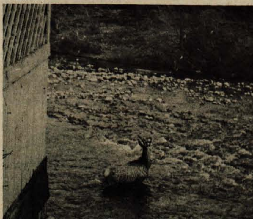
V torek, 19. februarja, so bili Škofjeločani priča nenavadnemu obisku. Prve vesti o »čudnem« gostu so začele prihajati iz vasi Sv. Duh, kjer so sprva otroci domnevali, da gre za osla, kasneje pa se ugotovilo, da je čudna prikazen pravzaprav jelen, ki je prek Jelovice, Selških hribov in Križne gore prišel najbrž nekje iz Jelendola. Malo po 14. uri je nenavadni prišlek prečkal nekaj vrtoč pod poslopjem škofjeloškega zdravstvenega doma in ob sotočju Selšice in Poljanščice v Sovodnju preplaval Soro. Nasproti športnega igrišča je nato prečkal živo mejo, mimogrede podrl na cesto žično ograjo s tremi cementnimi stebriči vred in si tako utrl pot v naselje Puštal. Le malo kasneje se je ponovno znašel v vodi pod »hudičev« brvjo, kjer se je »kopale« celih petnajst minut! Kratke trenutke so izkoristili številni ljubitelji živali za fotografiranje in opazovanje. Po uspelem »poziranju« fotografom se je jelen ponovno spoprijel z ograjo pri kopalšču, ki pa tokrat ni popustila. Obšel je je, zapustil mesto in se izgubil v bližnjem gozdiču! M. Mavri