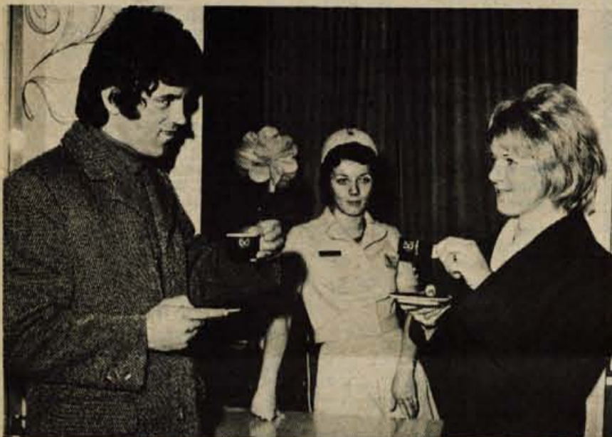
Lesnina iz Ljubljane je odprla leta 1972 na Primskovem sodobno skladišče in prodajalno pohištva s skupno površino 1200 kvadratnih metrov. Največja gorenjska prodajalna pohištva s široko izbiro blaga najboljših in največjih jugoslovanskih proizvajalcev je odprta vsak dan od 7. do 19. ure, v sobotah pa od 7. do 13. ure. Prodajalci so lesni strokovnjaki in so zato za vsakega kupca tudi dobri svetovalci. Februarja so v prodajalni prodali za 400 milijonov starih dinarjev blaga. Kupcem nudijo poldrug milijon dinarjev kredita z 20-odstotnim pologom, vendar brez porokov. Dostava na dom je brezplačna. Razen tega ima Lesnina v Kranju še prodajalno na Titovem trgu, ki se je specializirala za prodajo kuhinjske opreme. Lesnina praznuje letos 25. obletnico delovanja. Ob tej priložnosti so si v kranjski poslovalnici omislili zanimivo akcijo. Vsakega, ki od 15. februarja dalje v prodajalni kaj kupi, povabijo na skodelico turške kave in na šilček ter ob okrepčilu pokramljajo o usakdanjih problemih, predvsem pri nakupu in izbiri pohištva. (jk)