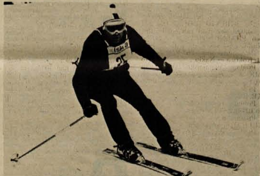
Silvo Matelič starejši (RTV Ljubljana), kljub drzni vožnji ni mogel premagati svojega sina.

moški — 1. skupina: 1. Plešnar (RTV Ljubljana) 1:17,39, 2. Pogačnik 1:18,65, 3. S. Matelič ml. (oba Dnevnik) 1:19,41, 4. Lavrič (RTV Ljubljana) 1:22,38, 5. Maver (itd) 1:22,79; 2. skupina: 1. Urbas (Kmečki glas) 1:25,52, 2. Lapajne (Delo) 1:26,01, 3. Martelanc (Radio Ljubljana) 1:31,13; 3. skupina: 1. Krejač (RTV Ljubljana) 1:30,18, 2. Rombo (Mladina) 1:36,00, 3. Puharič (Radio Ljubljana) 1:38,78; 4. skupina: 1. Časl 1:22,01, 2. Bulc (oba RTV Ljubljana) 1:25,19, 3. Dragojevič (Radio Jesenice) 1:25,55... 13. Učakar (Glas) 1:45,11. -dh