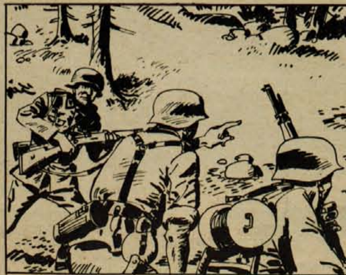
Skozi meglo naj bi se prvi vod priplazil do župnišča in ga zasul z bombami. II. vod pa naj bi pod kritej mitraljezca Bineta napadel in opravil z Nemci v šoli. Takrat pa so nam za hrbet prišli štirje nemški telefonisti in pod njihovimi iznenadenimi streli je padel naš pošt. delegat Töne.