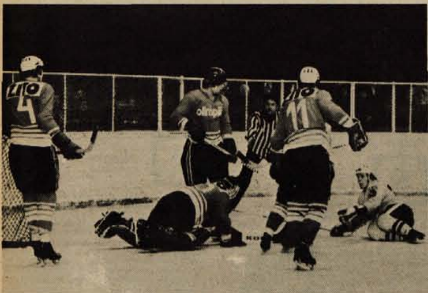
Takih in podobnih prizorov je bilo na sredinem derbiju na pretek.

Pod Mežakljo so v sredo ustoličili letošnjega hokejskega državnega prvaka — V tekmi za najvišji jugoslovanski naslov v najkvalitetnejšem derbiju zadnjih pet let je železarjem uspelo premagati večnega nasprotnika in ob srebrnem jubileju, 25-letnici hokeja na Jesenicah, osvojiti že 17. zvezdico — Sodniški par Erhard in Görtner (ZRN) sta pokazala vse odlike dobrega sojenja