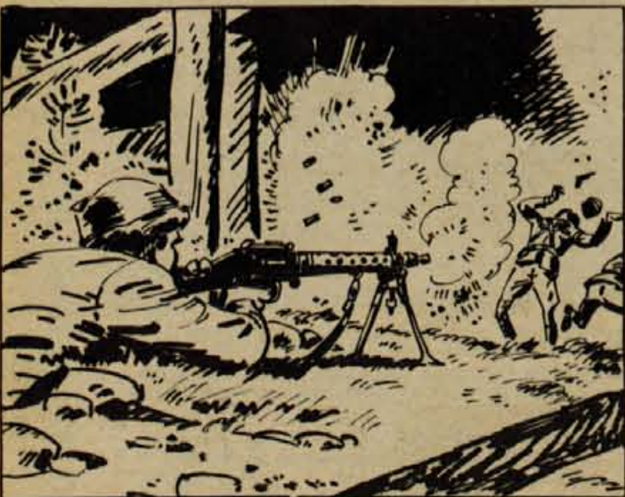
Náš mitraljezec je oddal rafal v tisto gručo. Nemški oficir je zakrilil z rokami in padel po tleh, drugi pa je začel streljati v vojake, dokler tudi njega niso zvnili. Vojaki so se unaknili nazaj v šolo.