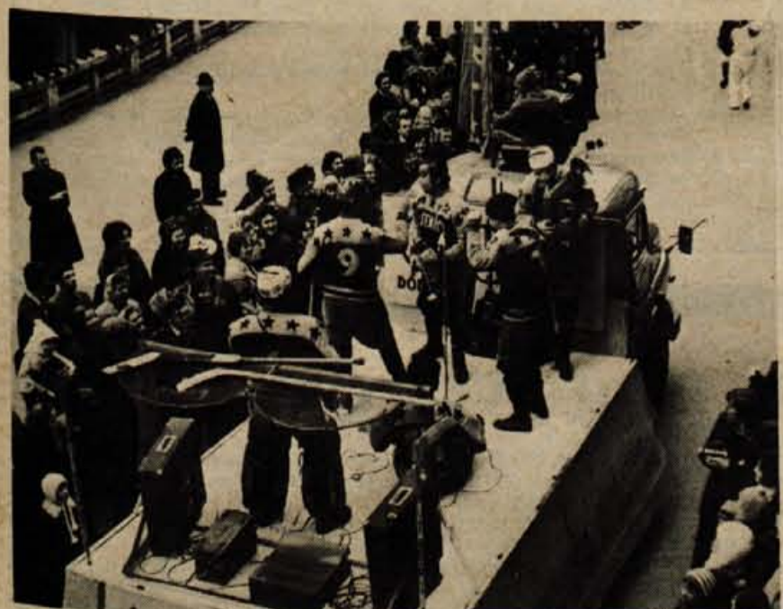
Pustove norčije so za nami. Tudi na Gorenjskem se jih letos ni manjkalo. V nedeljo popoldne so si Blejci, Blejke, Blejčani, Blejčanke in drugi navzoči izvozili »firbe« lahko »napasli« oči na Pustovi »vojni« paradi na Bledu. Med številnimi zbadljivimi in norčavimi prikazi, smo videli tudi hokejiste, ki so tokrat raje igrali na inštrumente. No, kot rečeno, je pust za nami in drevi ob 17.30 bo na Jesenicah odločilna tekma.