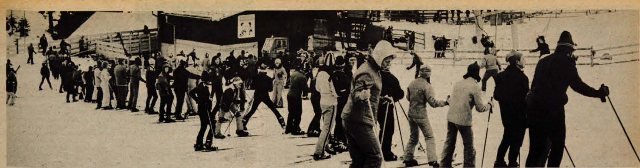
Za smučarjijo pride letos prav vsaka krpa in vsak centimeter snega. Sindikalna tekmovanja se vrstijo. Naš posnetek je s Krvavca, kjer bo ta teden smučarska »živiliada«