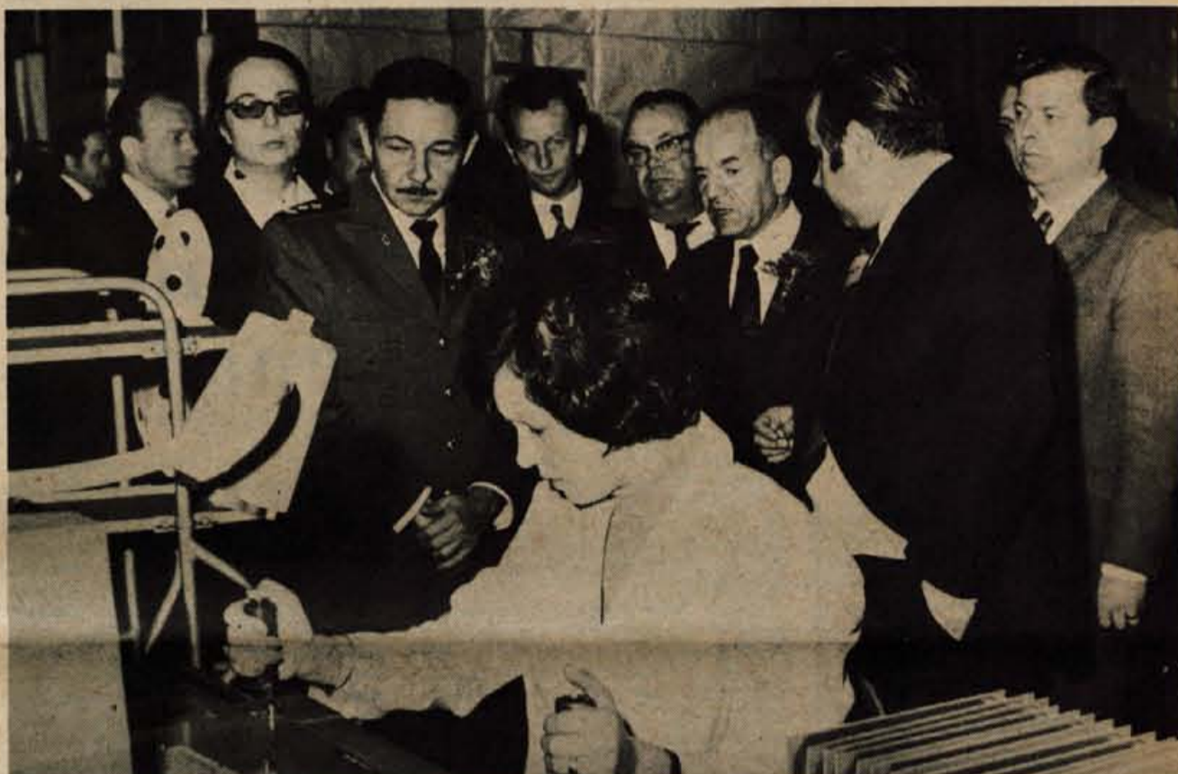
Vodja kubanske delegacije Raul Castro si je z zanimanjem ogledal Iskrino tovarno na Laborah

V razpravi so menili, da se za temi načrti dejansko skriva le hlajenje jedrske elektrarne v Krškem in poudarili, da bi bila zavezitev Radovne prehud poseg v naravo, ki si ga tudi na račun predvidenih ekonomskih koristi ne bi smeli privoščiti. Domačini pa so pri tem opozorili še na nevarnost, ki bi grozila vsem zaradi visokega jezusa. Zato so predlagali, naj bi pri hlajenju jedrske elektrarne uporabili hlajenje s stolpi, kar bi bilo sicer dražje, vendar ne bi terjalo takšnih posegov v naravo. Skratka, zavzeli so stališče, da moramo v teznji, da ohranimo okolje, za to tudi nekaj plačati.