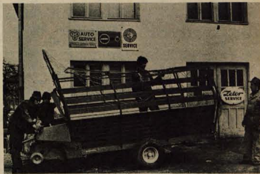
Servis kmetijske, gradbene in gozdne mehanizacije se je preselil z Labor v sedanje prostore v Cerkljah leta 1964. Na servisu je zaposlenih 24 delavcev ter 12 vajencev.

Servis kmetijske mehanizacije v Cerkljah se bo prihodnje leto preselil v industrijsko cono na Primskovem. Še enkrat večjo delovno površino bo dobil in storitve bodo lahko še kvalitetnejše. Stevilni gorenjski in drugi kmetje bodo imeli do servisa še bližje. J. Košnjek