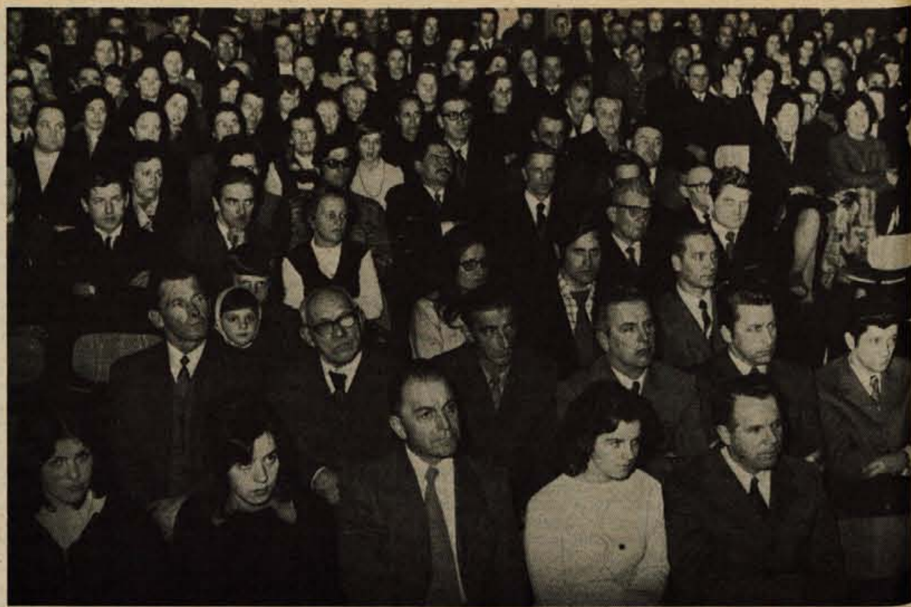
V petek so v Železnikih odprli prenovljen kulturni dom. Gostje in domačini, ki so do zadnjega kotička napolnili dvorano, so z zanimanjem prisluhnili kulturnemu programu »O Vrba« 2 v izvedbi igralcev domačega DPD Svoboda mladinskega aktiva in pionirjev osnovne šole.