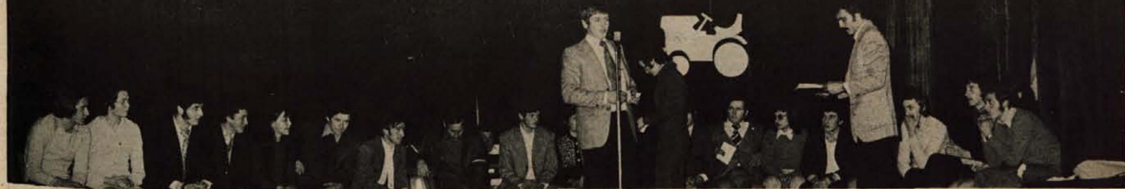
V soboto je bilo na Primskovem tekmovanje mladih zadrušnikov na temo Kaj veš o kmetijstvu. Več o prireditvi berite na 5. strani