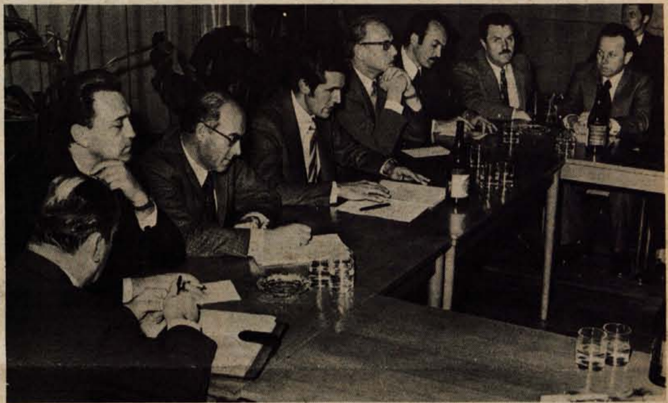
Člani ZIS so se v petek v Kranju pogovarjali z gorenjskim gospodarsko-političnim aktivom o družbeno ekonomskem razvoju

Sledil je kulturni program, ki so ga pripravili člani nagrajenca, Zveza kulturno prosvetnih organizacij Tržič. J. Košnjek