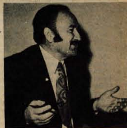
Ampak vmes bomo pokurili še precej sveč.

J. Š.: Jasno je, da bomo v varstvo narave prisiljeni vložiti več denarja in truda kot doslej. Sem zagovornik pametnega optimuma. Odklanjam ideje skrajnežev — in naj pripadajo katerikoli strani. Zahteva po, denimo, umetnem zaviranju in omejevanju gospodarske rasti ni niti smotrna, niti praktično izvedljiva.