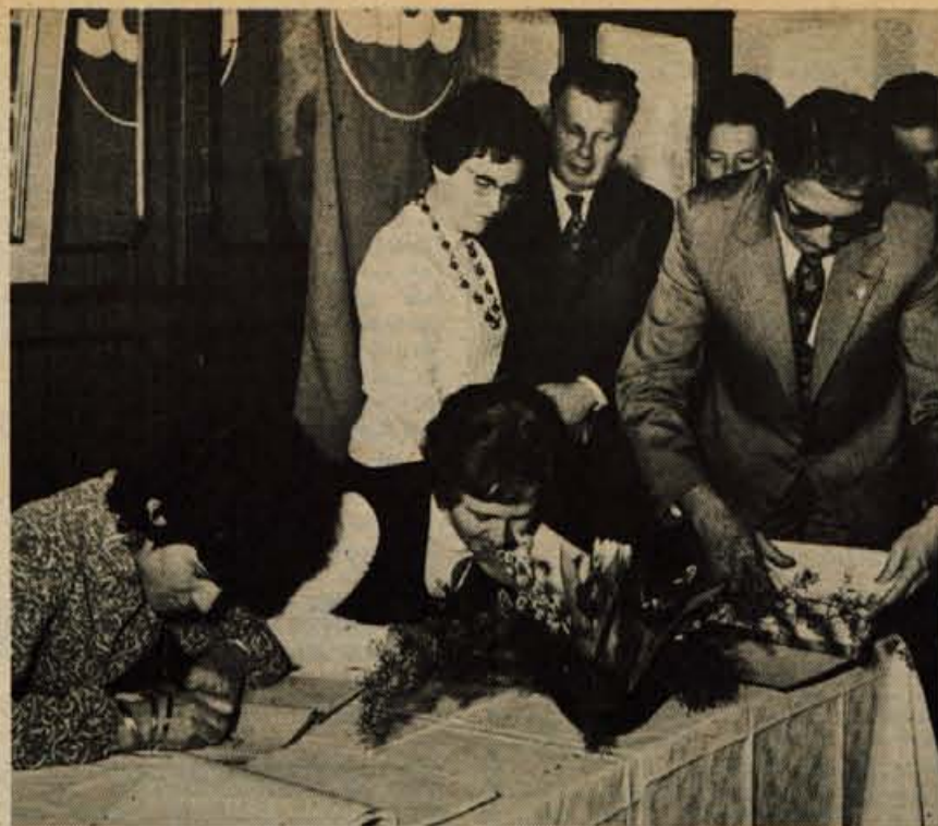
V torek, 12. februarja, je trgovsko podjetje Rožca po predhodnem referendumu podpisalo samoupravni sporazum in s tem pristopilo k združenemu podjetju ABC. ZTP ABC združuje zdaj že štirinajst OZD, med drugim tudi Loko iz Škofje Loke.

V soboto nameravajo v Tržiču organizirati seminar za člane koordinacijskih odborov za volitve po organizacijah združenega dela in krajevnih skupnostih. Na njem bodo razpravljali o praktični organizacijski praksi priprave na volitve ter o izdelavi statutov krajevnih skupnosti. J. Košnjek