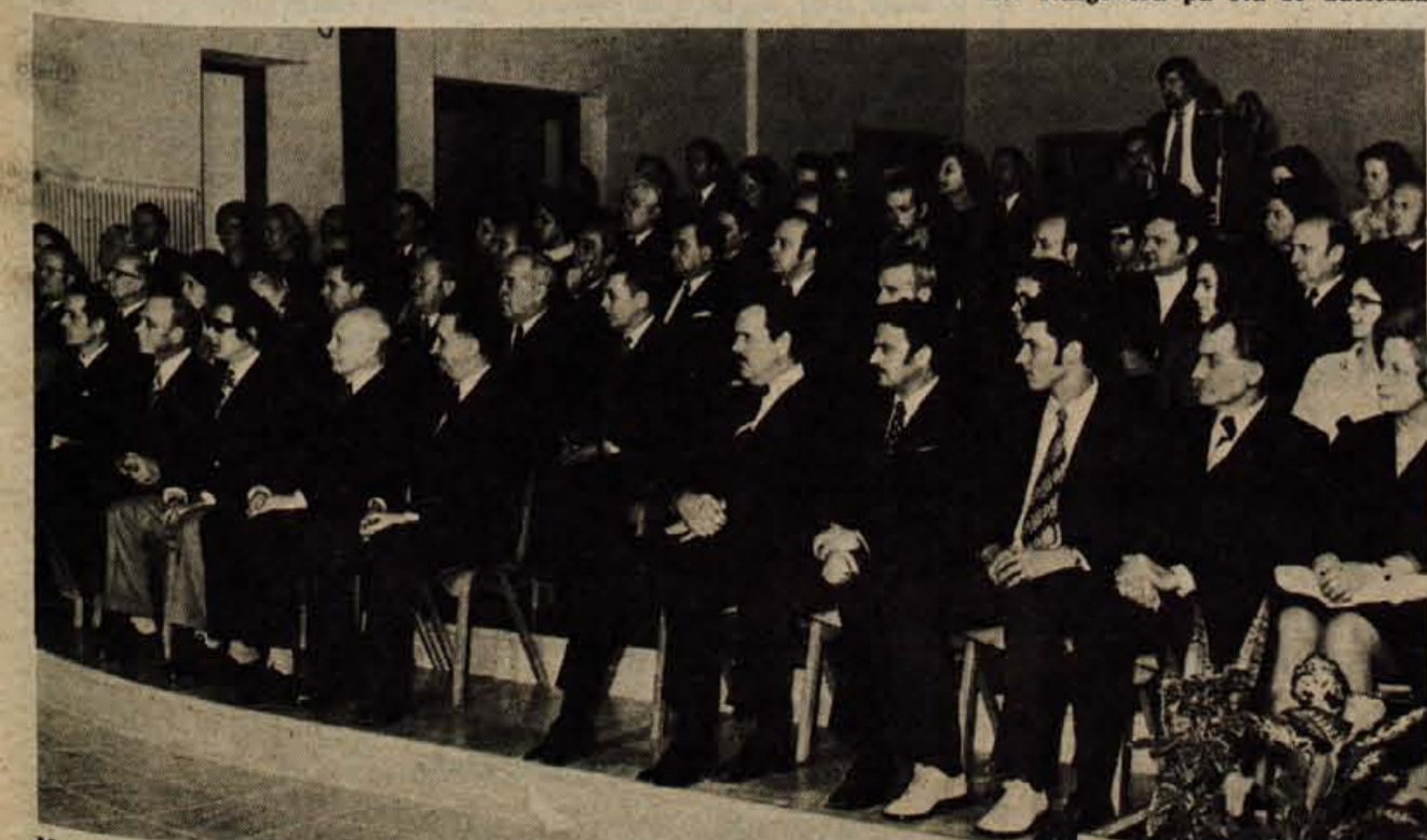
V soboto so v Tržiču podelili Prešernove nagrade za leto 1973