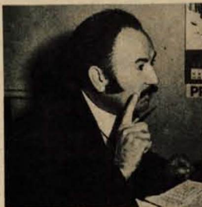
... moramo najprej okrepiti prenosno omrežje ...

GLAS: Torej smemo v kratkem pričakovati reprizo jesenskih večerov ob svečah, izpadov v proizvodnji in pozivov k varčevanju?