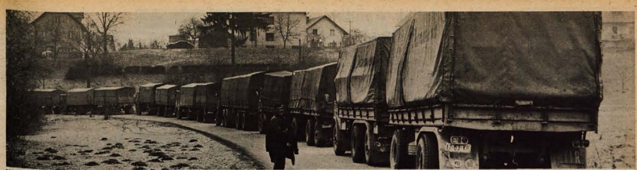
V ponedeljek je dolga kolona težkih tovornjakov pripeljala v Oljarico Britof del 2000-tonske pošiljke kitajske soje. Sojino seme je priromalo v našo državo z ladjo