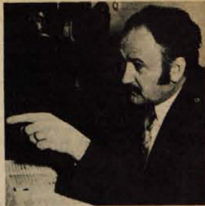
... nato pa racionalizirati porabo.

— in investicijsko sodelovanje pri realizaciji načrtov termoelektrarne Tuzla V. Kajpak ne smemo pozabiti hidrocentrale Srednja Drava II (112 MW), ki bi morala, podobno kot TE Tuzla V, začeti obratovati januarja