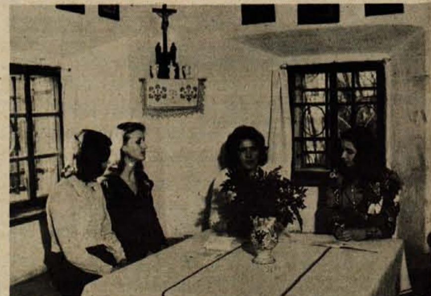
V petek, 8. februarja, je bila v Prešernovi rojstni hiši v Vrbi proslava, ki jo je pripravila kulturna skupnost Jesenice. Na proslavi so sodelovali jeseniški študentje, gimnazijci in oktet iz Zirovnice.