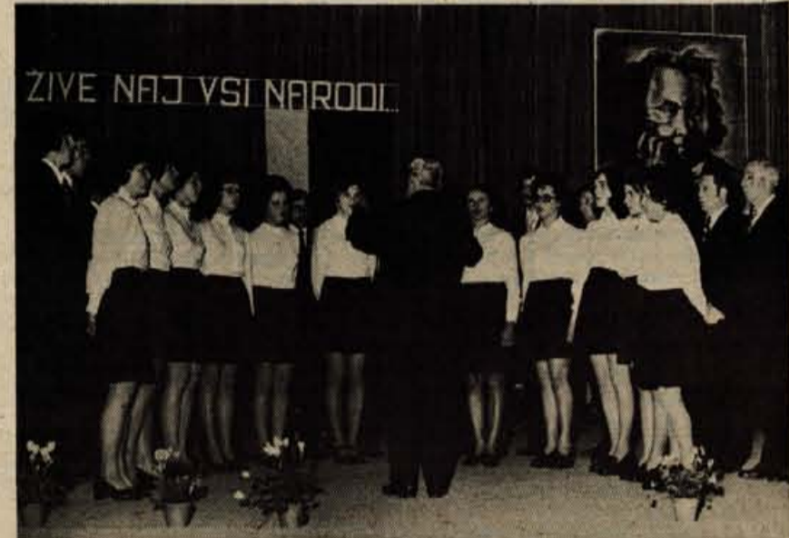
Osrednja proslavitev kulturnega praznika v radovljški občini je bila v soboto zvečer v festivalni dvorani na Bledu. Na prireditvi je nastopil tudi pevski zbor iz Radiš na Koroškem (na fotografiji).