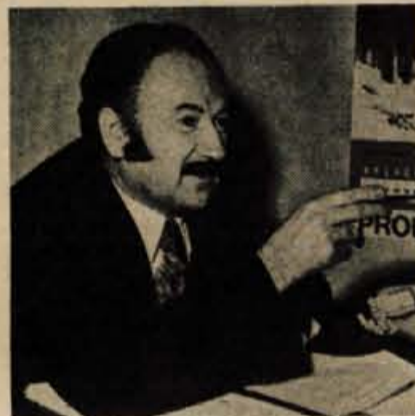
... in hkrati povečati lastno proizvodnjo elektrike, ...

J. Š.: Ostanimo kar pri problemu prenosne mreže. Dolgo, predolgo smo jo zanemarjali. No, napako obeta odpraviti 380-kilovoltna »zanka«, ki bo zaobjela vseh šest republik in ki je že v izgradnji. Dela sofinancira Mednarodna banka za obnovo in razvoj. Ni skrivnost, da edino čvrsta, sklenjena povezava posameznih regij omogoča učinkovito vključevanje v širši evropski prostor. Prednosti tega povezovanja tičijo v nemotenem izravnavanju nihanj znotraj SFRJ ter, nič redkeje, znotraj stare celine. Seveda so izravnave samo kratkoročna rešitev. Dolgoročno lahko omogočijo le lastni, dovolj zmogljivi proizvodni objekti. Večina projektov zanje smo brez pridržkov odobrili. V mislih imam plinsko elektrarno (PE) Brestanica z močjo 69 megawatov, ki bo dokončana konec decembra 1974, ter hidroelektrarno (HE) Moste (10 MW), nekakšen miniaturni prototip kasnejše HE Pohorje, katere akumulacijsko jezero naj bi ponohi polnili s prebitkom energije nuklearnega orjaka v Krškem, da bi nato, ob dnevnih konicah, pomagala tešiti potrošniško lakoto. Nadalje velja omeniti rekonstrukcijo HE Fala (17 MW), postavitev PE Trbovlje (60 MW) — stekla bo najpoznejše do 31. 12. letos