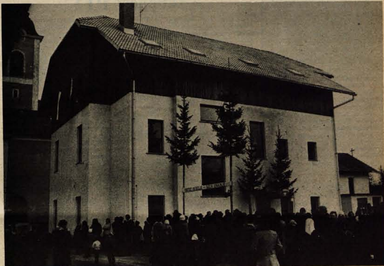
Prenovljena stoletna šola v Voklem. Odprli so jo v soboto popoldne