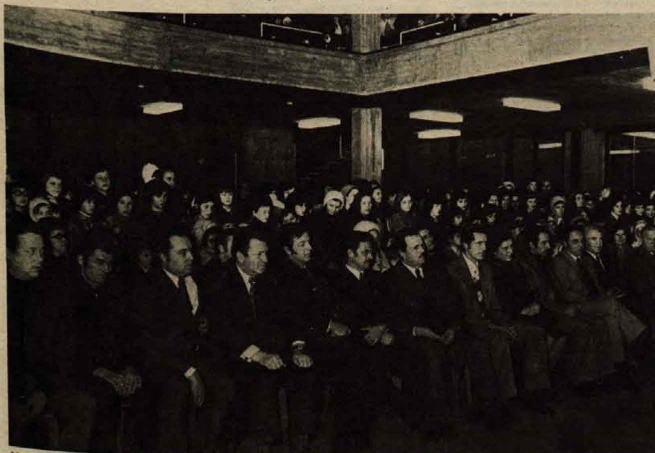
V soboto so odprli novo osnovno šolo v naselju Vodovodni stolp v Kranju. Ob otvoritvi je bil krajši kulturni program.