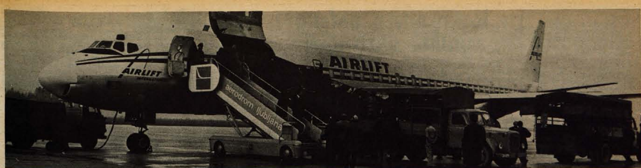
Ameriško letalo DC-8, ki je v ponedeljek pripeljalo na Brnik iz Amerike za Ljubljanske mlekarne 90 krav in 2 bika. Več o nenavadnem dogodku v sobotnem Glasu.