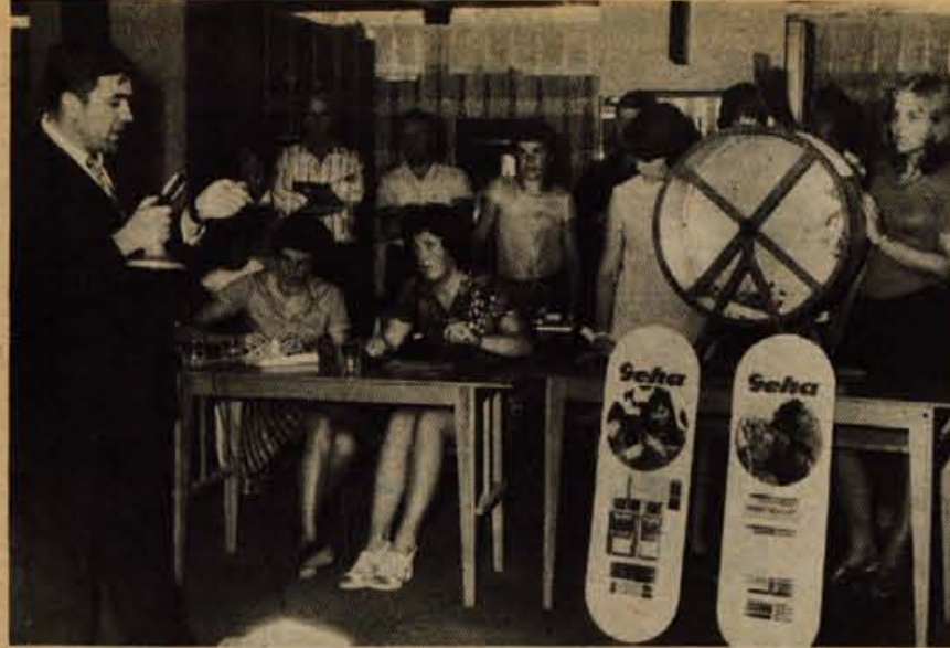
Žrebanje Gehe na mednarodnem Gorenjskem sejmu v Kranju.