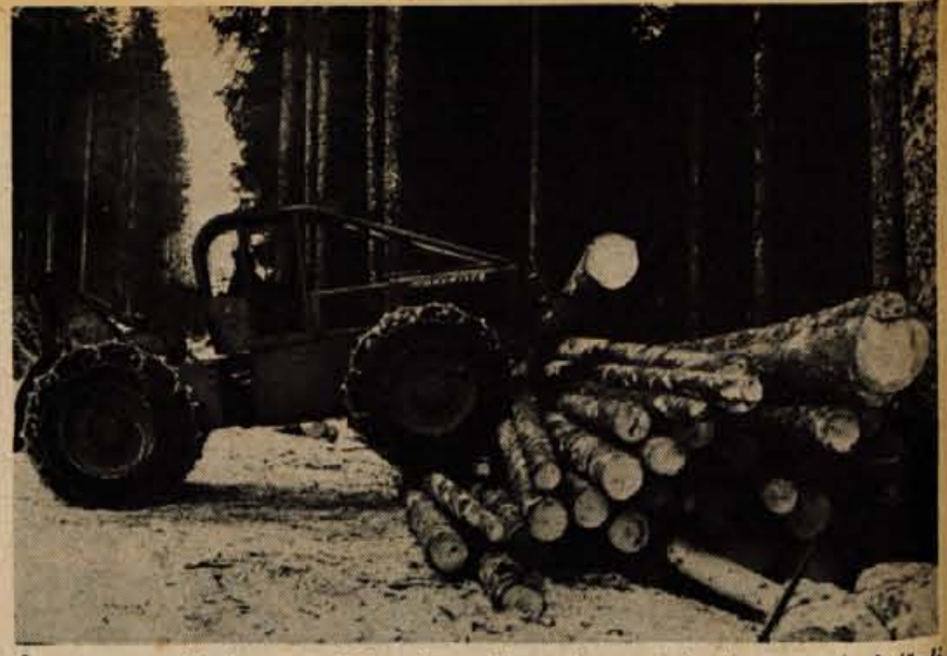
Čas za spravilo lesa. — Najmodernejši stroji so gozdarjem precej olajšali delo.

Interesente obveščamo tudi, da informacije z drugih področij dobijo lahko direktno tudi na občinskih sindikalnih svetih, občinskih konferencah SZDL, pristojnih občinskih upravnih organih, na Skupnosti invalidskega-pokojninskega zavarovanja Kranj, Komunalnem zavodu za socialno zavarovanje Kranj, upravi carin, pri enotah Ljubljanske banke, Zavarovalnici Sava Kranj, Zavarovalnici Maribor — predstavništvu v Kranju in drugih. Vsem dopustnikom želimo prijetno bivanje v domovini!