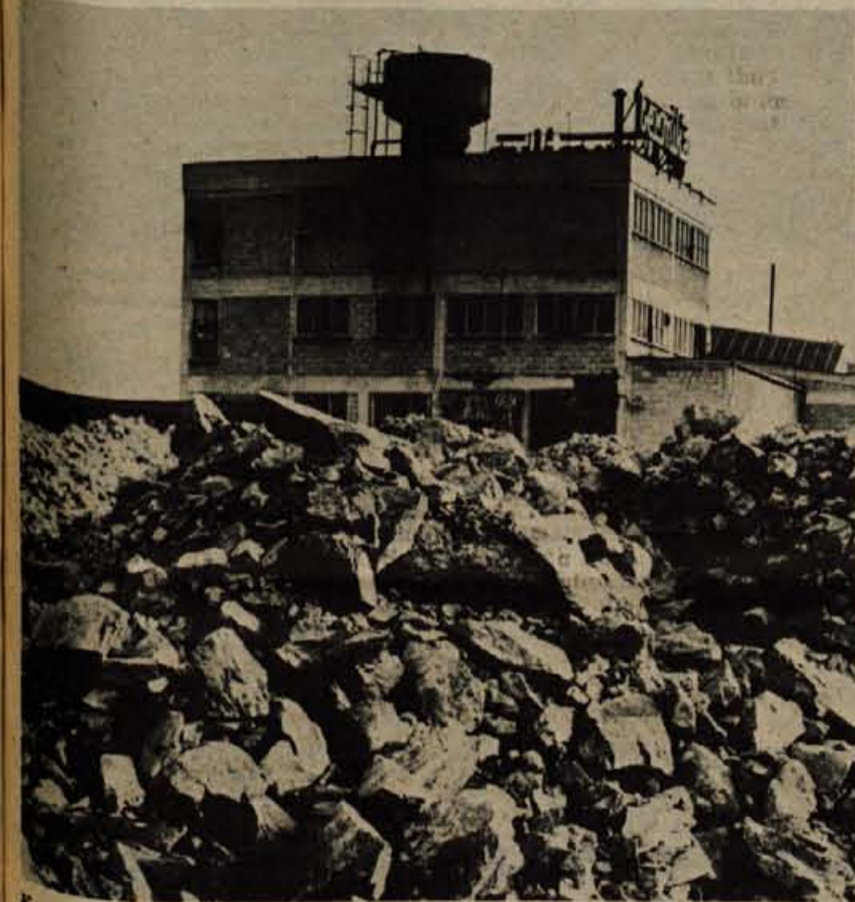
Kamene kocke so surovina za izdelavo mineralne volne.

Besedilo: L. Bogataj