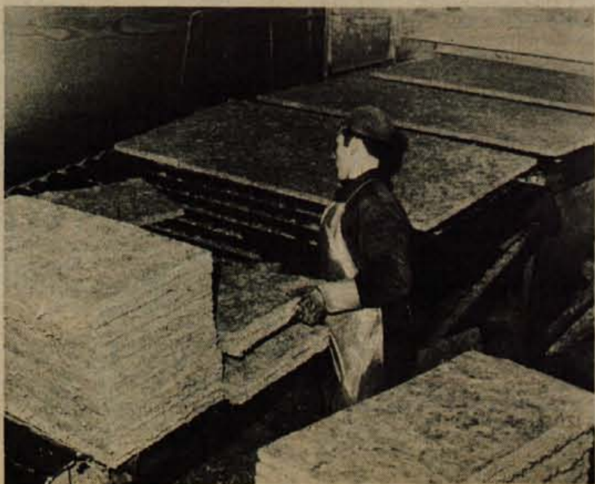
S tekočega traku prihajajo že narezane plošče tervola.