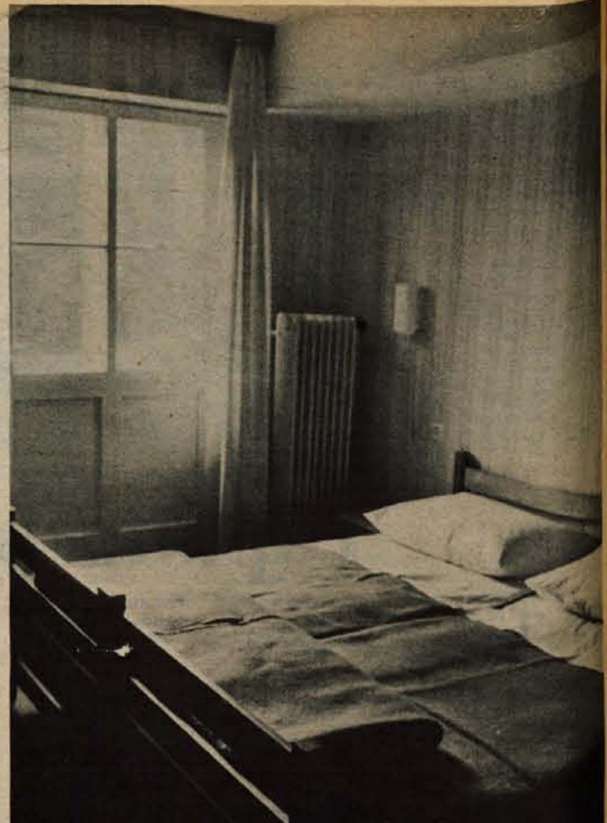
90 postelj, bazen, savna, smučarska vlečnica — vse to čaka goste v Sport-hotelu na Pokljuki. Menda je za noveletne praznike Transturistov hotel že zaseden.

V Transturistu se seveda dobro zavedajo pomena bližnjih sprememb. So njihov zagovornik in sopoludnik, čeprav obenem vedo, da ni nič manj važno nenehno dviganje kakovosti storitev »pod domačo streho«. Poleg raznih oblik pritegovanja deviznih gostov je zanje zmeraj bolj zanimiv jugoslovanski letovišar, ki ni občutljiv na mednarodne politične in ekonomske krize. (V ilustracijo velja omeniti, da so spričo napetosti ob zadnji izraelsko-arabski vojni, spričo energetske stiske in nenadnih omejitvenih ukrepov padle v vodo že sklenjene pogodbe o prodaji 5000 kompletnih penzionov ameriškim in zahodnonemškim dopustnikom ter da bodo izgube hude). V Vojvodini, vzemimo, vlada veliko zanimanje za šolski paket, v katerega je všteto desetdnevno bivanje in oskrba v Bohinju. TOZD hoteli Bohinj nadalje obljublja smučanje na kredit; potrošnik bo plačal vnaprej samo 1/3 vsote, ostanek pa kasneje, v dveh obrokih. Prižgali so tudi zeleno luč ekskurzijam: odprli jim bodo vrata objektov, ki jih imajo drugače po sezoni zaprte. Cen Transturist ni pretirano navil. Odgovorni pač upoštevajo relativni