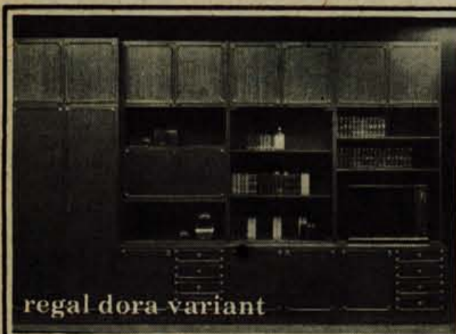
regal dora variant