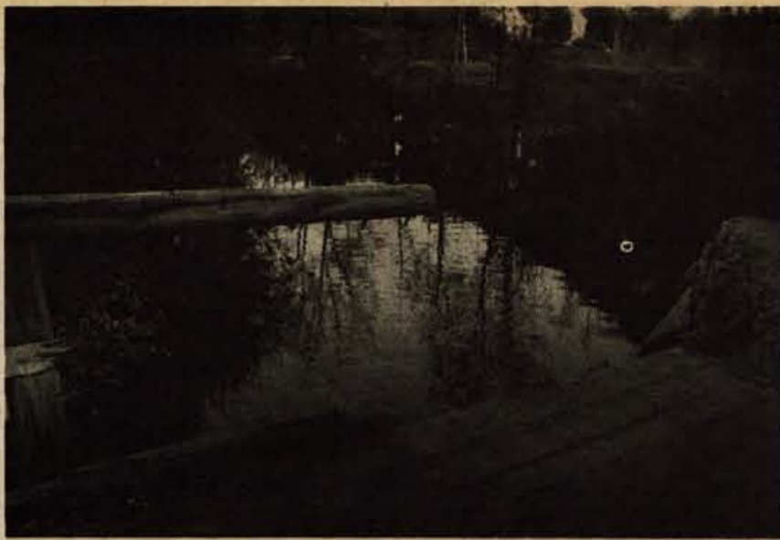
Kranjska TRIM steza je bila odprta za letošnji dan mladosti in teče v glavnem po gozdu v bližini Ovcana. Na severnem delu mora strimovec prek mostu čez potok Rupenščica. Most je že nekaj časa brez dobrega dela zaščitne ograje (na fotografiji). Da se je ograja sesula kar sama, je bolj malo verjetno. Najbrž enemu od »ljubiteljev« trima številna zvirala ob progi očitno niso bila dovolj in je svojo odvečno energijo potrošil za podiranje ograje na mostu. (jk)