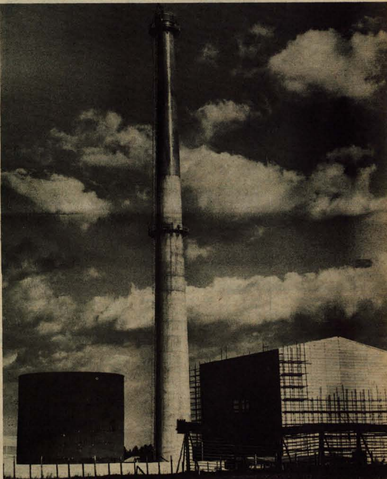
Ker ideja, da bi kranjsko gospodarstvo zgradilo skupno kotlarno, ni prodrla, se je tovarna Sava odločila, da bo na Laborah zgradila novo, sodobno kotlarno. Pomemben objekt bo kmalu usposobljen za obratovanje. Glavna gradbena dela izvajata podjetji Vatrostalna in Mostogradnja. Posebnost nove Savine kotlarne je 80 metrov visok dimnik. (jk)

Kot smo zvedeli, je pogorelo gospodarsko poslopje že dolgo predstavljalo »črno« zbirališče klatežev in brezdomcev, kar varnostnim organom ni ostalo skrito. Tóda številna opozorila so pri odgovornih naletela na gluha ušesa. Lahko torej rečemo, da je nesreča deloma posledica malomarnosti, saj bi uporabniki zgradbe morali zaščititi dostop v njeno notranjost in preprečiti nepovabljenе obiske sumljivih gostov. (-ig)