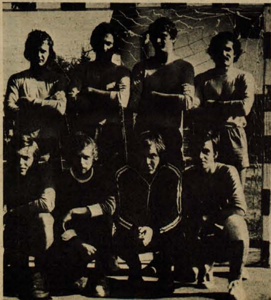
Mladi rokometnaši Žabnice.