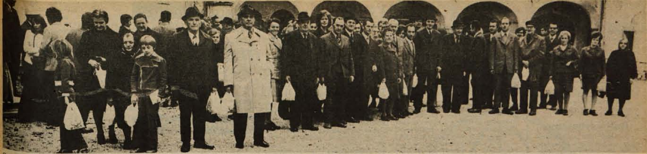
Sobotni izlet izžrebanih naročnikov Glasa. — V tehničnem muzeju v Bistri je veletrgovina Živila obdarila naše naročnike. — Foto: A. U. — Več z izleta preberite na zadnji strani.