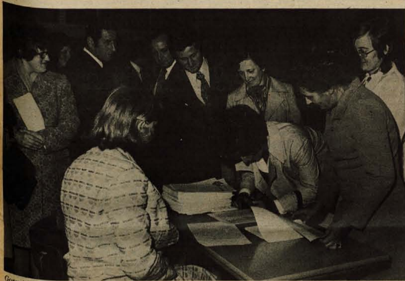
Gorenjski poštni delavci so v nedeljo dopoldne v Kranju podpisali samoupravni sporazum o združitvi temeljnih organizacij združenega dela v Podjetje za PTT promet Kranj

GLASILO SOCIALISTIČNE ZVEZE DELOVNEGA LJUDSTVA ZA GORENJSKO