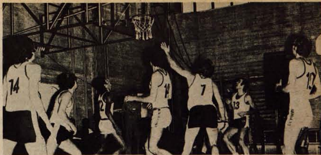
V telovadnici OŠ France Prešern v Kranju se je v sredo pod pokroviteljstvom Ljubljanske banke začel petdnevni košarkarski turnir. Levo je moštvo organizatorja kranjski Triglav.