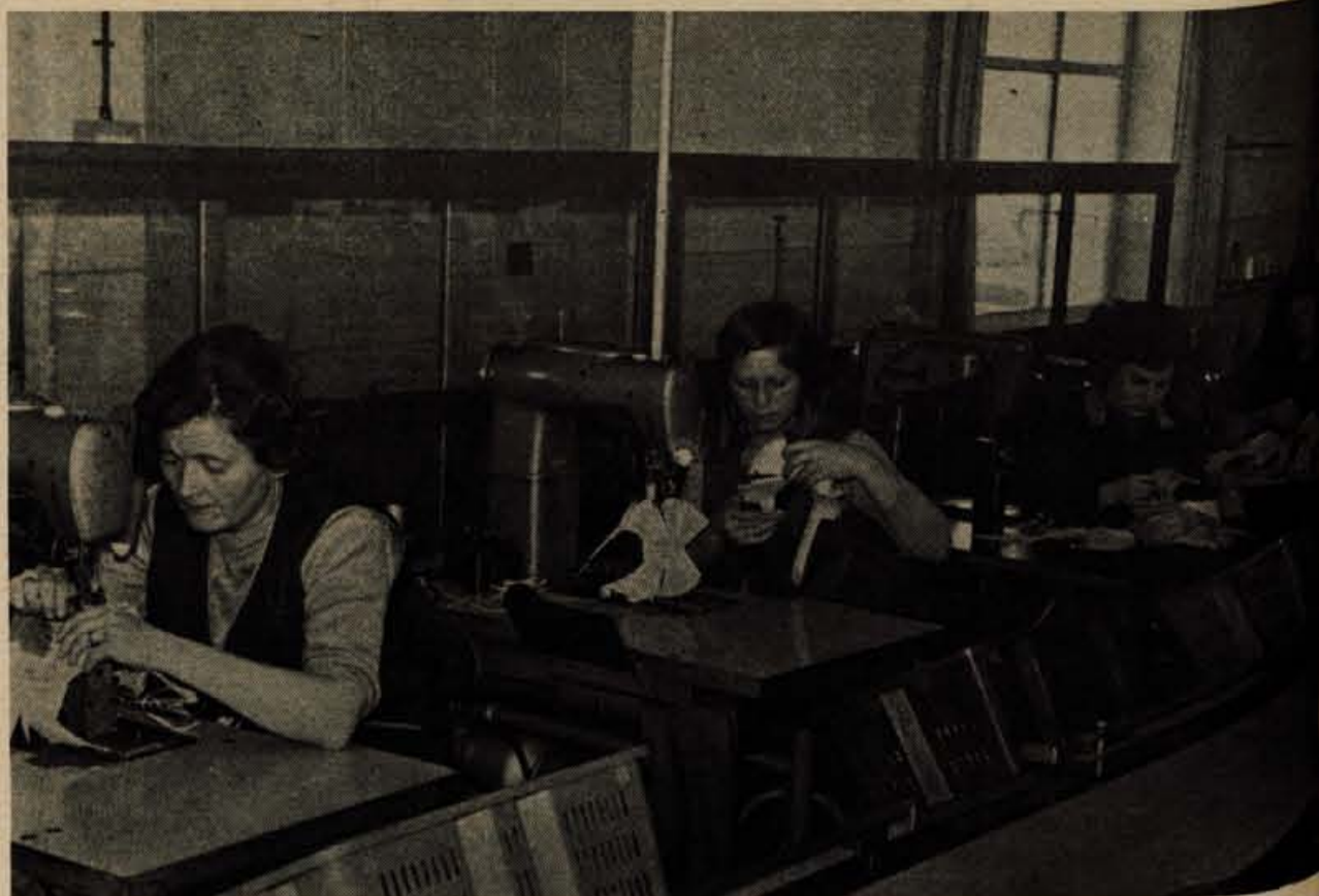
V šivalnicah gornjih delov delajo večinoma ženske

Kolektiv tovarne obutve ALPINA iz Žirov čestita vsem delovnim ljudem Žirov za krajevni praznik 23. oktobra. -Os